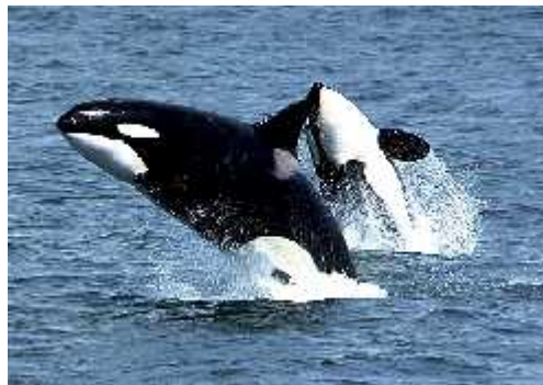
Slika 3. Kit ubojica, Orcinus orca , iz reda Cetacea

Istraživanja na dobrom dupinu ( Tursiops truncatus ) pokazala su da tijekom perioda od 24 sata postoji 7 epizoda unilateralnog spavanja. Hemisfere se tijekom tih epizoda naizmjenice “bude” i “uspavljaju”, provode i približno 2 sata u jednoj epizodi unilateralnog spavanja. Raspodjela vremena spavanja me u hemisferama nije jednaka. Kod individualnih jedinki može se govoriti o dominaciji jedne hemisfere ali na razini vrste ne postoji jednostrana cerebralna dominacija kad se radi o spavanju. (Mukhametov 1984.)