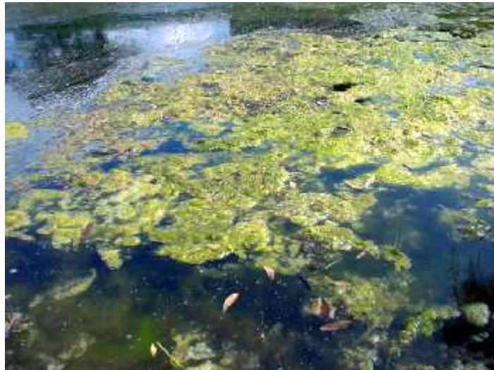
Slika 8. Cvjetanje cijanobakterije Lyngbya majuscula

Toksini morske cijanobakterije Lyngbya majuscula smatraju se uzro nikom dermatitisa kod ljudi. Ova vrsta stvara cvjetanja na dnu mora. Pod utjecajem metaboli kih plinova ta se masa potom uzdiže na površinu ( slika 8. ) . Vjetar i morske struje izbacuju te mase na obale te imaju utjecaja na širenje toksina zrakom. Cijanotoksini ove vrste su debromoaplizijatoxin, aplizijatoxin and lingbijatoxin, te op enito uzrokuju iritaciju kože, o iju te dišnih puteva ( www.whoi.edu ). Lyngbya i njezina cvjetanja prisutna su u tropskim i subtropskim širinama, te na podru ju Australije i Floride.