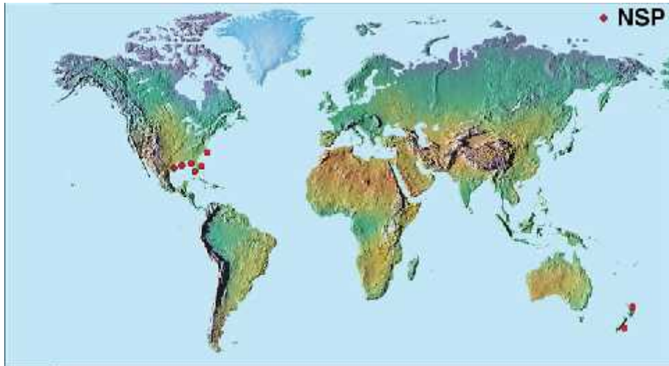
Slika 3. Podru je pojavljivanja NSP-toksina ( www.whoi.edu )

Simptomi NSP trovanja kod ljudi su osje aj utrnu a usana, jezika, gubitak okusa, usporen puls, promjenjiv osje aj topline i hladno e, proširene zjenice, dijareja, a oporavak slijedi nakon dva dana.