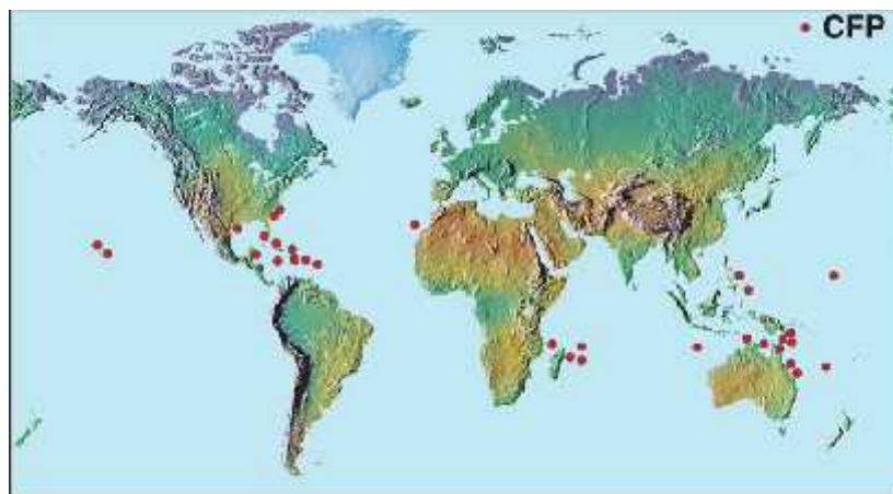
Slika 4. Područja pojavljivanja CFP-toksina ( www.whoi.edu )

Uglavnom sve ribe koraljnih grebena mogu biti vektori. Primjerice, ribe papagaji, jedu alge sa koralja uključujući i toksičnu vrstu G. toxicus , te tako nakupljaju toksin u masnom tkivu. Predatori takvih vrsta hrane i se njima, toksin još jače koncentriraju. Primjerice, barakuda u Karibskom moru, te murina u Pacifiku, smatraju se rizničnim vektorima u trovanju ljudi ciguatoksinom (Halstead, 1978.).