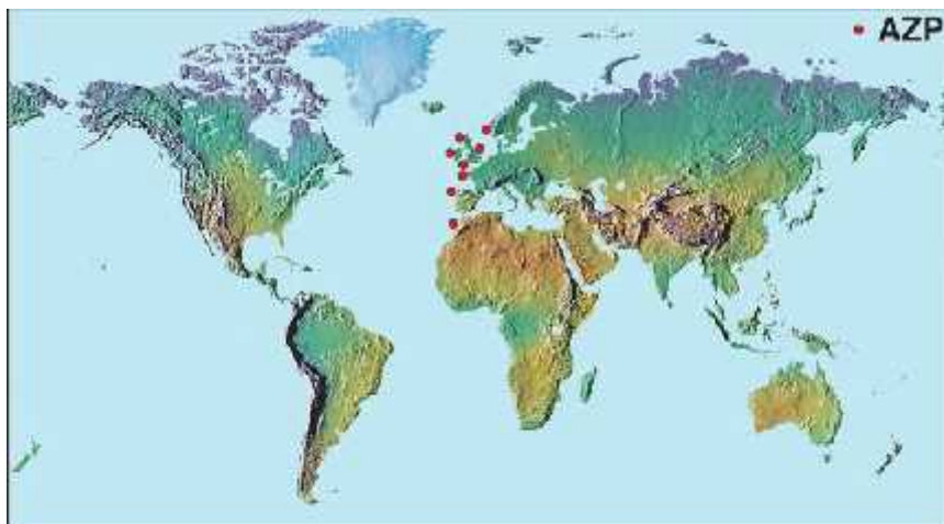
Slika 6. Podru ja pojavljivanja AZP-toksina ( www.who.edu )