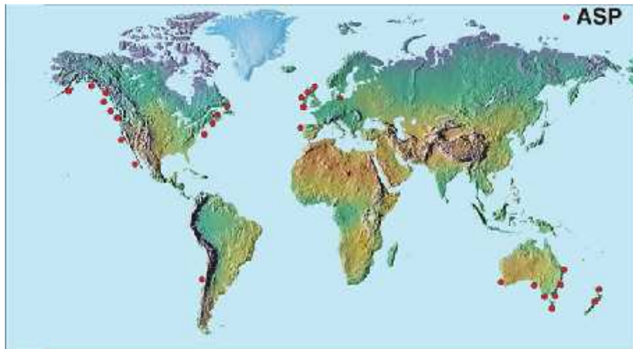
Slika 7. Područja pojavljivanja domoi ne kiseline

Cvjetanja toksi nih dijatomeja i trovanja domoi nom kiselinom zabilježeni su u područjima uz obalu Sj. Amerike, Europe, Isole, te Australije i Novog Zelanda ( Slika 7. )