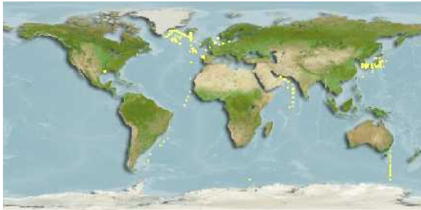
Slika 5. Rasprostranjenost vrste Prorocentrum minimum ( species-identification.org )

Simptomi trovanja su mučnina, povraćanje, bol u želucu, zatvorenost, glavobolja, slabost, gubitak apetita itd. Ovim simptomima mogu prethoditi nervoza, te krvarenje iz nosa, usta i desni. U ozbiljnim slučajevima može se javiti žutica, te modrice po prsima, vratu i rukama. Također se javlja i anemija. U slučaju ozbiljnog trovanja javlja se žuta atrofija jetre, ekstremno uzbuđenje i delirij, te nastupa koma. Za ovu vrstu trovanja vezuje se izuzetno velika smrtnost.