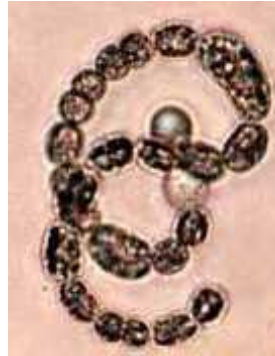
Slika 9. Anabaena circinalis

Postoji još nekoliko rodova cijanobakterija koji proizvode cijanotoksine. To su npr. Aphanizomenon (proizvodi saksitoksin te clindrospermopsin), Nodularia (proizvodi nodularin), Nostoc (mikrocistin) i dr. Uglavnom su sve organizmi slatkovodnih i braki nih voda.