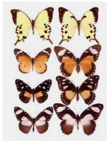
Slika 3. Leptiri iz porodica Danaidae i Papilionidae Zadnja tri reda (gledano odozgo) prikazuju nejestive leptire iz porodice Danaidae (lijevi stupac), te ženke leptira Papilio dardanus (desni stupac) koje ih oponašaju. Prvi red prikazuje mužjaka Papilio dardanus (lijevo), te andromorfnu ženku iste vrste (desno). ( http://www.ucl.ac.uk/taxome/jim/Mim2/dardanus.html )

Primjer uspješne primjene mimikrije je i leptir Papilio dardanus (porodica Papilionidae). Leptir je rasprostranjen u subsaharskom području Afrike, a engleski entomolog E. B. Poulton (1924) opisao ga je kao najzanimljivijeg leptira na svijetu. Vrsta pokazuje polimorfizam šara na krilima, a uspješno oponaša vrste roda Danaus i Amauris iz porodice Danaidae (slika 3.). Zabilježeno je čak trideset različitih uzoraka, kojima ova vrsta oponaša nejestive jedinke iz porodice Danaidae (Salvato 1997). Zanimljivo je kako samo ženke oponašaju izgled otrovnih vrsta, za razliku od mužjaka koji imaju većinom jednoličan uzorak šara. No određeni broj ženki oponaša i izgled mužjaka (andromorfne jedinke) te se na taj način doprinosi povećavanju broja i mužjaka i ženki u populaciji (Cook i sur. 1994) (slika 3.).