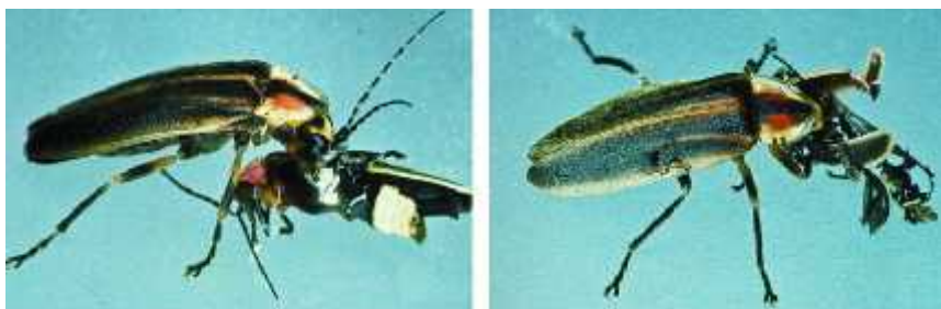
Slika 5. Ženka roda Photuris jede mužjaka roda Photinus http://www.pnas.org/content/94/18/9723.full

Predatorska ženka roda Photuris koristi se vrlo moćnim oružjem kako bi namamila mužjake roda Photinus . Naime, vrlo lukavo i smjelo oponaša svjetlosne signale ženke roda Photinus , kojima ona privlači i mužjake kako bi se parili. Zavedeni tom svjetlosnom igrom, mužjaci upadaju u zamku i postaju lak plijen (Lloyd 1984) (slika 5.). Međutim, pokazalo se kako tom konzumacijom ženke Photuris dobiju i nešto više od same hrane. Jedinke roda Photinus sposobne su same sintetizirati spoj lucibufagin, obrambeni spoj, koji ih čini nejestivima za neke vrste ptica, poput drozdova (Eisner i sur. 1997), ali i za ostale kukcojedne životinje. Lucibufagin se obilno luči i u stresnim situacijama poput napada predatora (posebice ptica i pauka), a uoči toga ženke roda Photuris , koje se hrane na taj način, izbjegavaju pauke roda Phidippus . Što je veća količina lucibufagina to su te jedinke odbojnije predatorima (Eisner i sur. 1997).