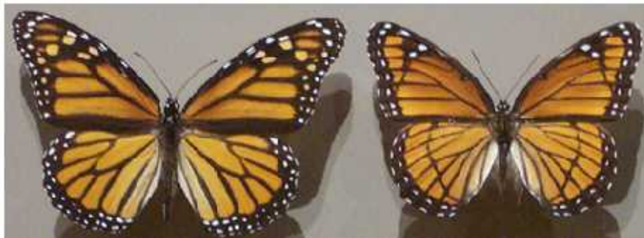
Slika 4. Primjer Müllerove mimikrije Danaus plexippus (lijevo) i Limenitis archippus (desno)

Jedinstvenu pojavu da dvije razli ite nejestive vrste dijele istu, ili vrlo sli nu, aposemanti ku obojenost nazivamo Müllerovom mimikrijom (Resh i sur. 2003).