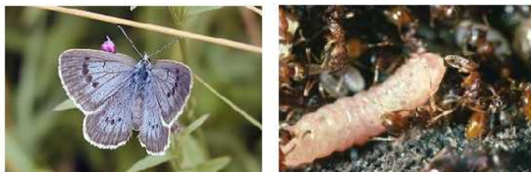
Slika 6. Maculinea rebeli (lijevo) i liinka leptira koju hrane mravi, Myrmica schencki (desno) http://www.macman.ufz.de/index.php?en=15167

Ženke leptira polažu jaja na cvjetne pupove. Iz jaja se ubrzo razvijaju liinke, koje se vrlo kratko hrane pupovima, a zatim padnu na tlo i tamo čekaju mrave. Liinke se razvijaju u razdoblju najveće aktivnosti mrava koji ih ubrzo pronalaze. Mravi ih prepoznaju kao svoje vlastite te ih odnose u koloniju, gdje se dalje brinu o njima (Thomas i sur. 1998).