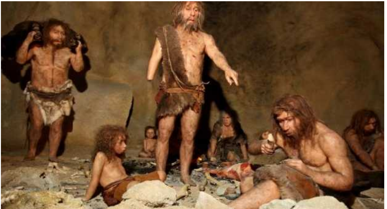
SLIKA 4: Ognjište u špilji, atmosfera života obitelji neandertalaca (Muzej krapinskih neandertalaca)

filogeneti kom položaju, jedni autori smatraju kako neandertalci nisu bili sposobni proizvoditi raspon zvukova potreban za govor modernog ovjeka ili pak sumnjaju u kompleksnost njihova jezika. Neki autori čak predlažu da je evolucijska prednost modernih ljudi nad populacijama neandertalaca dijelom bila u modernom govoru i jeziku te je to dijelom moglo pridonijeti izumiranju neandertalaca (Washburn,1981.). Budu i da anatomskih dokaza za manjak govornih sposobnosti neandertalaca nema, a arheološki se dokazi o razvijenom simbolizmu i naprednijoj tehnologiji i umjetni kom izražaju, koji bi eventualno ukazivali na razlike u kognitivnim sposobnostima ili pak kompleksnosti jezika, javljaju tek mnogo kasnije, unutar razdoblja kasnoga gornjeg paleolitika, ne treba pojavu morfološki modernog ovjeka vezivati uz pojavu kompleksnog jezika. Govorne i jezične sposobnosti razvijaju se tijekom dužeg vremena i predstavljaju dio hominidne prilagodbe u dugom razdoblju evolucijskog razvitka.