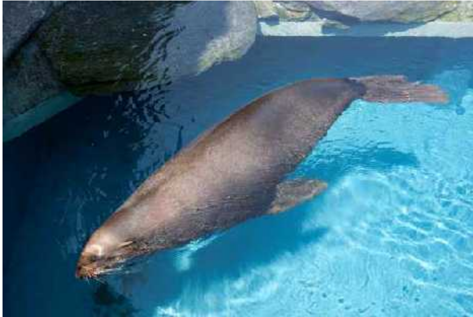
Slika 4. Slika tuljana koji pliva na površini

u Phocida tu funkciju imaju stražnji udovi, što se odražava i u razlici gra e kostura (Feldhamer 1999).