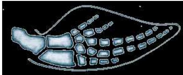
Slika 3. Kosti prednjeg uda kita

Prednji udovi kitova su preoblikovani u pokretne peraje. Nadlakti, palčana i lakatna kost su skraćene dok su prsti izduženi zbog dodatnih falangi (Slika 3).