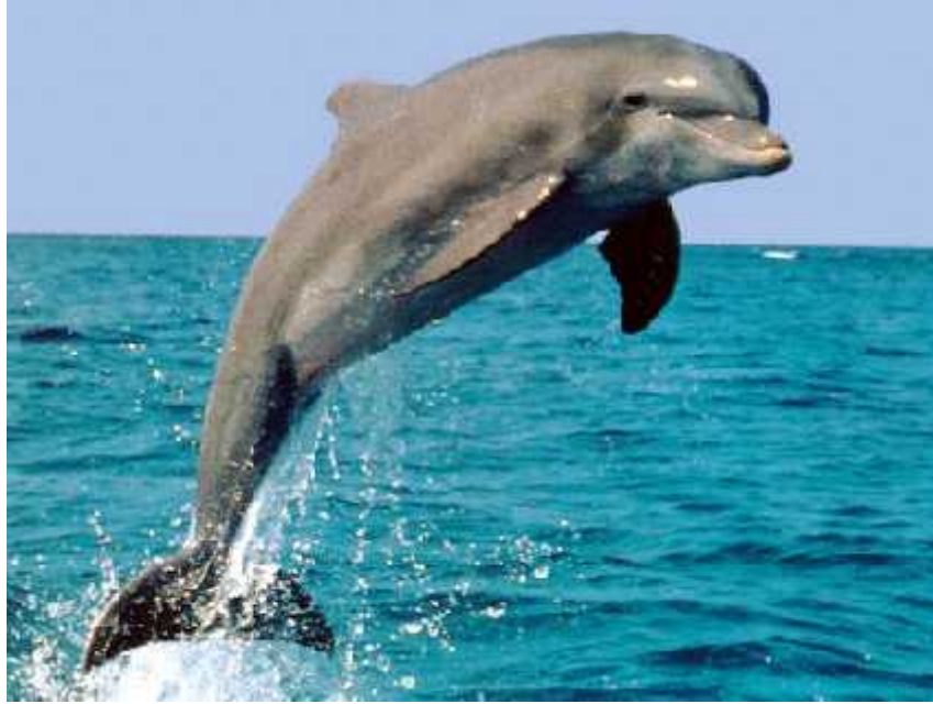
Slika 1. Izgled dupina

Jedna od prednosti života u vodi je to što morski sisavci mogu biti znatno ve i od kopnenih a da pritom ostanu vrlo pokretni. Razlog tome je velika gustoća vode koja podupire tijelo koje ima manju gustoću ili odgovarajuć oblik. Iako je više od polovice vrsta kitova manje veličine, u usporedbi sa prosječnim kopnenim sisavcima su veći. Ne postoji kopneni sisavac veličine plavetnog kita jer bi potporni sustav te životinje bio toliko težak da bi ona bila nepokretna (Feldhammer 1999.)