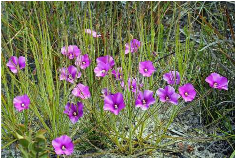
Slika 7. Vrsta Byblis gigantea

Byblis (sl. 7.) lovi iznenađujuće mnogo kukaca i ponekad je potpuno prekriven njima. Ima ih čak i na licu lista koje je oskudno ljepljivim kapljicama služi, jer se one produže sa strane s nali je lista. Kada se zalijepe, ako nisu dovoljno snažni za bijeg, uginu ili zbog iscrpljenosti ili uslijed nedostatka kisika. Tek 2005. dokazano je da biljka uz pomoć probavnih enzima probavlja plijen. Prije toga mislilo se da je to samo oblik simbioze s kukcima roda Setocoris koji se također hrane kukcima koje uhvati biljka.