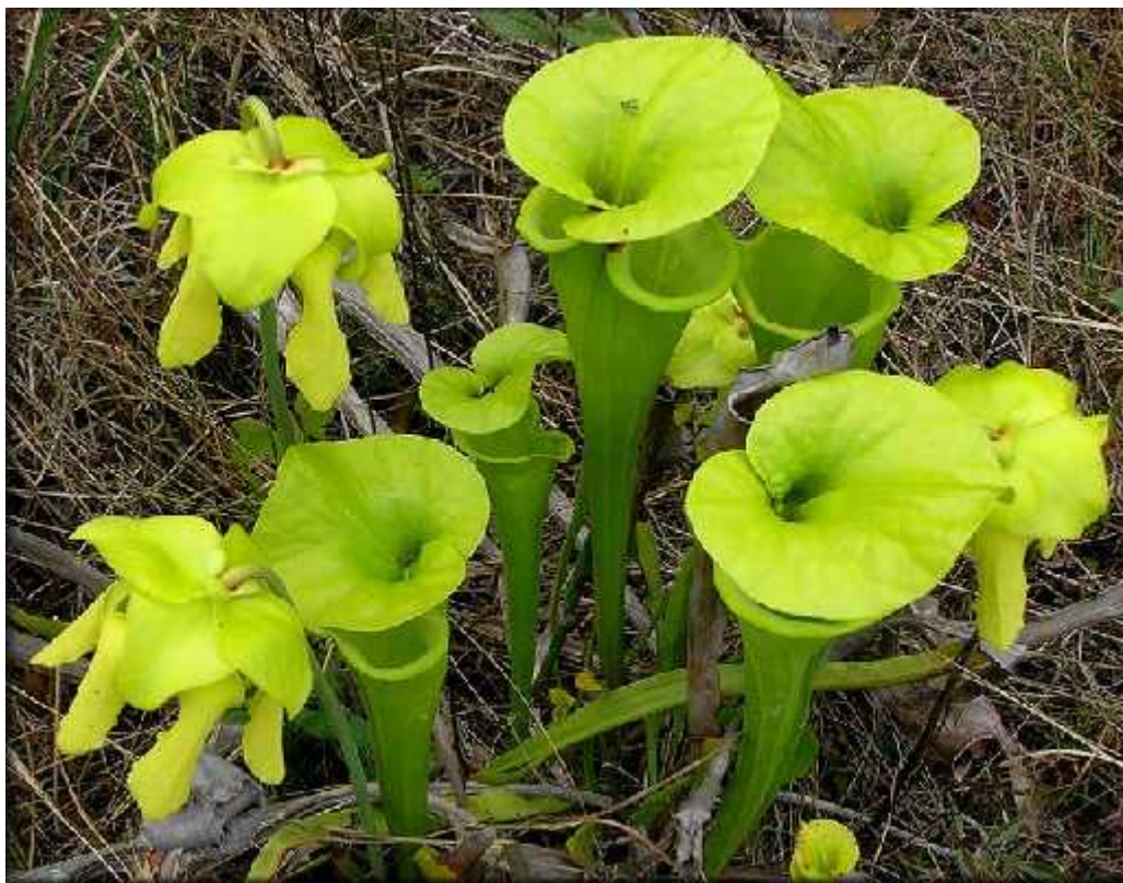
Slika 2. Vrsta Sarracenia flava

( http://vizi-husevonoveny.hu/Nagykepek/sarracenia_flava.jpg )