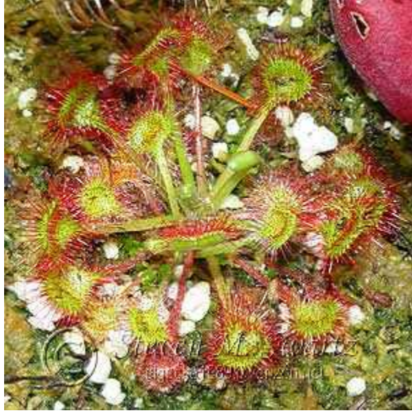
Slika 10. Vrsta Drosera rotundifolia

( http://mysite.verizon.net/elgecko1989/Drotundifolia.jpg )