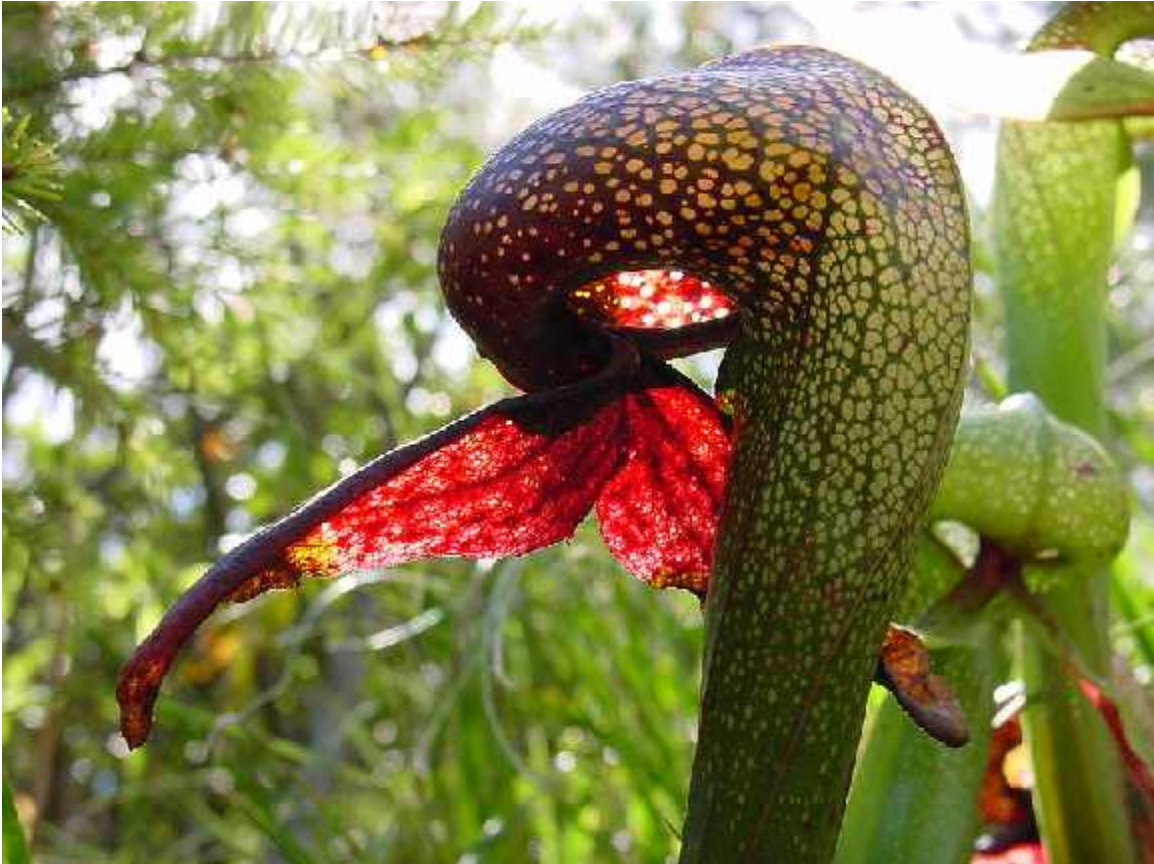
Slika 3. Vrsta Darlingtonia californica

njen volumen poveća kada se poveća broj kukaca u sastavu vrata. Količinu vode kontrolira otpuštanje, ili upijanje preko sustava korijenja.