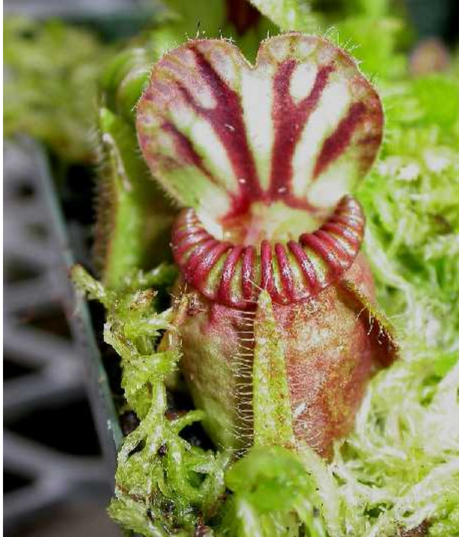
Slika 5. Vrsta Cephalotus follicularis

( http://www.plantsystematics.org/users/dws/2_22_06/Cephalotus/Cephalotus_follicularis_12.JPG )