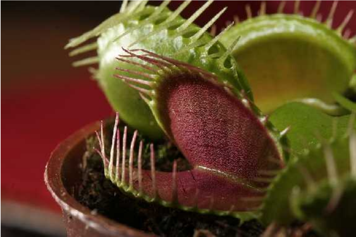
Slika 10. Vrsta Dionaea muscipula

tentakula rosike. Vanjska površina krila brzo raste uslijed toga što vanjski dijelovi režnjeva nakupljaju vodu i pove avaju se, dok unutrašnji ne, i to tjera krila unutra, dok kod otvaranja unutarnja površina raste a vanjska ne. Dakle u otvorenom stadiju krila klopke su konveksna a u zatvorenom su konkavna, tvore i šupljinu.