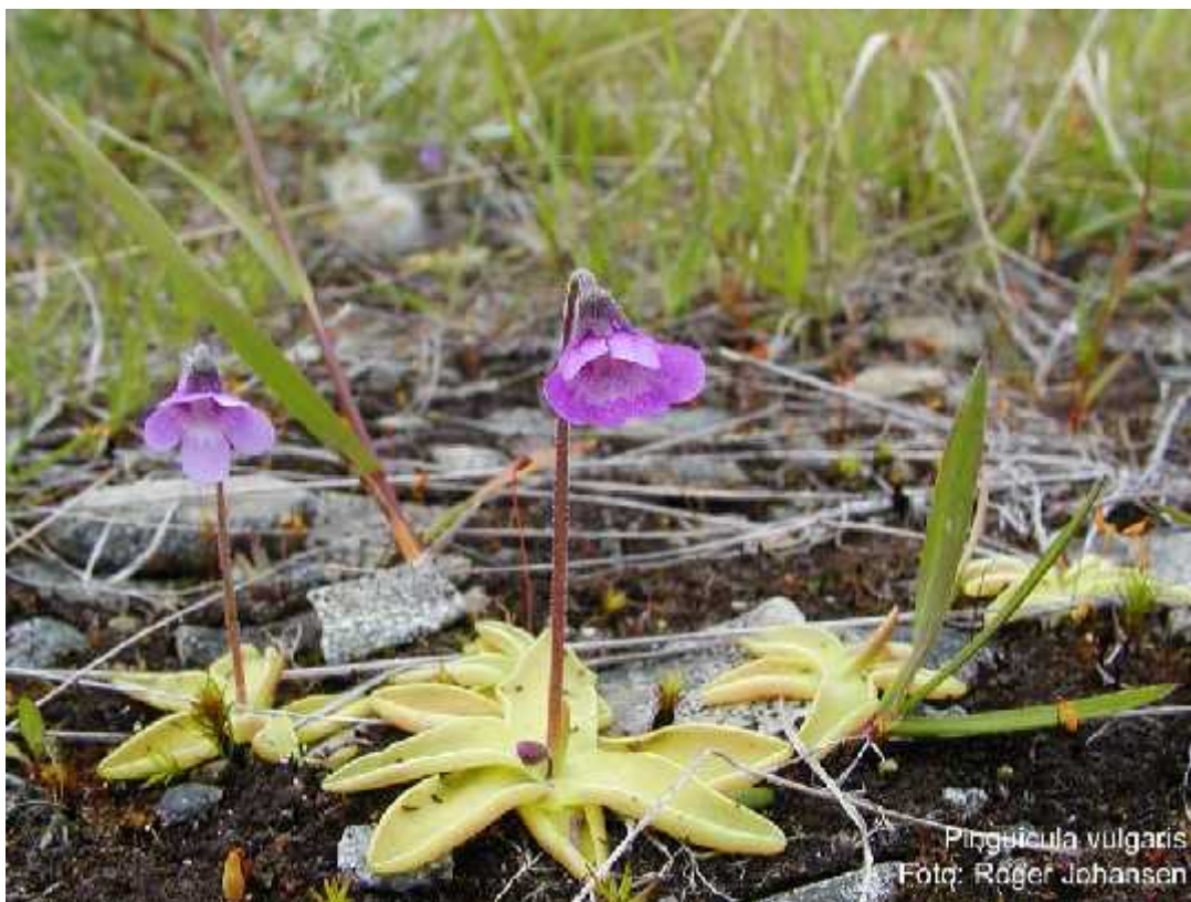
Slika 9. Vrsta Pinguicula vulgaris

( http://www.nhm.uio.no/botanisk/nbf/plantefoto/pinguicula_vulgaris_Roger_Johansen01.jpg )