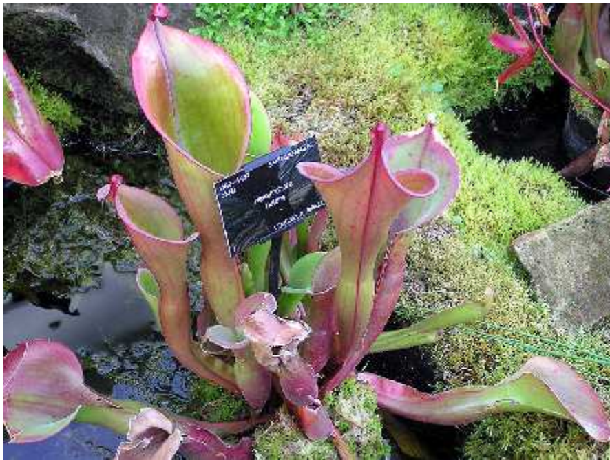
Slika 1. Vrsta Heliamphora nutans

rapore ene žlijezde koje lu e nektar privla an kukcima, ali je druga zona prekrivena i slojem dlaka usmjerenih prema dolje. One pružaju nesigurno uporište potencijalnim žrtvama koje e se, u pokušaju da do u do nektara iz žlijezda ispod, vjerojatno poskliznuti i pasti u vr pun vode. Tre a zona je glatka i jako ugla ana s malom šansom uporišta. etvrta, i posljednja, zona naoružana je kratkim, oštrim i prema dolje usmjerenim dlakama ija je jedina uloga zadržati uhva eni plijen. Vr uop e nema probavnih žlijezda i biljka se u potpunosti oslanja na bakterije koje razgra uju plijen. Tako oslobo ene hranjive tvari rastope se u vodi pa vr apsorpira otopinu.