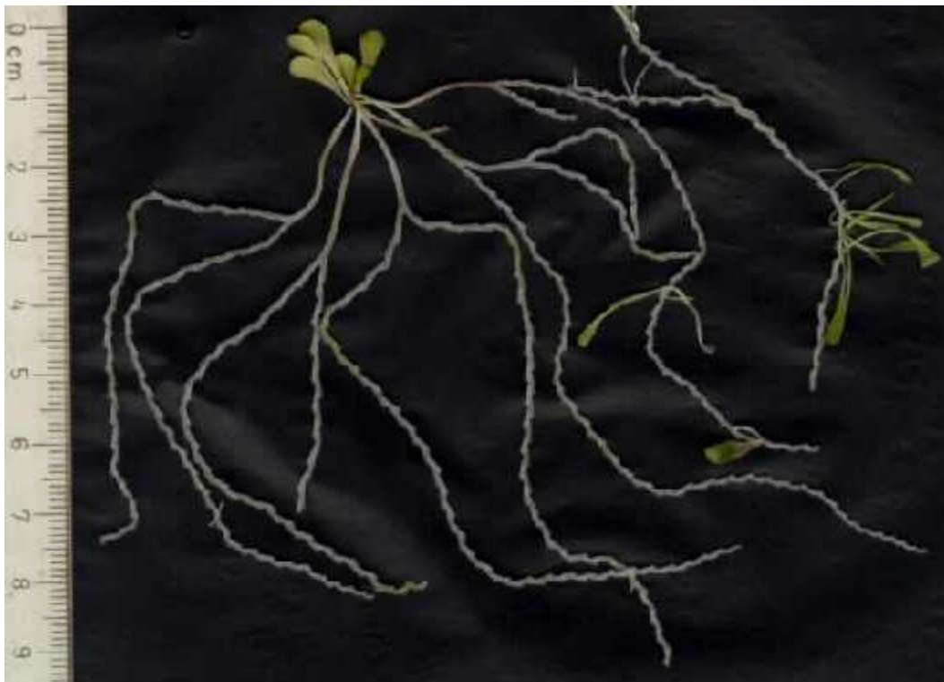
Slika 6. Vrsta Genlisea violacea

( http://www.bestcarnivorousplants.com/CP_Photos/Genlisea_violacea_giant_Copyright_L_Adamec_CzEPS.jpg )