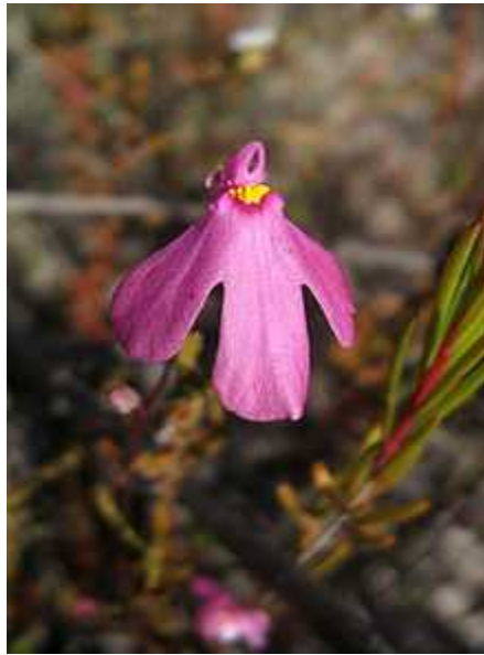
Slika 14. Vrsta Polypompholyx multifida

poput lijevka. Svaki lijevak je podijeljen ešljem oštih dlaka na dršku i vodi sa strane prema posebnom prostoru koji je odvojen od susjednog prvenstveno rubom na dršku blisko priljubljenim s donje strane kljuna, popraćeno još jednim ešljem krutih dlaka. Vršni dio tog prostora ine kljun i prema unutra nagnuta vrata. Donje površine prostora i njihovi vršni dijelovi prekriveni su oštrim dlakama usmjerenim prema unutra, tjeraju i životinje prema mjehuru.