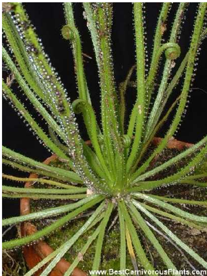
Slika 8. Vrsta Drosophyllum lusitanicum

( http://bestcarnivorousplants.com/CP_Photos/drosophyllum_lusitanicum_Copyright_J_Flisek_01.jpg )