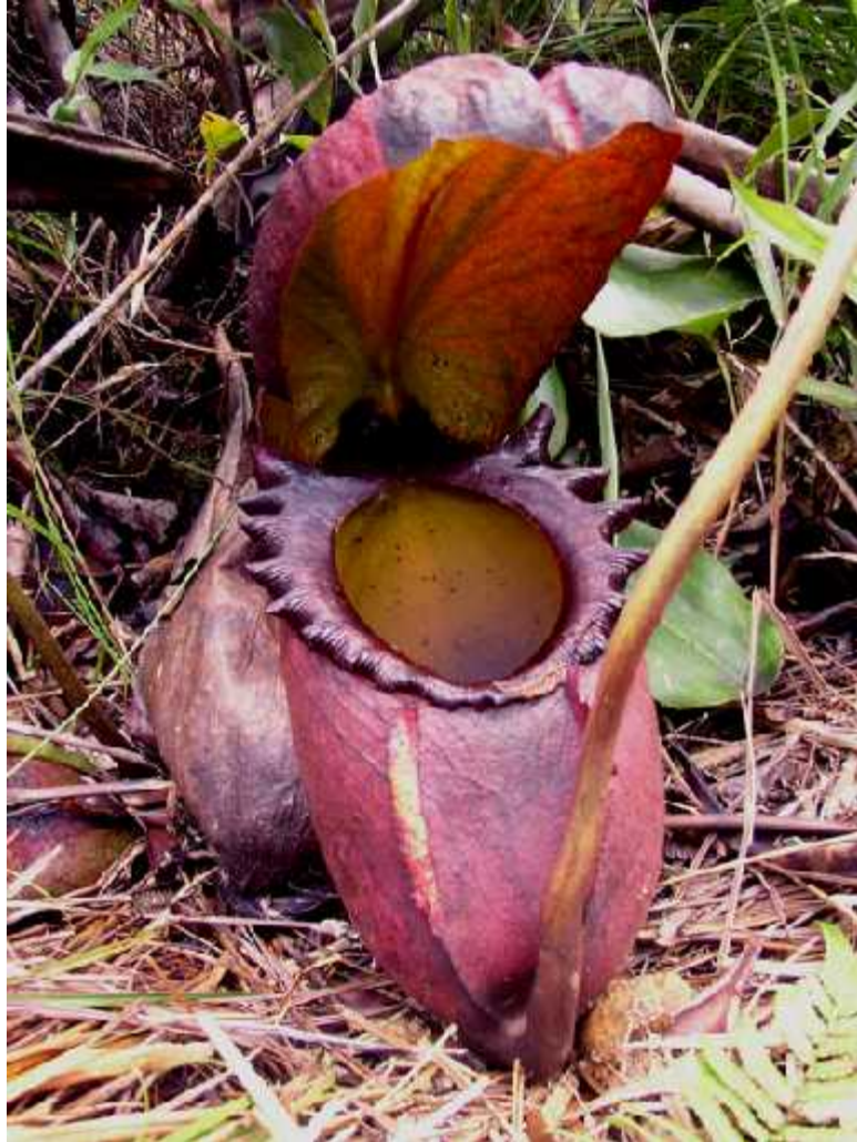
Slika 4. Vrsta Nepenthes rajah