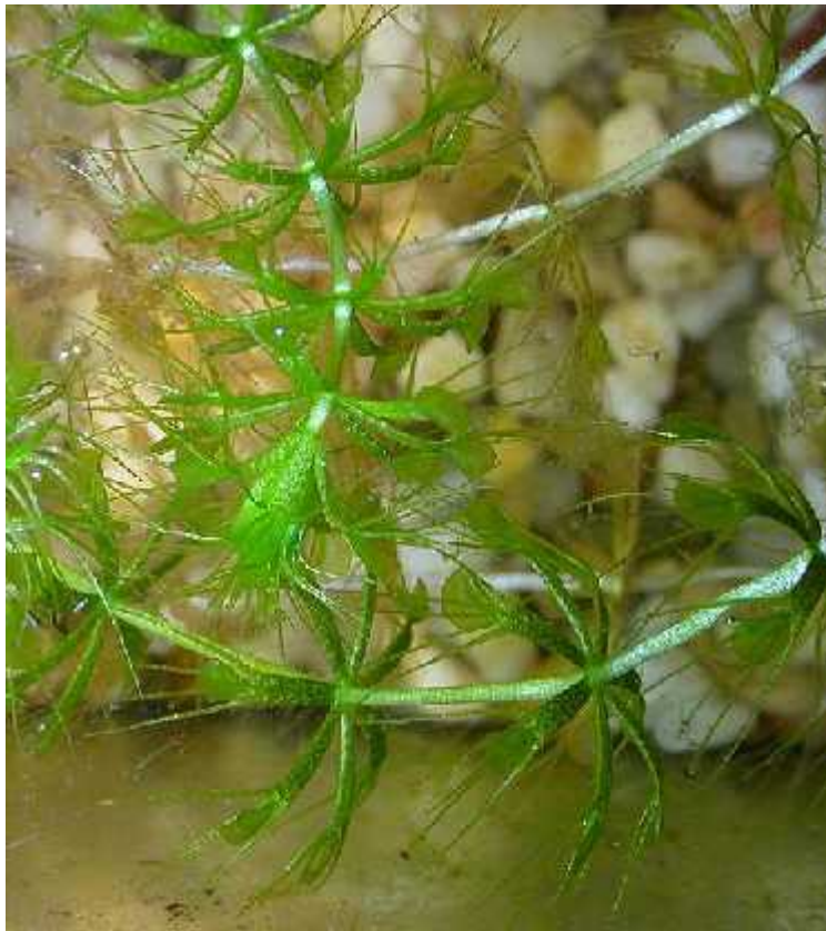
Slika 12. Vrsta Aldrovanda vesiculosa

Kao i kod venerine muholovke, do danas nije razjašnjen mehanizam osjetnih ekinja, što krila drži razdvojenima i metoda njihova brzog otpuštanja. Ipak, proces spajanja prou avao je Jogi Ashida 1930-ih. To je tzv. fenomen rasta - kako se približavaju, debele zone uzrokuju spajanje i tankih zona, a pri otvaranju je suprotno.