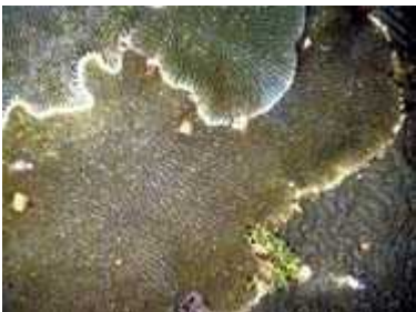
Slika 6. Koralji razgraju tkivo susjednih koralja kako bi se proširili

Prema kolonijalnim ožiljaka koji su nastali djelovanjem lovki na susjedne polipe može se zaključiti da Pocillopora dominantnija od Pavone .