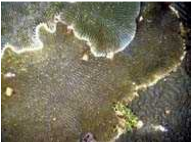
Slika 6. Koralji razgrajuju tkivo susjednih koralja kako bi se proširili

Prema kolonijalnim ožiljaka koji su nastali djelovanjem lovki na susjedne polipe može se zaključiti da Pocillopora dominantnija od Pavone .