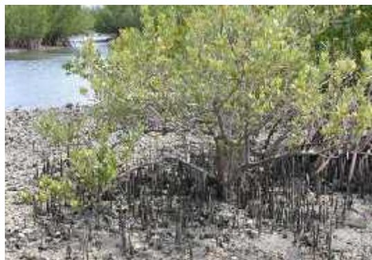
Slika 4. Avicennia germanis

U unutrašnjosti zajednice nalaze se crne mangrove kod kojih se pneumatofori uzdižu iz tla i okružuju deblo. Ovakve prilagodbe korijenskog sustava omogućuju dopremanje kisika korijenju u tlu koje se često nalazi u anaerobnom sedimentu.