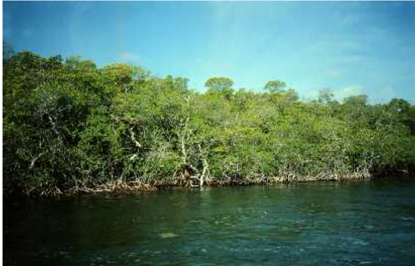
Slika 1. Mangrova šuma na Floridi ( Crane Key, 2005.)