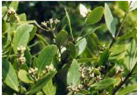
Slika 5. Laguncularia racemosa

Bijelim mangrovama naj eš e nedostaju specijalne korijenske prilagodbe te se one nalaze u samom središtu mangrovih šuma.