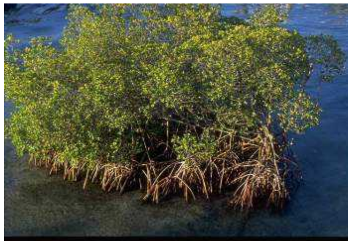
Slika 3. Rhizophora mangle

Crvene mangrove možemo pronaći na rubu zajednice gdje su potpuno izložene utjecajima plime i oseke kao i vjetru. Razvile su adaptacije na navedene uvjete kao što su vrsto korijenje koje se proteže do debla i granja. Ovako zamršeni korijenski sustav povećava stabilnost te također zadržava sediment i sprječava njegovo odnošenje vodom.