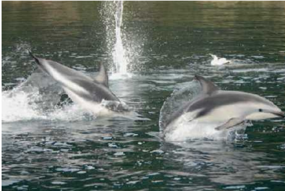
Slika 2. Crni dupin ( Lagenorhynchus obscurus )

obale. Čak se skrivaju u plimnim lagunama pa se tako ponekad znaju nasukati do sljedeće plime. Plavetni kitovi također imaju strategije izbjegavanja. Sivi kitovi ( Eschrichtius robustus ) znaju bježati u plitke vode kada uđu kitove ubojice. Također neke vrste koriste zone valova ili polja kelpa za skrivanje od predatora, jer takva mjesta apsorbiraju i reflektiraju zvuk što otežava lov pomoću eholokacije.