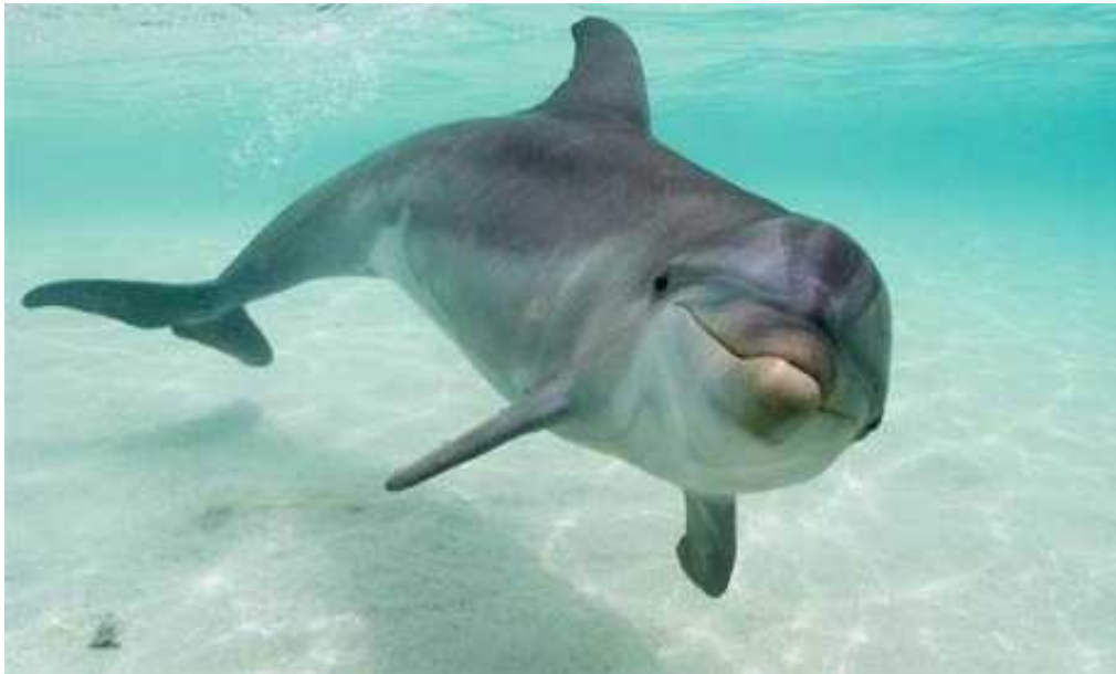
Slika 9. Dobri dupin ( Tursiops truncatus )

relativno niske razine agonizma isprekidani periodima visokih razina agonizma kada jedan mužjak izaziva drugog.