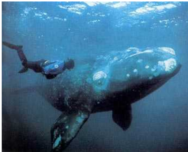
Slika 5. Grenlandski glatki kit ( Balaena mysticetus )

Za razliku od perajara, kitovi su jako mobilni pa ne upoterbljavaju strategije uvanja grupe ženki. Ve ini kitova je potrebno manje vremena za plivanje izme u grupa nego što je trajanje estrusa u ženki, pa preferiraju strategiju lutanja. Postoje neki dokazi koji upu uju na obranu ženki u bottlenose dupina. U terenskim istraživanjima indopacifi kog obi nog dupina ( T. aduncus ) u indijskom oceanu u Shark Bay zapadnoj Australiji i obi nog dobrog dupina ( T. truncatus ) u Sarasoti na Floridi, grupe od dva do tri mužjaka dobrog dupina mogu se združiti sa ženkom (Connor i sur. , 2000). Koalicija mužjaka može pokrenuti takvo združivanje tako da love ili odvla e ženke dalje od grupe u kojoj su je inicijalno pronašli. Neke ovakve zadruge izgledaju kao pokušaji mužjaka da limitiraju izbor ženki pri parenju, koje mogu probati pobje i od mužjaka. Mužjaci u ovakvim savezima osnivaju zadruge s nekoliko razli itih ženki tijekom sezone parenja.