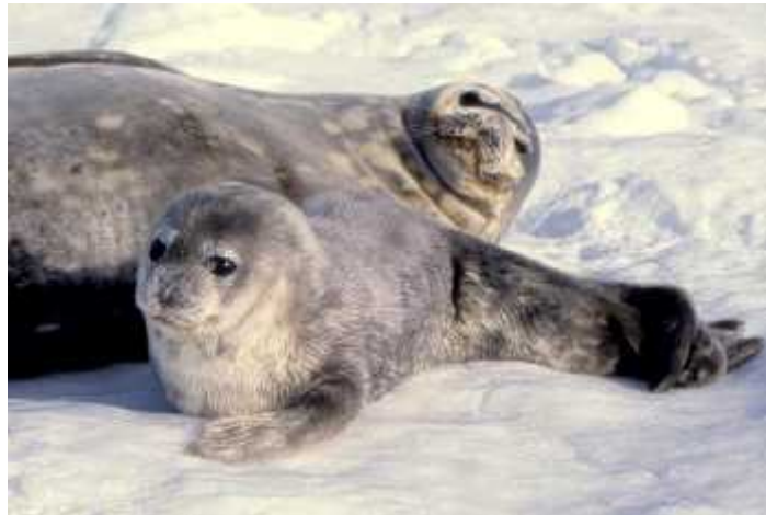
Slika 14. Wedelov tuljan ( Leptonychotes weddellii )

Majke i mladunci svih perajara izmjenjuju vokalizacije koje su važne za prepoznavanje mladunca i ponovno spajanje majke i mladunca nakon što se majka vrati s hranjenja. Prepoznavanje mladunca je posebno važno u nekih ušatih tuljana jer majke znaju oti i na hranjenje u more i po 7 dana prije nego se vrate nahraniti mladunca. Vokalni repertoar majke i mladunca je jedinstven u većine perajara i različit od njihovih zvukova tijekom drugih društvenih aktivnosti i ostalih podvodnih zvukova. Ovakav repertoar se najčešće pojavljuje dok su nasukani, ali ga majke znaju upotrebljavati i dok nagovaraju svoje mladunce u vodu ili na kopno.