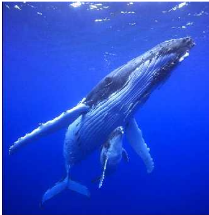
Slika 8. Grbavi kit ( Megaptera novaeangliae )

Za razliku od kopnenih životinja, kitovi koji žive u otvorenim oceanima brane sam resurs, a ne područje jer su resursi jako pokretni u morima. Naprimjer, mužjak grbavog kita ne može braniti specifično područje tijekom sezone parenja, nego može pratiti ženke i boriti se s ostalim mužjacima kako bi ograničio ili pristup ženki. Ovakav uzorak ponašanja kada mužjaci brane teritorij ili grupu ženki doveo je do brojnih morfoloških promjena i promjena u ponašanju. Zato su mužjaci često veći od ženki. Npr., odrasli mužjak ulješure može biti tri puta teži od ženke (Connor i sur. , 1998), a mužjak slonovskog tuljana i do 10 puta teži od ženke (McCann i sur. , 1989). Neka ponašanja služe kako bi povećala prividnu veličinu mužjaka te kao vizualni prikaz. Npr. grbavi kit (sl. 8) koji kompetitivno za ženku može nasrnuti otvorenim morovima i tako s vodom proširiti naborano područje ispod donje eljusti. Ovakvo ponašanje može imati ulogu povećanja prividne veličine kompetitora.