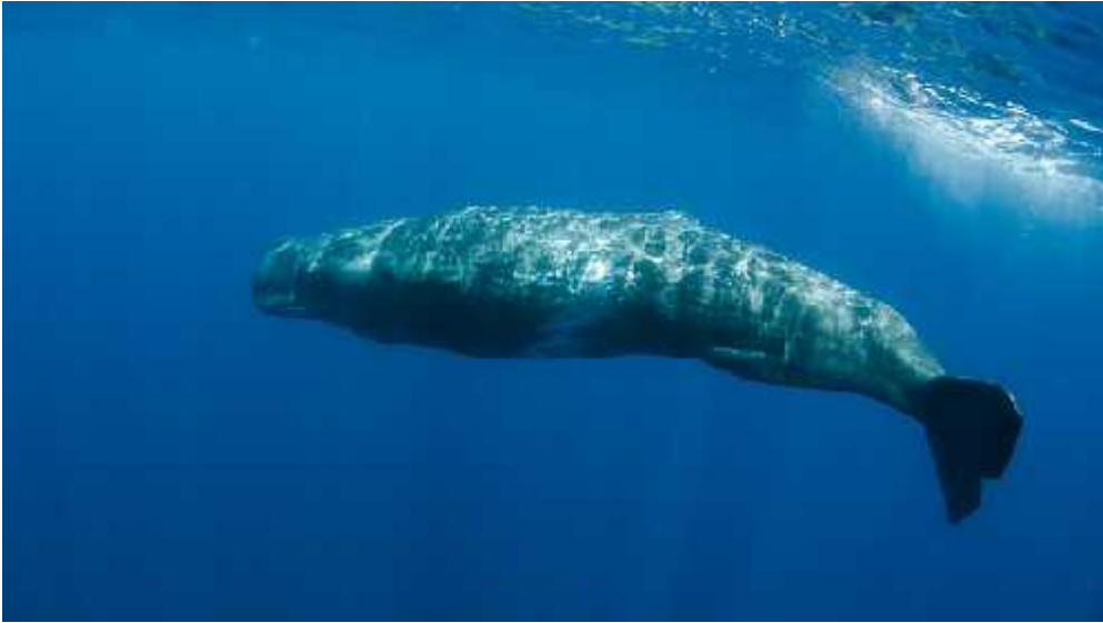
Slika 10. Kit ulješura ( Physeter macrocephalus )

roda Tursiops proizvodi individualne zvižduke koji se zovu potpisni zvižduci i vjerojatno se upotrebljavaju za individualno prepoznavanje (Watwood i sur. , 2004).