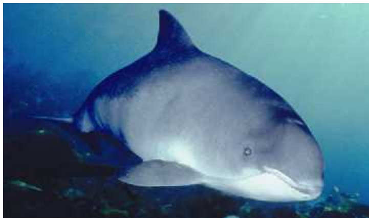
Slika 11. Perajasta pliskavica ( Phocoena phocoena )

Plavetni kitovi se mogu hraniti u grupama poput ulješura, ali ženke plavetnog kita se razlikuju od ženki ulješure u ve oj brizi za mladunce. Plavetni kitovi svih veli ina i spolova su esto vi eni u grupama razli itih veli ina na mjestima hranjenja. Kod grbavih kitova veli ina grupa za vrijeme hranjenja ovisi o horizontalnoj veli ini jata plijena, ali tijekom sezone parenja, dok je ženka s mladuncem, jako rijetko je vi ena da se druži s odraslom ženkom.