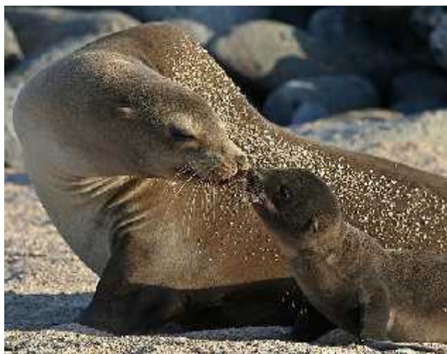
Slika 6. Tropski morski lavovi sa Galapagosa ( Zalophus wollebaeki )

Roditeljska briga započinje s majkom koja doji mladunce. Majinska uloga je bitna za sve sisavce i utječe na mnoge aspekte socijalnog ponašanja. Postoji velika razlika u roditeljskoj brizi između različitih vrsta. Pravi tuljani rade mlade na nestabilnim komadima plutajućeg leda gdje ne mogu garantirati sigurno utočište za mlade. Tuljani mjehurasi ( Cystophora cristata ) su se prilagodili ovoj situaciji tako što intenzivno luku mlijeko tijekom perioda od četiri dana, tako da mladunac u tom periodu udvostruči svoju težinu. Ženke pravih tuljana ostaju uz svoje mladunce i poste dok ih doje za razliku od ženki ušatih tuljana koje napuštaju svoje mladunce kako bi se hranile i zatim se vraćaju do njih. Ovakvi uzorci ponašanja doveli su do velikih razlika u dužini laktacije kod perajara. Tako kod ženki pravog tuljana period traje od četiri dana do dva mjeseca dok kod ušatih tuljana traje od četiri mjeseca do dvije godine. Većina perajara ima godišnje sezone parenja tako da je najduži period laktacije limitiran na oko 12 mjeseci. Iznimka su tropski morski lavovi s Galapagosa ( Zalophus wollebaeki ) (sl. 6) koji mogu ponekad doći do mlade puno više od 12 mjeseci i imati mlade u intervalima većim od godine dana.