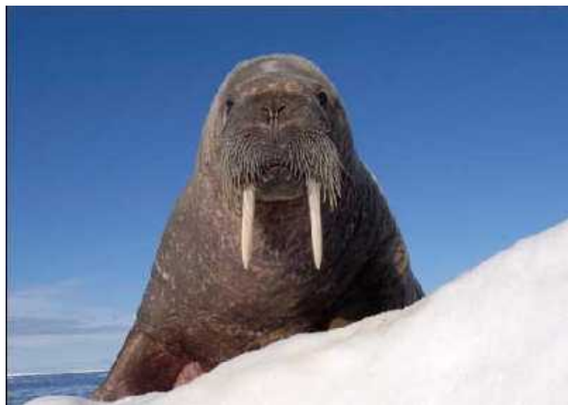
Slika 1. Morž ( Odobenus rosmarus )

Perajari su ronjoci i ve inu vremena provode na kopnu, a u vodu ulaze samo radi hranjenja. Za razliku od kitova koji koriste ehlokaciju, perajari imaju razli ite prilagodbe vida i osjeta u brkovima kako bi pronašli plijen. U obalnim podru jima tuljani vide ribu i na 10 m udaljenosti. Tuljani koji rone jako duboko poput slonovskog tuljana ( Mirounga spp.) imaju o i posebno prilago ene za valne duljine i niske razine svjetla u dubini mora. Morževi ( Odobenus rosmarus ) (sl. 1) imaju brkove koji su izuzetno osjetljivi na dodir, pa morževi koriste vibrise u njihovim brkovima kako bi otkrili plijen u sedimentu. Za razliku od kitova, perajari ne love koordinirano u grupama, ali zamje eno je zajedni ko grupno ronjenje. Rone tijekom cijelog dana, ali najviše no u. Dubina na kojoj rone mijenja se ovisno o dobu dana što pokazuje da perajari prate dnevne migracije riba. Iako ve ina perajara jede ribe, nekoliko vrsta morskih lavova jede mlade drugih tuljana, jedna vrsta pokazuje kanibalizam, a nekoliko jede pingvine i ostale ptice.