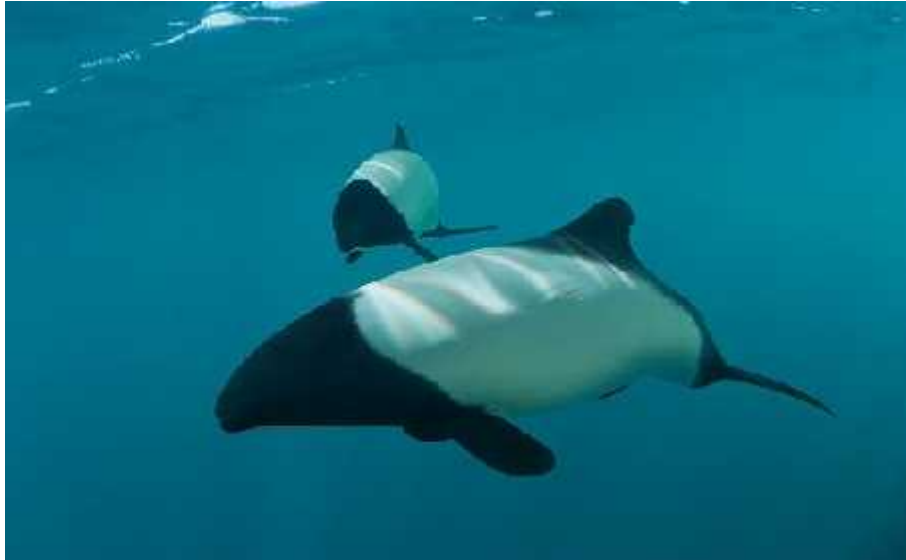
Slika 13. Comersonov dupin ( Cephalorhynchus commersonii )

nemaju nikakvu drugu funkciju osim u komunikaciji. Budu i da postoje mnoge vrste koje ne zvižde, poput perajaste pliskavice ( Phocoena phocoena ) i Comersonovog dupina ( Cephalorhynchus commersonii ) (sl. 13), prerano je smatrati zvižduke kao glavne na ine komunikacije zvukom u kitova zubana.