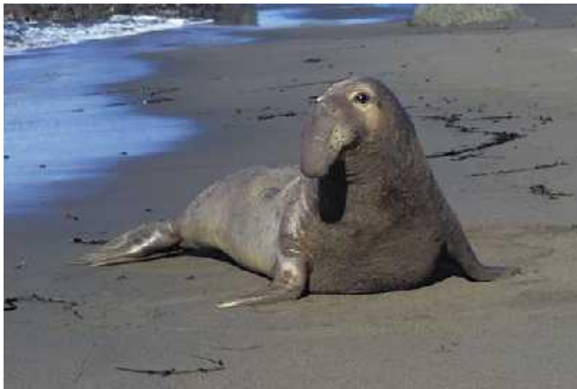
Slika 12. Sjeverni morski slon ( M. angustirostris )

Neki perajari isto imaju migracije od tisuć kilometara. Tako npr. sjeverni slonovski tuljani ( M. angustirostris ) (sl. 12) koji se razmnožavaju i kote blizu San Francisco-a mogu migrirati do Aleutskih otoka kako bi se hranili. Nakon sezone razmnožavanja, i mužjaci i ženke plivaju sjeverno uz kalifornijsku struju. Neki mužjaci slonovskog tuljana hrane se uz oceanske fronte na granici aljaskanske struje.