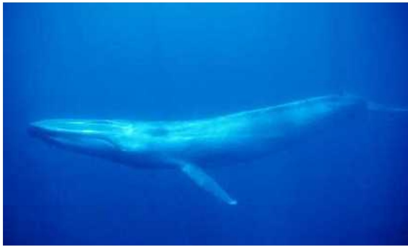
Slika 7. Plavi kit ( Balaenoptera musculus )

Pliskavice (Phocoenidae) i neki plavetni kitovi imaju isključivo godišnje cikluse parenja. Neki plavetni kitovi, poput plavog kita ( Balaenoptera musculus ) (sl. 7) odbijaju mlade od sise nakon otprilike 7 mjeseci kako bi mladi pošli jesti krutu hranu tijekom ljetne sezone hranjenja. Sve pliskavice i plavetni kitovi odbijaju mlade od sise unutar godine dana. Za razliku od pliskavica, kitovi zubani idu u drugu krajnost i imaju produžene periode roditeljske brige iako su mladi samostalni. Dupini roda Tursiops su dugački samo tri metra i esto doje mladunce 3-5 godina što je nevjerojatno dugo u usporedbi s 30 metarskim plavim kitom koji doji mladunce samo 7 mjeseci.