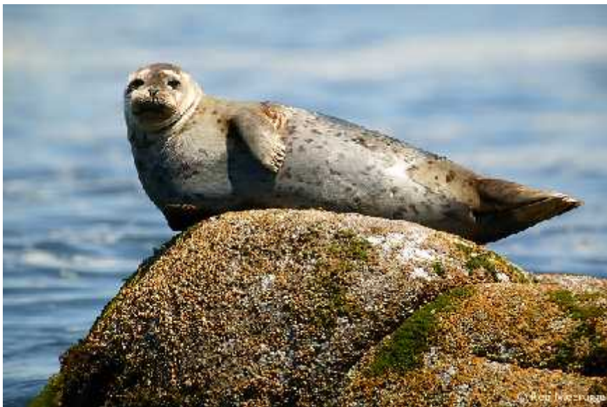
Slika 4. Obični tuljan ( Phoca vitulina )

Mušjaci sjevernog slonovskog tuljana dolaze na mjesta parenja prije ženki i natječu se za dominantan status i poziciju na plaži za parenje. Dominantni mužjak može štiti grupu ženki i spriječiti dostupnost ostalim mužjacima. Ako alfa mužjak može održati svoj status, može spriječiti dostupnost grupe ženki cijelu sezonu parenja.