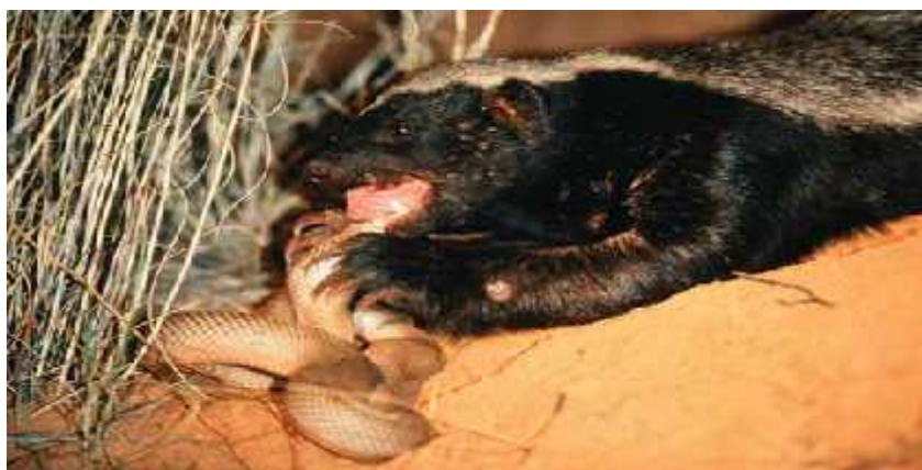
Slika 3. Medojedni jazavac jede zmiju

Kada su mali sisavci manje brojni medojedni jazavci ih rjeđe jedu i prebacuju se na manje profitabilan plijen poput malih gmazova i škorpiona (Begg i sur. 2003). Medojedni jazavci oduzet će plijen drugom predatoru ako im se pruži prilika, a u razdobljima veće gladi neće prežeti ni od strvina.