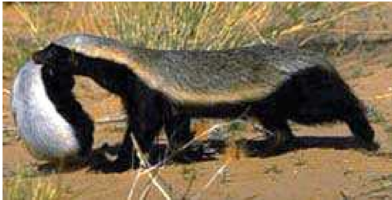
Slika 2. Majka prenosi mladunca

U prosjeku i mužjaci i ženke provode pola dana odmarajući u jazbini ili grmlju, i imaju dva perioda aktivnosti, ujutro i navečer. U vrućoj sezoni aktivnost je pojačano noćna, a u hladnoj sezoni pretežitodiurnalna. Temperatura je odlučujući faktor koji određuje periode aktivnosti, te jazavci na ekstremne temperature reagiraju premještajući se u jazbinu. Pri visokim temperaturama često znaju primjenjivati kupke od pijeska, bacajući hladan pijesak na tijelo kako bi se ohladili (Begg, 2001). Primijeno je da mužjaci koriste rupe koje su prethodno iskopale druge životinje, dok ženke najčešće kopaju svoje vlastite rupe (Begg, 2001).