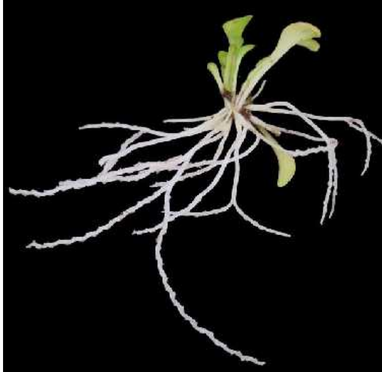
Slika 13. Vrsta Genlisea violacea L.

onemogu avaju bijeg plijena i prisiljavaju ga da se kre e prema centru cjev ice i prema vrhu slova „v“ gdje po inje razgradnja. (Müller, 2004).