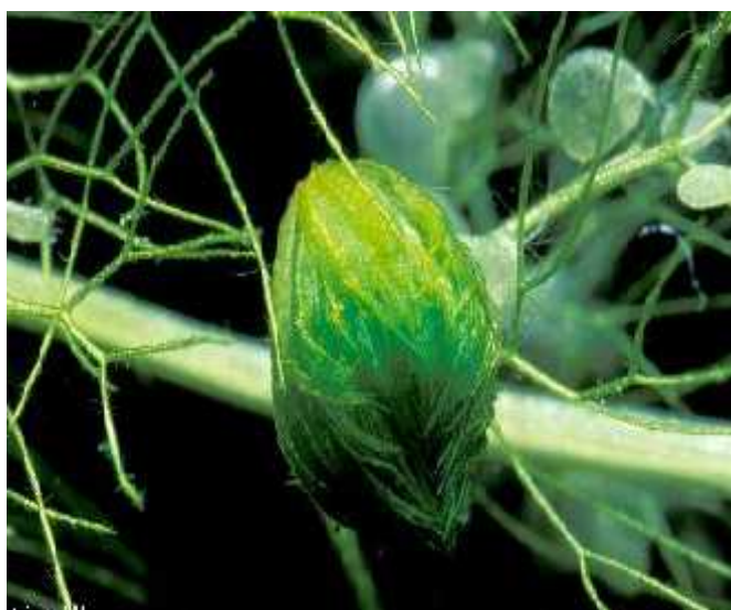
Slika 6. Mjehurasta vodena stupica ( Aldrovanda vesiculosa L.)

U ovaj rod ubrajamo biljke koje se kod nas zovu vodene stupice. To su mo varne biljke bez korijena. Hrane se malim vodenim beskralježnjacima koriste i se zamkom sli noj onoj venerine muholovke. Zamke su spiralno raspore ene oko slobodno plutaju e središnje cijevi. (Slika 6.) Budu i da se zamka kod optimalne temperature 20°C se zatvori za 0.01-0.02 sekunde, vodene stupice svrstavaju se me u “najbrže” vrste biljnog carstva. ( www.eko-pan.hr )