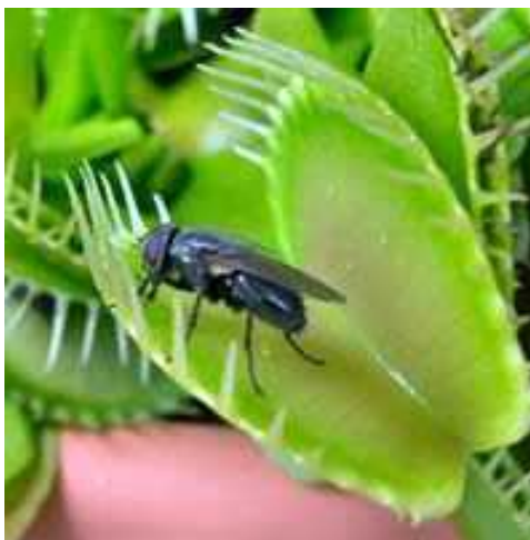
Slika 3. Kukac u klopki venerine muholovke