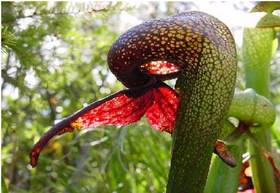
Slika 7. Vrsta Darlingtonia californica L.

Ovaj rod ini samo jedna vrsta Darlingtonia californica L. a nalazimo je na sjeveru Kalifornije i u Oregonu u podru ju mo vara. Vrsta je vrlo rijetka. Zovu je i biljka kobra jer su njeni cjevasti listovi nalik na kobru a završavaju sa rascjepanim dijelom žuto ljubi asto zelene boje koji nalikuju otrovnim zubima kobre. Ova vrsta ima specifi nu zamku u odnosu na ostale rodove. Ona ne razvije uobi ajene vr eve pune otopine enzima a ne izlu uje ni slatki nektar ve postoji mali izlaz koji biljka uspješno skriva od plijena tako da ga uvija prema unutra i nudi niz lažnih prozirnih izlaza, gdje se plijen nakon nekoliko vremena traženja, umori i pada u zamku gdje po inje razgradnja pomo u enzima. (Slika 7.) ( Watson i Dallwitz 1992).