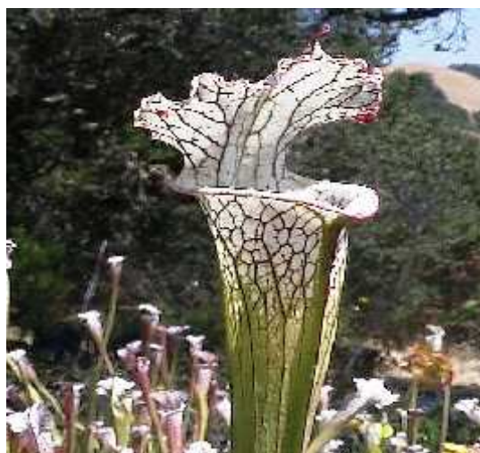
Slika 9. Rod Sarracenia - listovi u obliku vrčeva

Sarracenia leucophylla L. (Slika 10.) je najveća biljka iz roda Sarracenia . Njezini listovi su preobraženi u duge, uske tuljce duge do 1m. Raste na močvarnim područjima od Floride do Missurija. Listovi su zelene boje, osim vrha koji su bijeli te zeleno mrežasti. List može uloviti neograničeno mnogo kukaca jer umire od starosti. Cvjetovi su krupni, na dugim stapkama od oko 90 cm. Lapovi i latice kojih je obično 5 tamnocrvene su boje, a starenjem poprimaju zelenu boju. ( http://en.wikipedia.org/wiki/Sarracenia_leucophylla )