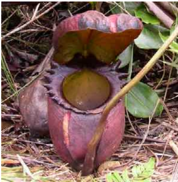
Slika 11. Vrste Nepenthes rajah L.