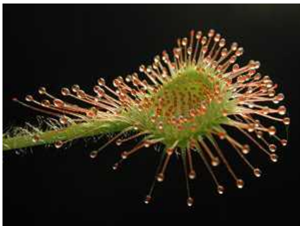
Slika 5. Okruglolisna rosika ( Drosera rotundifolia L.)