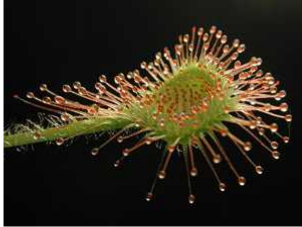
Slika 5. Okruglolisna rosika ( Drosera rotundifolia L.)