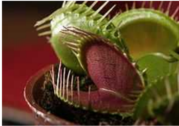
Slika 1. Dionaea muscipula L. - venerina muholovka

probaviti ulovljenu životinju i nakon toga se osuši jer djelovanje enzima ošte uje list. Iz podanka stalno rastu novi listovi. (Hodick i sur. 1989.)