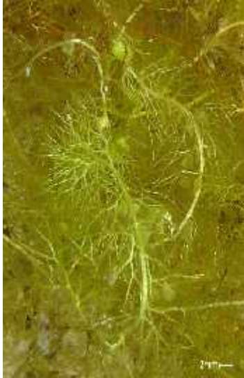
Slika 15. Mješinka ( Utricularia vulgaris L. )

odgovaraju u reakciju organa za hvatanje, nakon ega zamka obamire. ( www.eko-pan.hr/bioraznolikost_vrste_stanista.html )