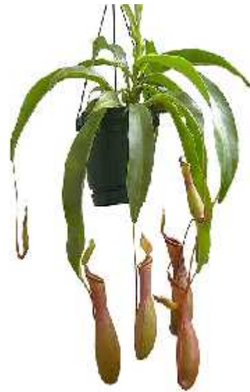
Slika 12. Vrsta Nepenthes alata L.