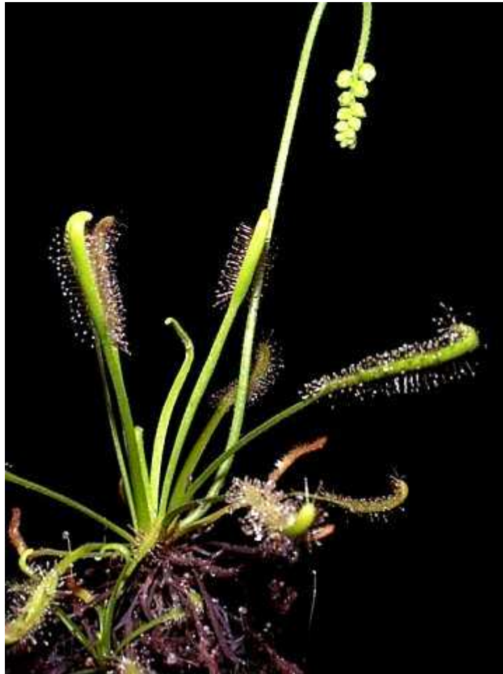
Slika 4. Habitus vrste Drosera capensis