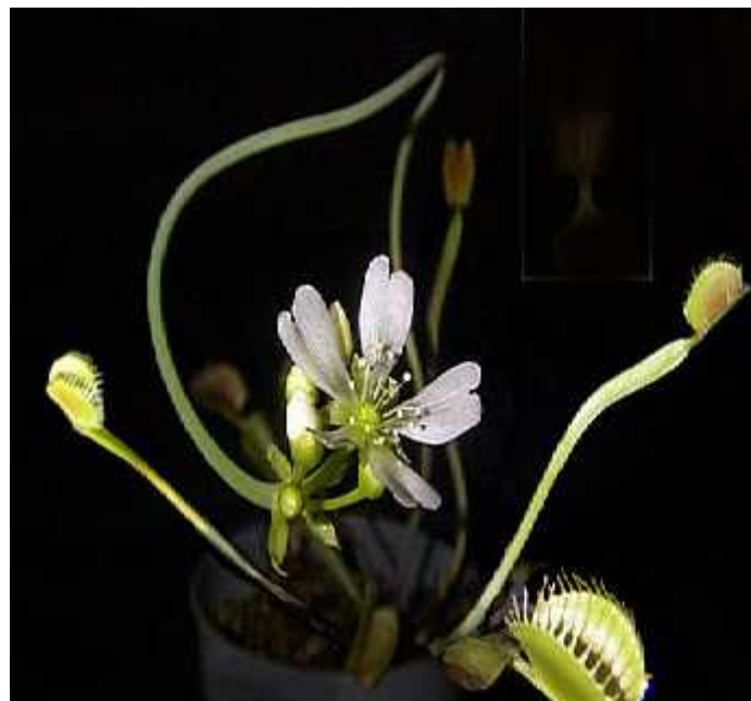
Slika 2. Habitus venerine muholovke