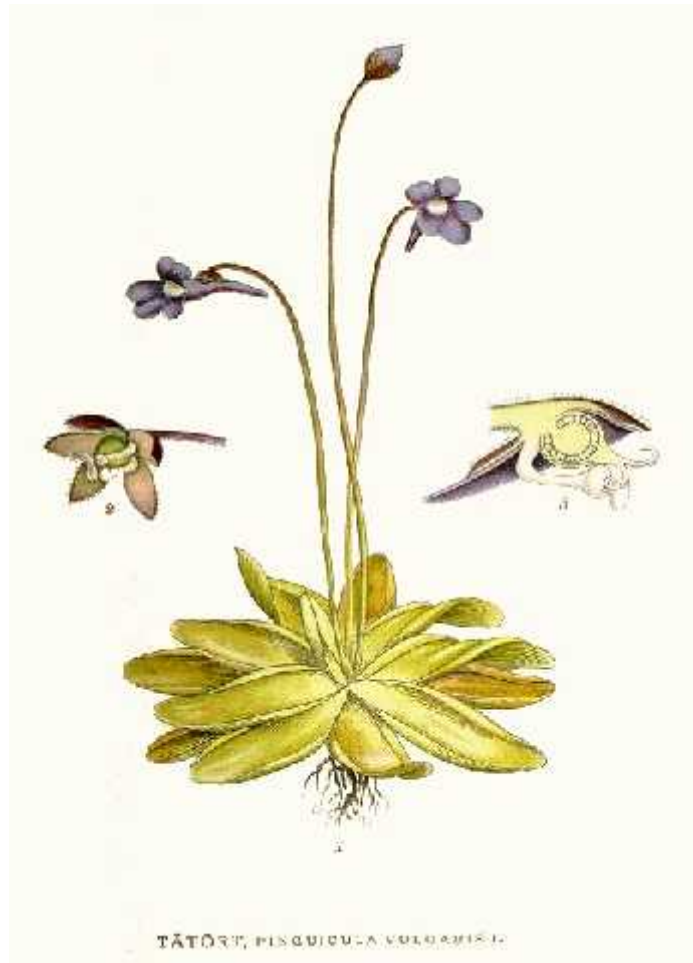
Slika 14. Pinguicula vulgaris L. – tustica kukcolovka