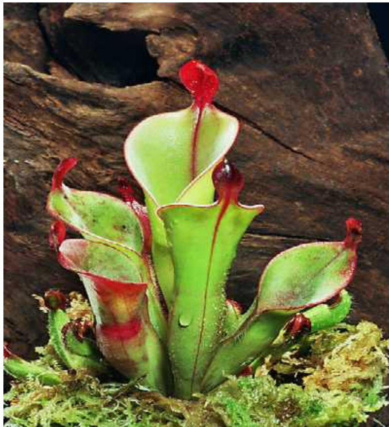
Slika 8. Vrsta Heliampora chimantensis L.

Ovaj rod ima 18 vrsta koje nastanjuju Južnu Ameriku. Razvijaju listove u obliku cijevi u kojima onda nakupljaju vodu koja ima ulogu zamke za mogu u žrtvu. (Slika 8.) Vrste ovog roda ne mogu same lučiti enzime za razgradnju plijena, uz iznimku vrste Heliampora tatei L., koje uz pomoć svojih simbiotskih bakterija koje luče enzime probavljaju plijen. (Mellichamp, 1979).