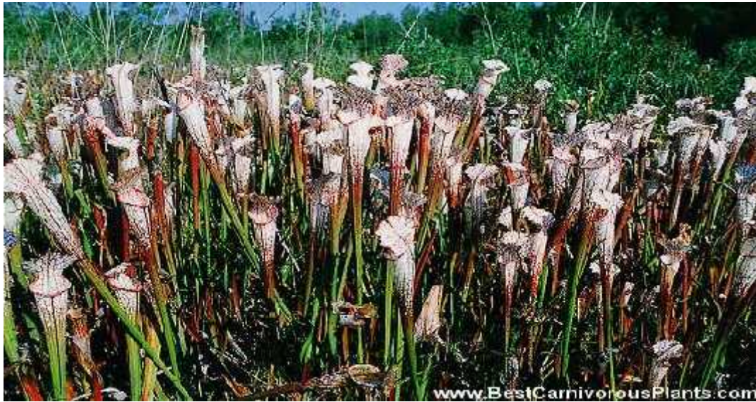
Slika 10. Vrsta Sarracenia leucophylla