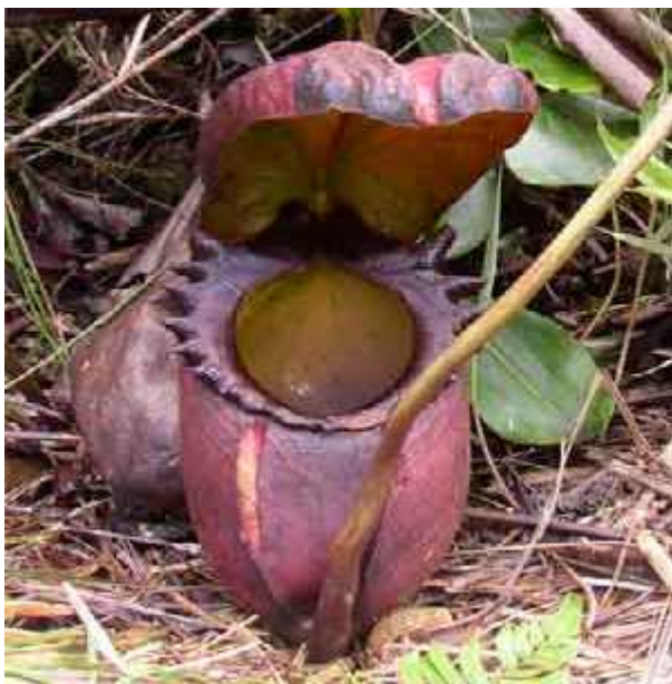
Slika 11. Vrste Nepenthes rajah L.