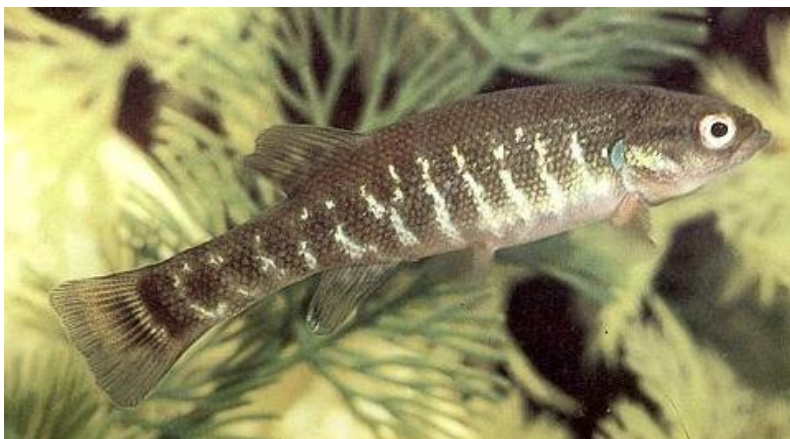
Slika 4 N. Hubbsi