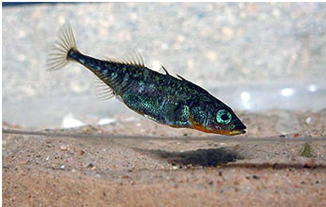
Slika 3 Normalno svadbenu ruho G. aculeatus

eksperiment preselili u prirodu gdje su pomoću velikih kaveza kontrolirali prisutnost tj. odsutnost crнке i adekvatno tome istraživali unutarvrčne teritorijalne interakcije prema uspješnosti formiranja gnijezda obje forme koljuški. Također, proučavali su nekoliko gnijezdećih populacija prirodnih monomorfnih crnih koljuški kao jedan oblik kontrole pokusa. Prilikom postavljanja kaveza pažljivo su odabirali mjesta- što otvorenija sa što manje vegetacije, vodili su računa o prirodnoj gustoći riba i teritorijalnosti. Kontrolni kavezi imali su samo ženke crнке, a testni isti broj mužjaka i ženki crnki. Za koljuške mjerilo se dosta parametara- teritoriji, broj gnijezda i potomka. Iako je pokus bio dobro postavljen i dugotrajan, sa puno podataka, rezultati su bili negativni. Na kraju nije dokazan utjecaj prisutnosti ili odsutnosti crnki na svadbenu obojanost koljuški, tj konvergentni CD.