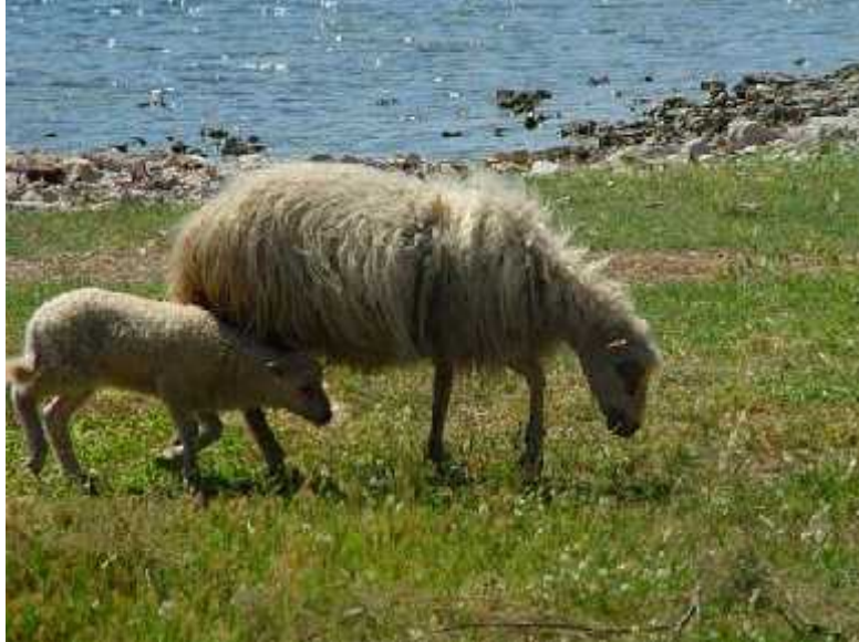
Slika 9. Kornatska ovca

piju more, a zapravo je ta voda boata. U prošlosti su bile važan izvor prihoda Betinjanima i Murterinima zbog mesa, vune, mlijeka i sira. Danas samo rijetki kornatski pastiri šišaju ovce i prodaju vunu (Feri, 1999).