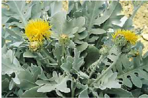
Slika 6. Dubrova ka ze ina – Centaurea ragusina L.