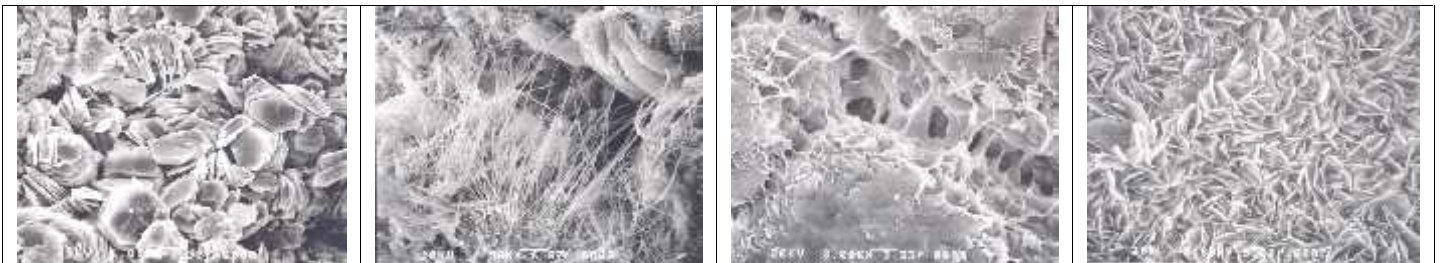
Slika 1. Najčešći minerali gline ( s lijeva na desno ): kaolinit, ilit, smektit, klorit

Glina se koristi i za temeljenje umjetnih jezera i rezervoara, za oblaganje kanala, za različite spremnike radioaktivnog otpada, ali i obradu kontaminirane zemlje i njezino skladištenje.