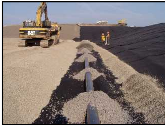
Slika 3. Prikaz izgradnje drenažnog sloja sa perforiranom cijevi