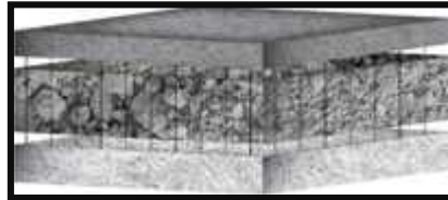
Slika 2. Bentonitni tepih ( geosintetic clay liner ) sastoji se od dva slija geotekstila i bentonita u sredini.

djelovanje). Bentonitni tepisi imaju brojne prednosti u odnosu na klasični brtveni sustav od zbijene gline. Lako se i brzo instaliraju, imaju nisku hidrauličku propusnost ( 2 \times 10^{-10} do 2 \times 10^{-12} m/s), posjeduju sposobnost samozacjeljivanja. Ovim prednostima možemo dodati i povoljnu cijenu osobito u onim područjima gdje nedostaju ležišta glina, kao što je to slučaj u priobalnom području Hrvatske.