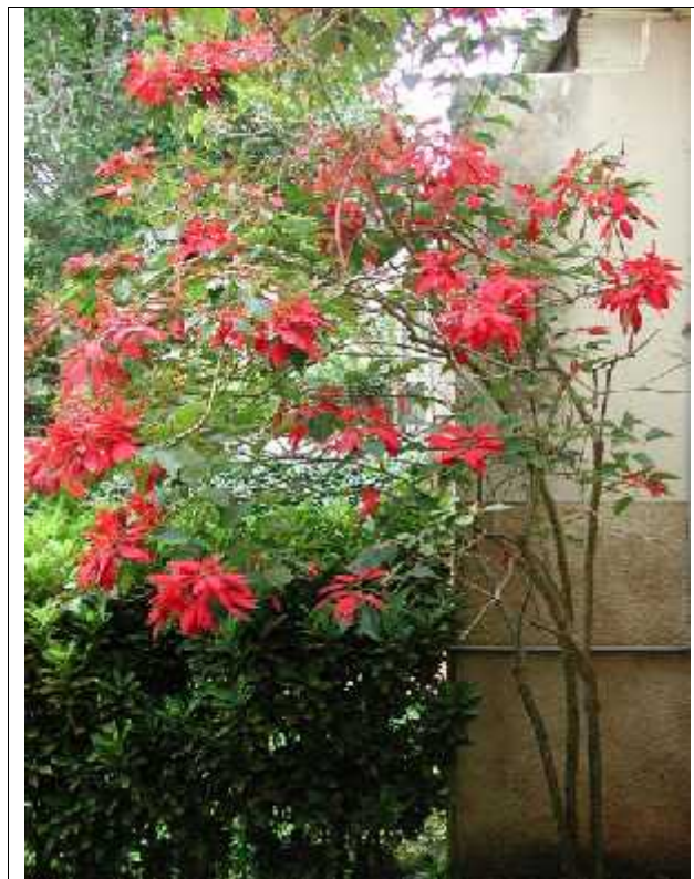
Slika 10. Stablo Boži ne zvijezde ( www.in-cameroon.co.uk )

Asteci su ovu biljku kultivirali znatno prije pojave krš anstva na Zapadu. Zvali su je Cuetlaxochitl (Pi-Yu, 2007). Prema meksi koj legendi, ljepotu duguje aste koj boginji kojoj je zbog nesretne ljubavi, prepuklo srce. Iz kapljica njezine krvi izrastao je vatreni cvijet žarkocrvene boje okružen zelenim listovima (hr.wikipedia.org/wiki/ Boži na_zvijezda). Sjajni «cvijet» su starosjedioci kontinenta obožavali i smatrali simbolom isto e. Tako er su obojene listove (brakteje) ove biljke koristili za dobivanje purpurne boje. U 17. stolje u s obzirom na prigodnu boju i cvjetanje biljke za vrijeme blagdana, španjolski sve enici su ju po eli koristiti za vrijeme domoroda ke procesije, Fieste Santa Pesebre. To je prva zabilježena upotreba poinzecije za boži ni blagdan. Od tada se Boži na zvijezda koristi u Meksiku za ukrašavanje crkvi u boži no vrijeme (Pi-Yu, 2007).