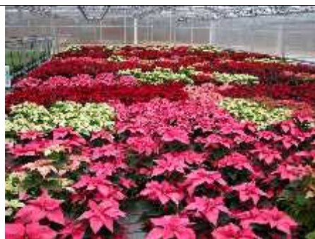
Slika 12. Komercijalni uzgoj zaraženih biljaka