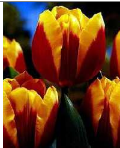
Slika 4. Tip Keizerkroon uvećano