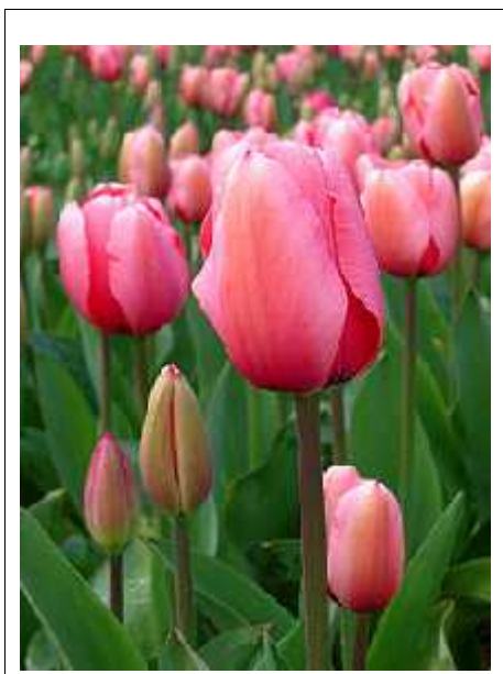
Slika 1. Tulipan ( hr.wikipedia.org/wiki/Tulipan )