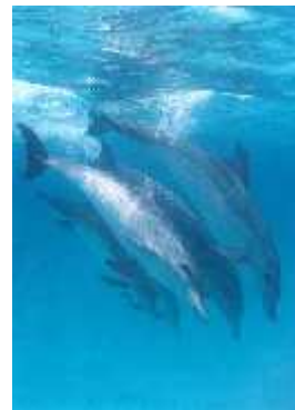
Slika 6. Usklađenost dupina u skokovima

U Shark bay-u u zapadnoj Australiji znanstvenici proučavaju nasrtljivost dobrih dupina gdje su se formirale određene skupine mužjaka koje funkcioniraju poput banda. Tamo se bitke najčešće vode zbog ženki; udružuju se i radi otimanja ženki odnosno sprečavanja istih da se pare s drugim mužjacima, a često se ponašaju makijavelistički. Ipak, za to je potrebna suradnja i održavanje dobrih odnosa unutar skupine ( serendip.brynmawr.edu ).