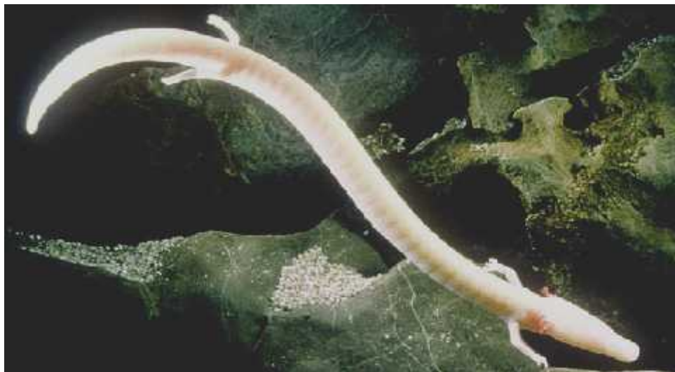
Slika 7.) Proteus anguinus – ovje a ribica

Naseljavaju podzemne sustave dinarskog krša u Hrvatskoj. U Europi se još javljaju u Italiji, Sloveniji te u Bosni i Hercegovini.