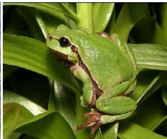
Slika 5.) Gatalinka potpuno prilago ena boji podloge