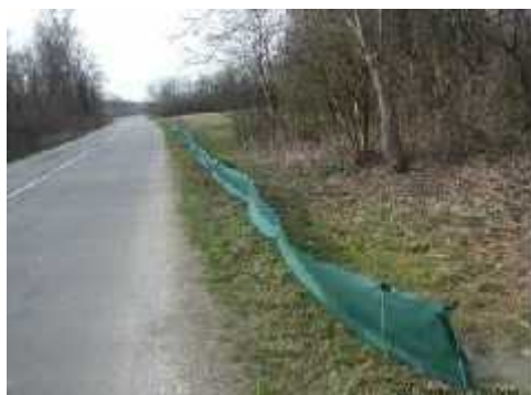
Slika 9.) Izgled mreže postavljene uz cestu

MREŽE – postavljaju se uz rub prometnica, na lokacijama s većim intenzitetom prelaska jedinki vodozemaca (Sl. 9.). Cilj im je usmjeriti vodozemce koji migriraju prema tunelu ili prema mjestu na kojem ih ljudi sakupljaju i prenose. Efikasnije su od prometnih znakova u osiguravanju populacije vodozemaca. Razlikuju se trajne mreže, koje zahtijevaju održavanje od obrastanja vegetacijom jednom godišnje, i privremene , koje je potrebno postavljati i uklanjati jednom godišnje (po završetku sezone i nakon sezone migracija). Ovaj tip mreža zahtijeva organizirani angažman lokalnog stanovništva.