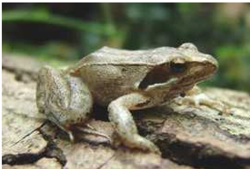
Slika 3.) Rana latastei – talijanska (lombardijska) smeđa žaba

Ova vrsta je endem sjevernog područja nizine rijeke Po. Većina se njezine populacije nalazi u Italiji, a ostatak populacije je razmješten u Švicarskoj (jug pokrajine Ticino), JZ Sloveniji te u Hrvatskoj (središnja i sjeverna Istra, najveći dio obitava u Motovunskim šumama).