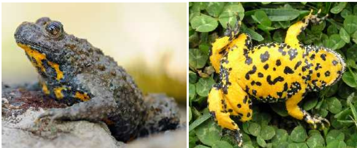
Slika 2.) Bombina variegata – žuti muka (dorzalna i ventralna strana)

Pojavljuju se u zapadnoj, središnjoj, južnoj i istočnoj Europi.