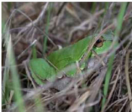
Slika 4.) Hyla arborea - gatalinka

Ova vrsta nastanjuje najve i dio Europe, azijski dio Turske i okolno podru je.