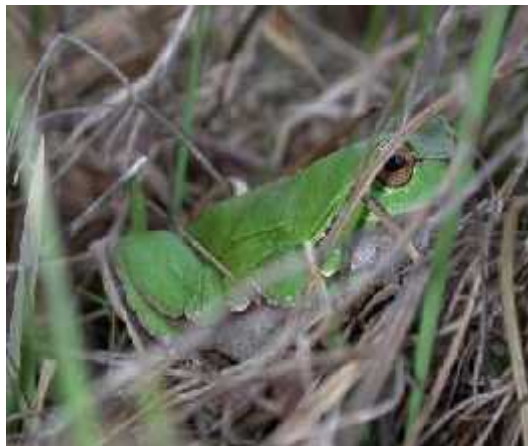
Slika 4.) Hyla arborea - gatalinka

Ova vrsta nastanjuje najve i dio Europe, azijski dio Turske i okolno podru je.