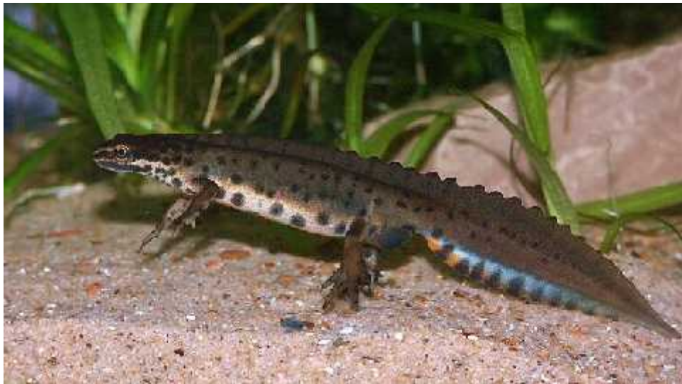
Slika 6.) Lissotriton vulgaris – mali vodenjak

Ova vrsta naseljava ve i dio Europe i zapadne Azije.