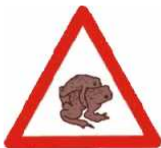
Slika 8.) Prometni znak koji se pojavljuje u blizini vlažnih staništa

PROMETNI ZNAKOVI UPOZORENJA (Sl. 8.) – osim što osiguravaju sigurnost vozača, stalni su podsjetnik na obližnju populaciju vodozemaca, te omogućuju siguran prijelaz jedinki preko prometnica.