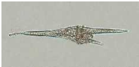
Slika1:Ceratium furca(Ehrenb) Claparede

Dinoflagelati su uz diatomeje najvažniji predstavnici fitoplanktona zbog brojnosti i široke rasprostranjenosti vrsta. Stanicu obavija amfijejma ili teka koja je građena od dvije ili više celulozних ploča. Vrste bez amfijejme imaju periplast i plazmalemu te se zovu atekatne. Kroz celulozne ploče prolaze brojne pore trihocista. Celulozne ploče su glavni element determinacije ovih algi. Dinophyta su miksotrofni i heterotrofni organizmi. Većina migrira na dnevnoj bazi i to vertikalno prema dnu u tamo gdje se hrane sedimentiranim nutrijentima i, prema površini danju gdje fotosintetiziraju. U Rogozni kom jezeru nalazimo pripadnike rodova Scrippsiella , Glenodinium , Gyrodinium , Diplopsalis , te Ceratium (Slika 1) i Prorocentrum (Slika 2) i dr. (Buri i sur., 2009).