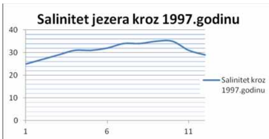
Slika 5.: Godišnje fluktuacije saliniteta

Salinitet jezera kreće se između 22 i 37 (ovisno o godišnjem dobu), dok okolno more ima mnogo stabilnije vrijednosti oko 36 do 38. U jezeru je salinitet smanjen zbog inercije i neznatnih, ali s obzirom na malu površinu jezera, itekako važnih oborina (Slika 5). Tipično je slano jezero smješteno u hidrološki zatvorenom bazenu. U takvim bazenima ravnoteža između unosa slatke vode i evaporacije određuje promjene u rasponu saliniteta i stabilnosti vodenog stupca (Romero i Melack, 1996.). U mediju u kojem je salinitet tako promjenjiv kao što je u Rogoznici jezeru, najbolje uspijevaju eurihalne vrste fitoplanktona. Važno je napomenuti i to da su temperatura i salinitet stabilniji ispod dubine od 7 m, tako da tu mjesto nalaze i neke rijetke vrste planktona. (Ciglenečki i sur., 2004.)