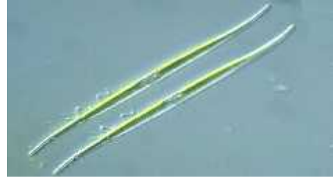
Slika 4: Nitzschia sp.