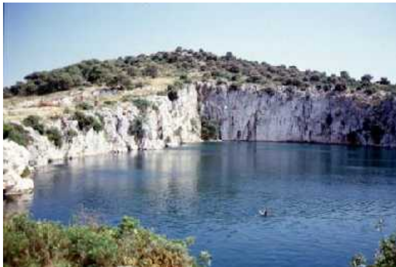
Slika 5: Rogozni ko jezero

Rogozni ko jezero (Slika 5) je malo krško jezero koje se nalazi na poluotoku Gradine kraj naselja Rogoznica. Nastalo je kada se krška jama dubine 15 metara i površine 5300 četvornih metara poela puniti morem iz okoline preko pukotina i podzemnih prolaza u stijenama vapnenca i dolomita. U jezeru rijetko dolazi do miješanja slojeva u stupcu vode. Uzrok tomu je slab protok, tj. prtok morske vode iz okolnoga mora i to što je jezero smješteno u kotlini koja ga štiti od vjetrova. Takvo jezero zovemo meromikti ko što upućuje na stanje stalne kemijske stratifikacije. (Ciglenečki i sur., 1996.)