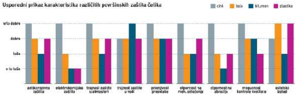
Slika 2. Usporedni prikaz karakteristika pojedinih materijala