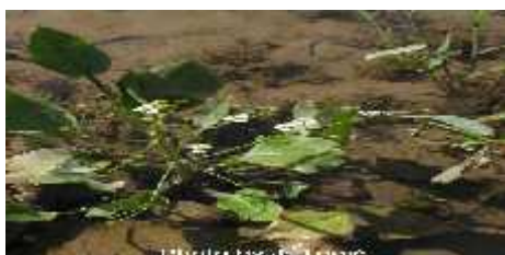
Slika 14. Alisma plantago-aquatica

U okviru makrofitske flore maksimirskih jezera i potoka najslabije su zastupljene biljke koje svoj cijeli životni ciklus provedu u vodi. To su samo Potamogeton nodosus i Myriophyllum verticillatum . Od makrofita koji žive u vodi ali su istovremeno u kontaktu sa zrakom možemo istaknuti vrste: Alisma plantago-aquatica (sl.14), Veronica beccabunga - zabilježene uz potok Bliznac, Glyceria fluitans - uz jezera i potok te Nuphar lutea koji raste samo u petom jezeru. Najbolje su zastupljeni makrofiti u širem smislu, biljke koje samo dio svoga životnog ciklusa provode u vodi i dobro su prilagođene dugotrajnoj egzistenciji na zraku (29 svojti).