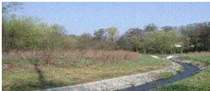
Slika 6. Potok Bliznec ( Kerovec, 2004.)