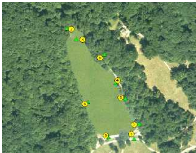
Slika 7. Treće jezero (Janev – Hutinec, 2010.)

Obavljeno je samostalno istraživanje maksimirskih jezera, gdje su geografske koordinate snimane pomoću GPS uređaja Garmin Vista eTrex, a zatim je aplicirano na kartu u programu ArcInfo 9.1. Istraživanje je rađeno krajem svibnja i početkom lipnja. Sustav globalnog pozicioniranja (GPS) je navigacijsko pomagalo koje je prvotno bilo razvijeno za vojne potrebe. Sustav jednostavno prima šalje i prima signale, dok je prava snaga GPS tehnologije u širokom rasponu njezine primjene. Kao i na svakoj karti, za orijentaciju su potrebne tri referentne točke. Tamo gdje se tri referentna pravca križaju, tamo je stajalište tj. GPS prijammnik. Taj se postupak terminološki naziva trilateracija. Sustav se temelji na GPS satelitima koji su u Zemljinoj orbiti. Svaki emitira specifičan signal koji GPS uređaj može primiti. Softver u GPS uređaju interpretira signal, identificira satelit od kojeg je došao, kada je lociran i vrijeme koje je proteklo da signal dopre do sustava. Kad jednom GPS uređaj ima udaljenost i vrijeme započinje određivanjem pozicije. Minimalno tri satelita su potrebna da stvore točku sjecišta tj. poziciju GPS uređaja i četvrti radi dodatne provjere pozicije dobivene trilateracijom. Osim GPS prijammnika za ovo istraživanje je korištena i vizualna metoda proučavanja flore i faune u i oko maksimirskih jezera. Na slici 7. rezultat je takvog istraživanja, gdje su na primjeru trećeg maksimirskog jezera navedeni lokaliteti (zeleni trokuti), te geografske koordinate istih (žuti krugovi).