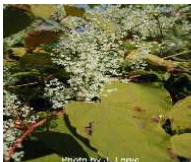
Slika 16. Amorpha fruticosa

Amorpha fruticosa (sl.16)– ivitnja a, amorfa – porijeklom je iz Sjeverne Amerike. Stvara velike količine plodova koje raznosi voda, pa se opasno proširila nizinskim poplavnim područjem gdje predstavlja ozbiljnu smetnju šumskim gospodarstvima jer naglo osvaja površine, onemogućava pošumljavanje i širenje autohtone šumske vegetacije. U parku je zabilježena samo na istom dijelu trećeg jezera. Ujeno je samo nekoliko primjeraka ove biljke, ali s obzirom na njene velike invazivne sposobnosti kao i idealnih uvjeta za njeno širenje preporuča se uklanjanje svih primjeraka.