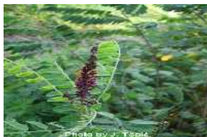
Slika 15. Ambrosia artemisiifolia

Ambrosia artemisiifolia (sl.15) – pelinolisni limundžik, ambrozija - je alergena biljka koja proizvodi velike količine peluda što kod ljudi izaziva alergijske reakcije. U parku je zabilježena na različitim mjestima uz peto jezero i uz potok Bliznec. Kako se Zagrebačka županija nalazi u zoni najveće koncentracije peludi ambrozije u Europi ova bi vrsta trebala kontinuirano uništavati ( upanjem s korijenjem) na svim staništima što je i obaveza donesena od Gradskog poglavarstva grada Zagreba.