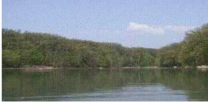
Slika 5. Peto maksimirsko jezero ( Kerovec, 2004.)