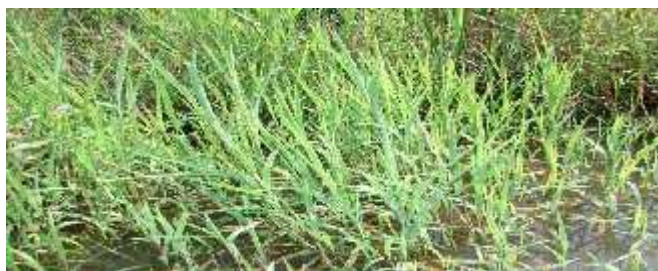
Slika 13. Leersia oryzoides L. ( Vrbek, Buzjak, 2006.)

Leersia oryzoides (L.) Sw. (sl.13)– divlja riža – NT – gotovo ugrožena ( Poaceae ) je trajnica s vriježama i do 100 cm duga kom poleglom stabljikom koja se zakorijenjuje na donjim lancima. Listovi su svjetlo žuto-zeleni, do 30 cm dugi i do 1 cm široki, duguljasto ušiljeni, ravni, oštro-hrapavog ruba. Gornji rukavci su napuhnuti, više ili manje oštro-hrapavi. Ogrljak je 1 mm dug, odrezan. Cvat je rahla 5-17 cm duga metlica; ogranci cvata su valoviti. Klasi i su na vrlo kratkim stapkama, s jednim cvijetom, dugi 5-6 mm. Obuvenac je kruto dlakav, a na hrptu ešljasto dlakav. Raste na vlažnim mjestima, esta je na rubovima staja ica i teku ica (potoka, jezera, manjih rijeka itd.). Cvate od kolovoza do listopada. Svrstana je u kategoriju gotovo ugrožene svojte što zna i da e ugrožavanjem staništa na kojima raste, u bliskoj budu nosti vrlo vjerojatno prije i u jednu od kategorija ugrožene svojte.