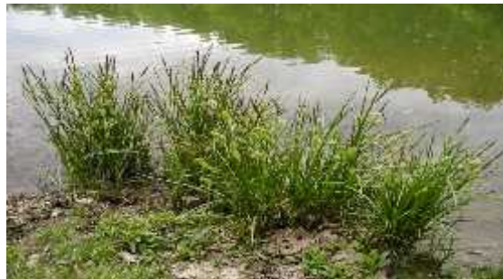
Slika 9. Carex riparia C. ( Vrbek, Buzjak, 2006.)

Carex riparia Curtis (sl.9)– obalni šaš – VU – osjetljiva svojta ( Cyperaceae ) je (30-) 60–200 cm visoka trajnica, snažna biljka s podzemnim vriježama, te uspravnom, oštro trobridnom 3–5 mm debelom stabljikom koja u donjoj polovici nosi listove. Listovi su (5–) 10–20 (–30) mm široki, s donje strane intenzivno plavozeleni s gornje sivozeleni, naglo suženi prema vrhu, a na žilama i rubovima hrapavi. Bazalni rukavci su sme i s ljubi astocrvenim prijelazima. Ovojni listovi cvata su zeleni, poput listova stabljike, bez ili s vrlo kratkim rukavcem. Najdonji je dug poput cvata ili nešto duži. Cvat je više od 40 cm dug s (1–) 2–6 vršnih muških, i (2–) 3–5 ženskih klasi a. Ženski klasi i su sjede i ili na kratkim stapkama, uspravni, gusti, valjkasti. Dugi su (20–) 30–80 (–100) mm i široki 8–12 mm. esto se na vrhu ženskog klasi a nalazi nekoliko, pa i mnogo, muških cvjetova. Muški klasi i su 20–70 mm dugi i 5–10 mm široki. Vre ice koso strše, jajaste su, 5–7 (–8) mm duge, napuhnute, sužene u oko 1.5 mm dug kljun s dva zupca, s finim uzdužnim tamnosme im rebrima, maslinastozelene ili sivozelene boje, gole i sjajne. Plod je obrnuto jajast, trobrid, znatno manji od vre ice, dug 2,5–3 mm i širok 1,5–2 mm, sme e boje.Obalni šaš raste uglavnom na obalama staja ih ili sporo teku ih voda i na povremeno plavljenim, hranjivima i bazama bogatim tresetnim, glinastim i pjeskovitim tlima. Cvate od travnja do lipnja. Uzroci ugroženosti su uništavanje staništa na kojima raste.