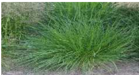
Slika 11. Deschampsia cespitosa (L.)