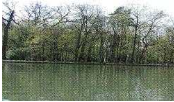
Slika 2. Prvo maksimirsko jezero ( Kerovec, 2004.)