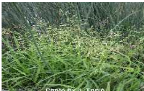
Slika 12. Glyceria fluitans L. ( Vrbek, Buzjak, 2006.)

Leersia oryzoides (L.) Sw. (sl.13)– divlja riža – NT – gotovo ugrožena ( Poaceae ) je trajnica s vriježama i do 100 cm duga kom poleglom stabljikom koja se zakorijenjuje na donjim lancima. Listovi su svjetlo žuto-zeleni, do 30 cm dugi i do 1 cm široki, duguljasto ušiljeni, ravni, oštro-hrapavog ruba. Gornji rukavci su napuhnuti, više ili manje oštro-hrapavi. Ogrljak je 1 mm dug, odrezan. Cvat je rahla 5-17 cm duga metlica; ogranci cvata su valoviti. Klasi i su na vrlo kratkim stapkama, s jednim cvijetom, dugi 5-6 mm. Obuvenac je kruto dlakav, a na hrptu ešljasto dlakav. Raste na vlažnim mjestima, esta je na rubovima staja ica i teku ica (potoka, jezera, manjih rijeka itd.). Cvate od kolovoza do listopada. Svrstana je u kategoriju gotovo ugrožene svojte što zna i da e ugrožavanjem staništa na kojima raste, u bliskoj budu nosti vrlo vjerojatno prije i u jednu od kategorija ugrožene svojte.