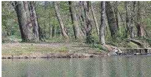
Slika 3. Drugo maksimirsko jezero ( Kerovec, 2004.)