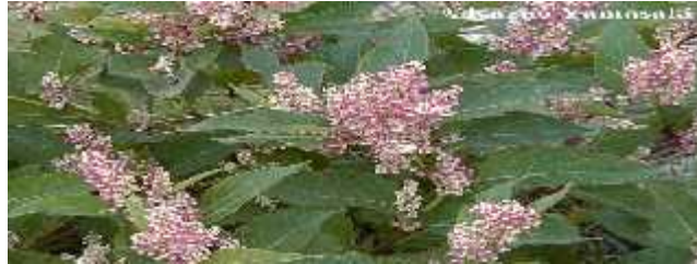
Slika 17. Reynoutria japonica

Reynoutria japonica (sl.17) – porijeklom iz Japana. Unesena kao ukrasna biljka. Brzo se proširila, zauzima uglavnom ruderalna staništa gdje stvara guste sastojine koje prekrivaju svu postojeću u vegetaciju. U parku je zabilježen samo jedan primjerak u gornjem dijelu potoka Bliznec, pa bi, za sada, bilo nužno samo praćenje stanja i brojnosti svake vegetacijske sezone.