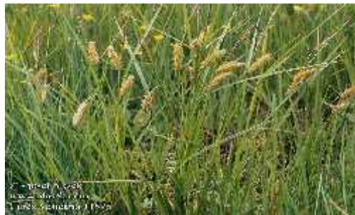
Slika 10. Carex vesicaria L. ( Vrbek, Buzjak, 2006.)

raspadaju. Vre ica su koso strše e, jajaste do ovalne, napuhane, neznatno trobridne, naglo sužene u oko 2 mm dug kljun s dva zupca, gole ali s izrazitim uzdužnim rebrima, žutozelene do svijetlosme e boje. Cvat je do 20 cm dug, a ponekad i duži, na vrhu s 2–3 (–4) muška klasi a i (1–) 2–3, me usobno razmaknuta ženska klasi a. Ženski klasi i su gusti, sjede i ili na kratkim stapkama, uspravni, rijetko ponešto prevješeni, jajasti do duguljasto valjkasti, dugi 20–50 (–70) mm, široki 10–15 mm. Ovojni listovi cvata su poput listova stabljike, duži od cvata i naj eš e nemaju rukavac. Plod je svijetlosme , obrnuto jajast, trobrid, znatno manji od vre ica, dug oko 2 mm i širok oko 1 mm. Raste na obalama staja ih i sporoteku ih voda, na poplavnim livadama i u poplavnim šumama, te u plitkoj vodi i na povremeno plavljenim i bazama bogatim tresetnim i muljevitim tlima. Cvate u svibnju i lipnju. Uzroci ugroženosti su uništavanje staništa na kojima raste.