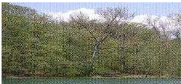
Slika 4. Tre e maksimirsko jezero ( Kerovec, 2004.)