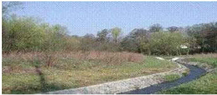
Slika 6. Potok Bliznec ( Kerovec, 2004.)