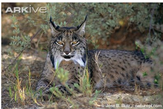
Slika 3. Vrsta Lynx pardinus