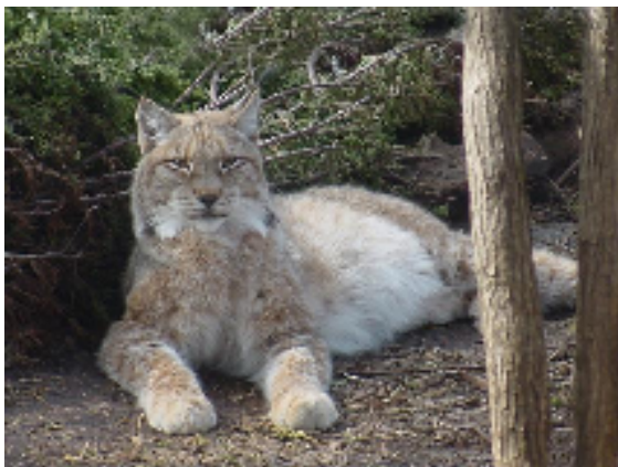
Slika 1. Vrsta Lynx canadensis ( http://animaldiversity )

Danas su poznate četiri vrste risa. Po sistematici, rod Lynx spada u porodicu mačaka ( Felidae ), podred mačkolikih zvijeri ( Feloidea ), koje spadaju u red zvijeri ( Carnivora ). Dvije vrste risa žive na području Sjeverne Amerike, Lynx canadensis Kerr, kanadski ris (sl. 1) i Lynx rufus Schreber, crvenodlaki ris (sl. 2). Na Europskom kontinentu obitavaju druge dvije vrste, Lynx pardinus Temminck, iberijski ris (sl. 3), s područja Iberskog, tj. Pirinejskog poluotoka, te euroazijski ris, Lynx lynx L. (sl. 4) (Gomerčić, 2005).