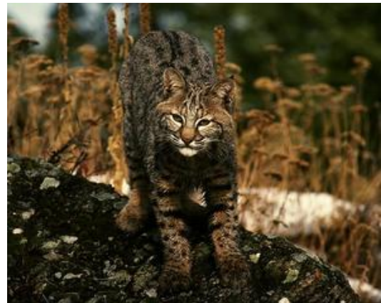
Slika 2. Vrsta Lynx rufus ( http://animaldiversity )