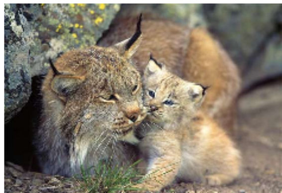
Slika 4. Vrsta Lynx lynx