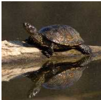
Slika 8. Emys orbicularis

rakovima, koluti avcima, puževima, vodozemcima, malim ribama i vodenim biljem. Ona je est ku ni ljubimac u mnogim dijelovima svijeta, uklju uju i i Hrvatsku. Problem nastaje ako biva puštena u divljinu jer tamo ugrožava autohtone vrste. Kod nas je to slu aj s barskom kornja om s kojom se natje e za hranu i stanište. Predstavlja opasnost i za vrste kojima se hrani, naro ito za male beskralješnjake kao što su vretenca. Istraživanja su pokazala da su opasne i za ptice koje se gnijezde blizu vode, jer se sunaju na njihovim gnijezdima pa ih esto gurnu u vodu i potope. Njezin uvoz je danas zabranjen u mnogim državama ( http://www.hyla.hr/index.php?page=o-crvenouhoj-kornjaci ).