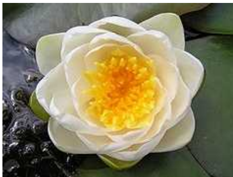
Slika 3. Nymphaea alba

Dubokovodne biljke trebale bi prekrivati tre inu površine jezera radi pozitivnog utjecaja na vodene ekosustave. Osim što stvaraju hlad ribama i sprje avaju razvoj algi, svojim korijenjem na dnu jezera omogu avaju uklanjanje viška hranjivih tvari i ribljeg otpada. Hranu crpe iz podloge i podzemne vode preko korijenja, i direktno iz vode u jezeru preko sitnih korijen i a koji formiraju mrežu neposredno iznad dna (Bridgewater i Bridgewater, 2008, unovi , 1988). U skupinu dubokovodnih biljaka spada nepobjediva kraljica vodenih vrtova Nymphaea alba , bijeli lopo (Slika 3). Lopo i cvjetaju od lipnja, pa sve do pojave prvog jesenskog mraza. Dolaze u mnogo varijeteta i postoje u svim nijansama, od crvene i ruži aste do žute i bijele, i u raznim veli inama, od onih s bujnim cvijetovima veli ine 25 cm i liš em poput tanjura, do elegantnih minijatura ije liš e ne prelazi 5 cm. Lopo i su najpovoljnije biljke za rast i za obilno cvijetanje trebaju samo korektno sa enje, odgovaraju u dubinu i mjesto na suncu ( unovi , 1988). Od ostalih dubokovodnih biljaka za jezera su pogodne Nuphar lutea , Nymphoides peltata i Potamogeton sp. (Noordhuis, 1995).