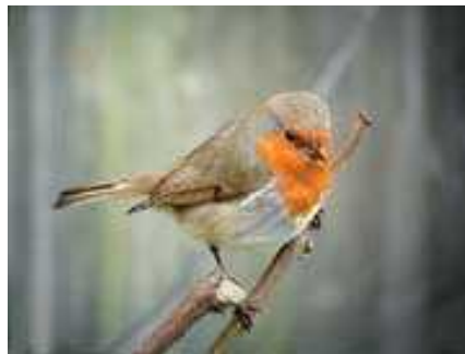
Slika 10. Erithacus rubecula

Među u redovitim i poželjnim posjetiteljima vodenih vrtova našle se i ptice (razred Aves). One zalaze u vrtove zbog potrage za hranom i vodom za piće. Hrane se kukcima, gujavicama, puževima, manjim ribicama, nektarom, punoglavcima i sl. Vrste koje se mogu otkrivati su Turdus merula (kos), Turdus philomelos (drozd), Hirundo rustica (lastavica), Luscinia megarhynchos (slavuj), Parus major (velika sjenica), Erithacus rubecula (crvena ) (Slika 10) te razni golubovi (porodica Columbidae ) (Borovac, 2010, Noordhuis, 1995).