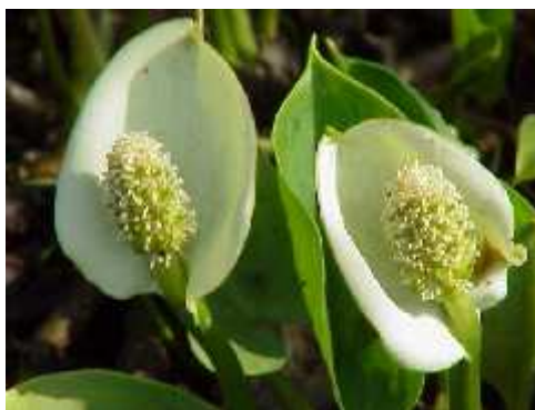
Slika 4. Calla palustris

Biljke koje rastu u plitkoj vodi, uz samu obalu na dubini od 50 do 150 mm, imaju prvenstveno ukrasnu funkciju, daju obojanost i zanimljivost samom jezeru. Životinje, kao što su kukci, vodozemci i ribice, koje su pronašle svoje stanište u vodenom vrtu, me u rubnim biljkama nalaze zaklon od vjetra i kiše (Bridgewater i Bridgewater, 2008). Rubne biljke imaju još jednu odgovornu ulogu da prikriju granicu izme u stranica jezera i vode, materijal od kojeg je napravljeno jezerce ili eventualne kontejnere u koje su posa ene biljke (Vujkovi i sur., 2003). U te svrhe upotrebljavaju se prekriva i tla kao što su Hedera helix , Waldsteinia ternata , Ajuga reptans , Asurum europaerum i Pachysandra terminalis (Noordhuis, 1995). Osim prekriva a tla, rubne biljke su i pro iš iva i voda poput vrsta Mentha aquatica i Veronica beccabunga (Nerat, 2007). Ostale samo osiguravaju stanište životinjama i uljepšavaju obalu poput Carex elata , Iris pseudacorus , Sagittaria sagittifolia , Polygonum amphibium , Iris versicolor , Calla palustris (Slika 4), Ranunculus aquatilis ( http://www.vrt.com.hr/vrtovi/kutak-uz-jezerce.html ).