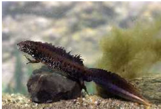
Slika 7. Triturus dobrogicus

gmazova, ptica i sisavaca. Zabranjeno je uzimati jaja iz prirode i vodozemci bi trebali sami kolonizirati vodene vrtove. Ukoliko se ne pojavljuju, možda im ne odgovara stanište ili nisu na njega naišli. U tom slučaju, mogu se uzeti jaja iz obližnjeg umjetnog vrta i vidjeti hoće li se uspostaviti stabilna zajednica. Vjerojatno je da će se pojaviti vodozemci redova Anura (bezrepci) i Caudata (repaši). Vrste bezrepca koje se dobro snalaze u urbanim vrtovima su Rana kl. esculenta (zelena žaba), Bufo bufo (velika krastača), Bufo viridis (zelena krastača) i Hyla arborea (gatalinka). Repaši se mogu vidjeti u vodi samo u proljeće. Ljeti se skrivaju ispod kamenja ili na drugim vlažnim mjestima (Noordhuis, 1995). Puno su osjetljiviji na prisutnost ljudi i riječi u gradskim vrtovima od bezrepaca. Ipak, ako vrt ima neka obilježja moćnih staništa tamo će se moći naći vrste poput: Triturus dobrogicus (dunavski vodenjak) (Slika 7), Triturus carnifex (veliki vodenjak), Lissotriton vulgaris (mali vodenjak) i Salamandra salamandra (šareni daždevnjak) ( http://www.hyla.hr/index.php?page=vodozemci ).