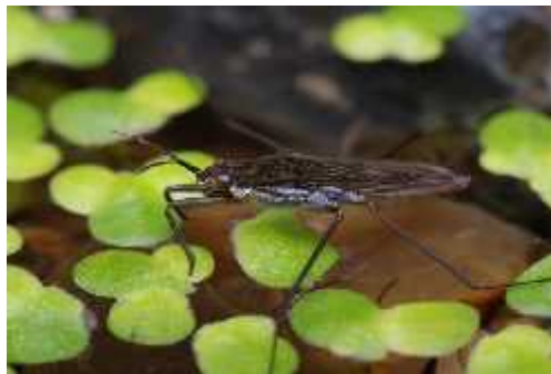
Slika 5. Gerris lacustris

ostalim životinjama (Chinery, 2000). U podred Heteroptera (raznokrilci) spada velik broj kukaca koji su svojim na inom života zaradili pridjev «vodeni». Jaja polažu u vodu i hrane se beskralješnjacima, ak i manjim ribama i punoglavcima. Neke njihove predstavnike možemo vidjeti na samoj površini vode, dok se drugi nalaze u stupcu vode. Najpoznatije porodice su Nepidae ( Nepa cinerea , Notonecta glauca ), gazivode Gerridae ( Gerris lacustris (Slika 5), Hydrometra stagnorum ) i vesla ice Corixidae ( Corixa punctata , Sigara striata ) (Borovac, 2010, Chinery, 2000).