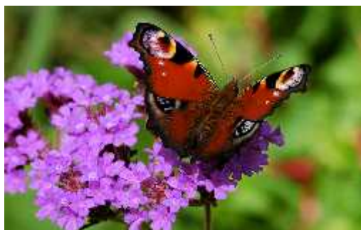
Slika 9. Vanessa io