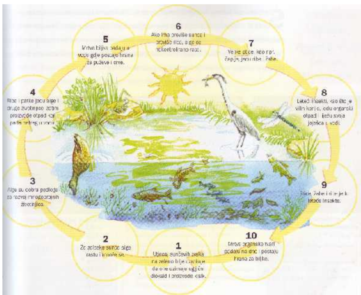
Slika 11. Pojednostavljeni prikaz vodenog vrta s uspostavljenom ekološkom ravnotežom (Bridgewater i Bridgewater, 2008)

Neformalna jezera, osmišljena po uzoru na prirodna staništa, obuhvaćaju širok spektar biljaka i životinja koje zajedno čine mali, zatvoreni ekosustav (Slika 11). Cilj takvih vodenih vrtova je uspostava ravnoteže koja zahtjeva svaku ljudsku intervenciju u svrhu održavanja sustava svesti na minimum (Nerat, 2007). U jezerima koja su pažljivo smještena i dobro izgrađena, te nastanjena sa zdravim i prikladnim biljkama i divljim životinjskim svijetom, održavanje se svodi na nadgledanje stanja, dijeljenje i premještanje biljaka, povremene građevinske popravke i sezonsko održavanje. U proljeće i ljeto održavanje obuhvaća, osim uobičajene sadnje, kontrolu i uklanjanje prekomjerno razmnoženih algi. U jesen problem stvara lišće koje treba redovito uklanjati kako ne bi povećalo trofiju jezera. Zimi je poželjno spriječiti zamrzavanje površine jezera kako bi se izmjena plinova između vode i zraka mogla nesmetano odvijati (Bridgewater i Bridgewater, 2008, Trstenjak, 1989).