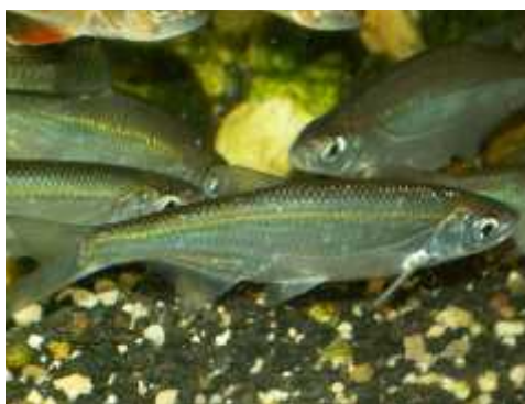
Slika 6. Alburnus alburnus

i Alburnus alburnus (uklija) (Slika 6). Zlatne ribice su alohtona vrsta, u našim krajevima prisutne preko 300 godina, i vrlo su popularne u vrtnim jezercima (Bridgewater i Bridgewater, 2008). Podnose razne vremenske prilike, a s vremenom se naviknu i na visoke ljetne temperature (jezerce bi ipak trebalo biti u sjeni). Bez problema preživljavaju nekoliko tjedana pod ledom, dok god na dnu ima nezaleđene vode bogate kisikom ( http://bs.wikipedia.org/wiki/Zlatna_ribica ). Uklija je brza, mala, razigrana ribica, pogodna za mala jezera s divljim životinjskim svijetom. Boje joj variraju od svijetlo narančaste do srebrnkasto crvenosmeđe (Bridgewater i Bridgewater, 2008). Ostale vrste koje dolaze u obzir su Rutilus rutilus (bodorka), Scardinius erythrophthalmus (crvenperka) i Cyprinus carpio (koi). Ribe koi, porijeklom iz Japana, su izuzetno prilagodljive i pogodne za uzgoj u vodenim vrtovima. Neki od razloga zašto su toliko popularne kod uzgajivača je to što su svežderi, zimi ih nije potrebno hraniti jer tada ne jedu te im ne smeta hladna voda i pojava leda sve dok u vodi ima dovoljno kisika. Međutim, ova vrsta može narasti i do 100 cm dužine što znači da im treba jezero zadovoljavajuće dubine (ne bi smjela biti ispod jednog metra) i veličine ( http://www.akvarijske-ribe.com/vrsta.php?tsn=163344 ).