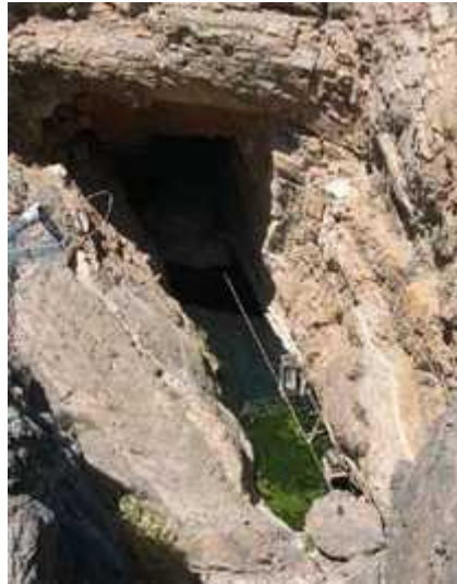
Slika 8. Devil's hole