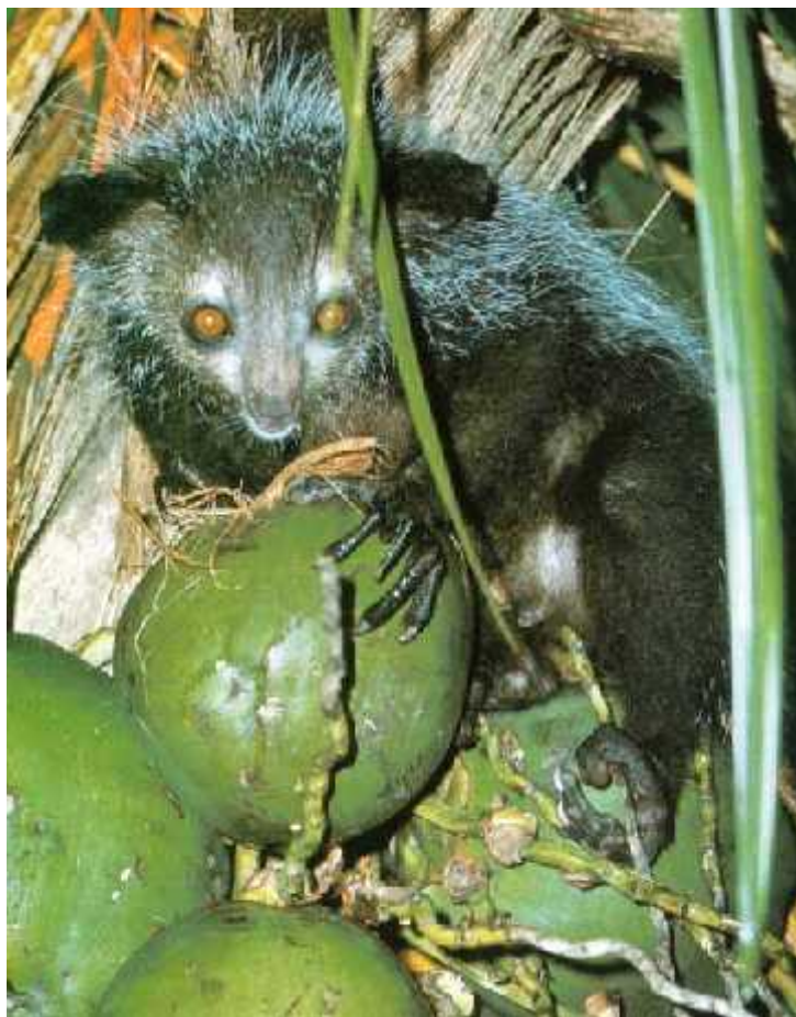
Slika 10. Aye aye ( Daubentonia madagascariensis ) prilikom hranjenja

http://www.primates.com/lemurs/aye-aye.htm