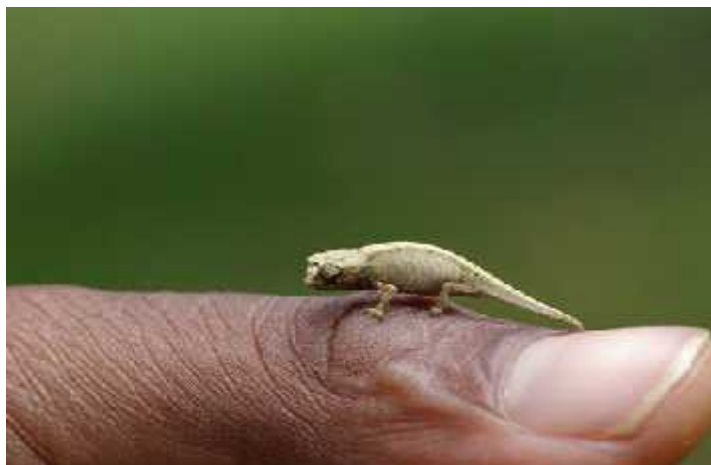
Slika 4. Najmanji gmaz svijeta, Brookesia minima , tj. njegova veli ina u odnosu na ovjekov prst

Ovo podru je je jedno od najve ih centara raznolikosti kameleona. Na svijetu ima oko 150 vrsta kameleona, a više od polovice nalazi se na Madagaskaru. Oni nastanjuju tropske kišne šume, savane i polu-sušna podru ja. Specifi nost kameleona njihova je mogu nost promjene boje. Ovo nije samo primjer kripti ne obojenosti, ve na taj na in i izražavaju emocije i raspoloženje te komuniciraju me usobno. Gra a tijela prilago ena im je životu na drve u, imaju rep koji im služi za pridržavanje za grane drve a. Izgubili su sposobnost autotomije repa upravo zbog ovog razloga. Na otoku se može na i i najmanji kameleon, a ujedno i najmanji gmaz na svijetu, Brookesia minima (Slika 4).