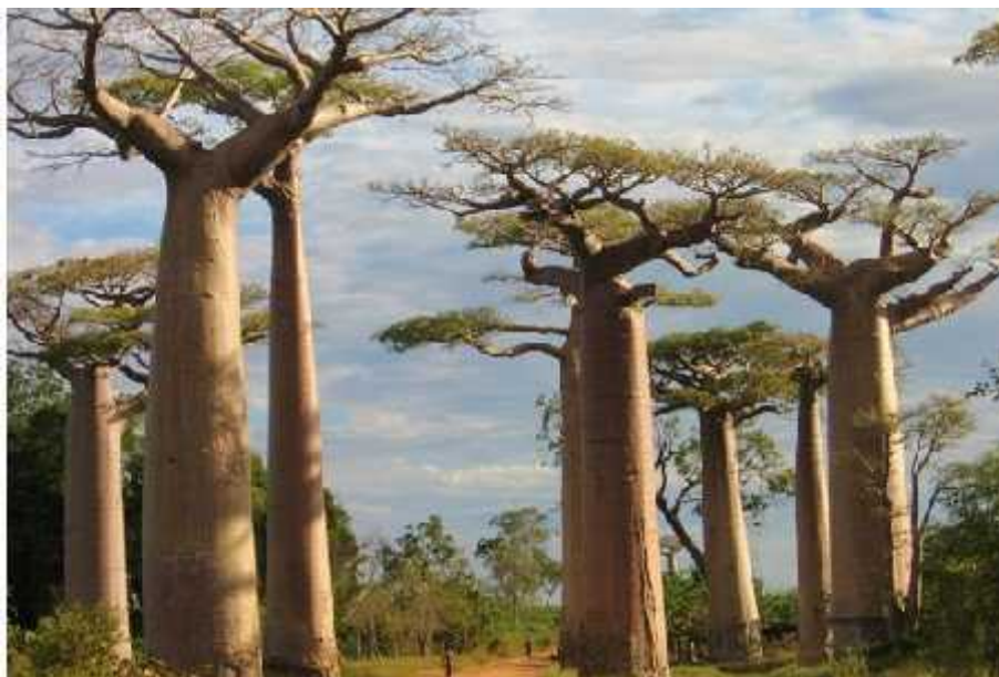
Slika 3. Specifično drveće baobaba, vrsta Adansonia grandieri

http://www.linternaute.com/voyage/afrique/photo/madagascar-l-ile-de-la-tentation/une-allee-de-baobabs.shtml