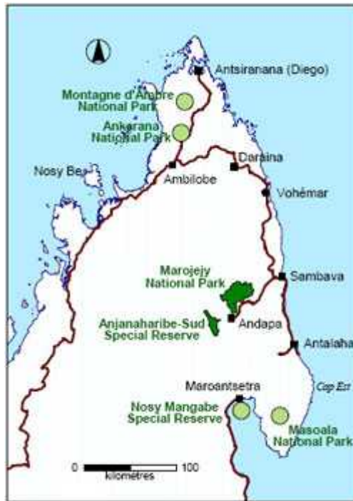
Slika 5. Položaj Nacionalnog parka Marojejy

http://www.treehugger.com/files/2009/03/illegal-logging-looting-civil-strife-close-madagascar-national-park-rare-lemurs-at-risk.php