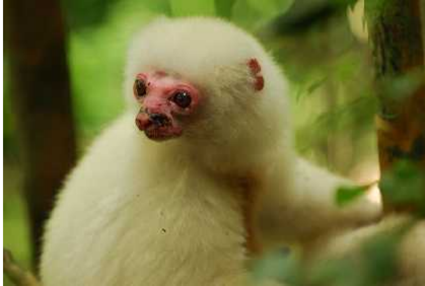
Slika 9. Propithecus candidus sa nedostatkom pigmentacije na licu http://eol.org/pages/7250889/overview