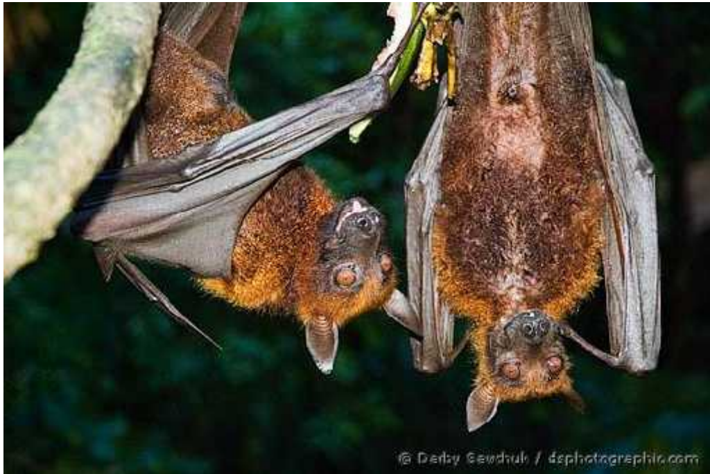
Slika 8. Vrsta Pteropus rufus