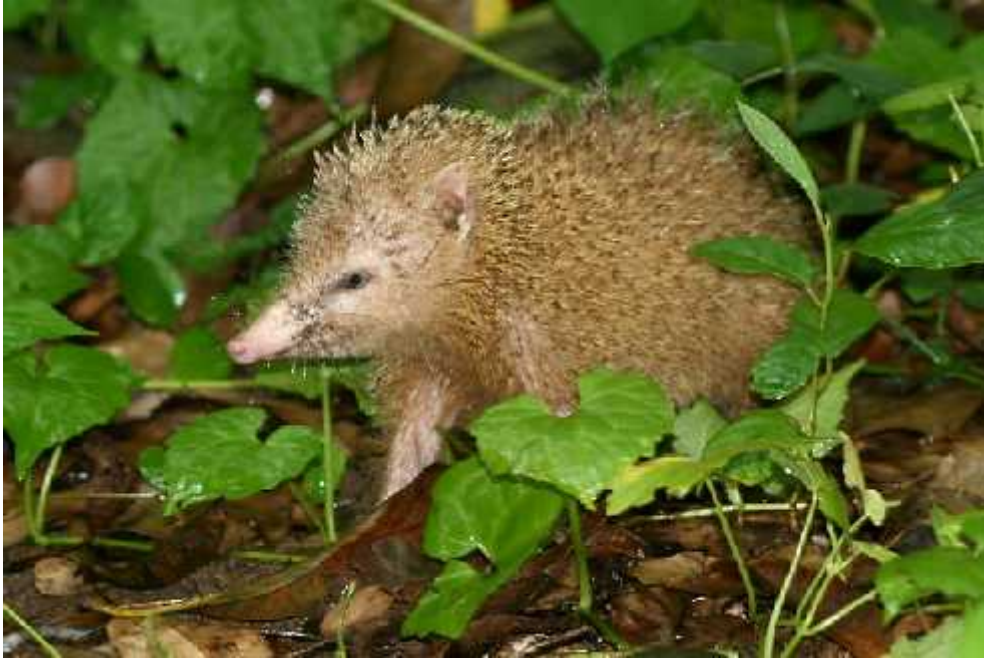
Slika 7. Vrsta Tenrec ecaudatus

http://www.biolib.cz/en/taxonimage/id77078/?taxonid=37316