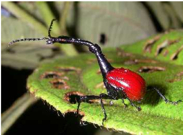
Slika 6. Mužjak Trachelophorus giraffa

Izobilje šumskih staništa predstavlja idealno sklonište mnogim jedinstvenim vrstama životinja. Mnoge grupe organizama, kao što su beskralješnjaci, još nisu dovoljno istraženi. Usprkos tome, neki su već dobro poznati, kao npr. neke stonoge, pauzi, pijavice, puževi i kukci. Najpoznatiji od kukaca je Trachelophorus giraffa kojeg karakterizira izdužen vrat nalik žirafinom (Bradt, 2007) (Slika 6).