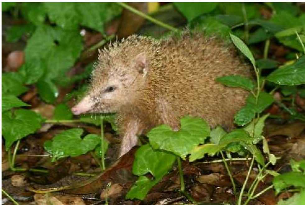
Slika 7. Vrsta Tenrec ecaudatus