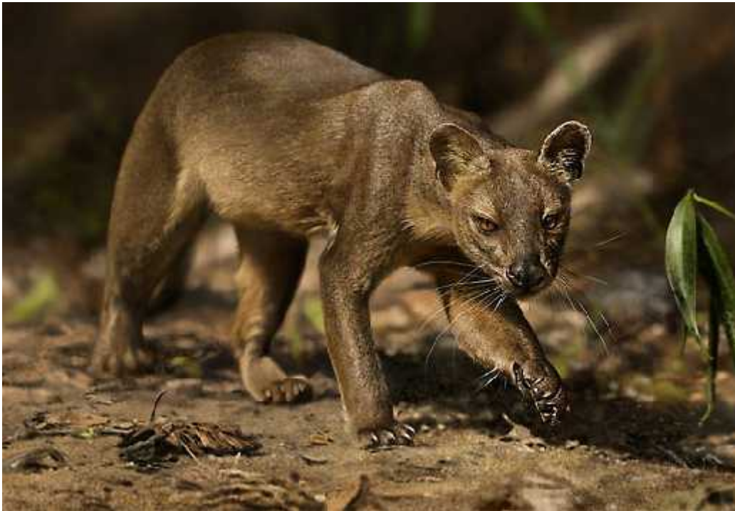
Slika 11. Fosa ( Cryptoprocta ferox )

Ima vitko, produženo tijelo pokriveno kratkim mekim krznom zlatno-smeđe boje, kratke i snažne noge, te duga i tanki rep. Ona pokazuje nekoliko prilagodbi na arborealan tip života: vešpomenuti duga i tanki rep koji joj služi za ravnotežu prilikom penjanja, pandže koje su zakrenute te se ne mogu uvući i do kraja i vrlo lako okretni zglobovi. Upravo zbog tih razloga vrlo su spretni penjači. Dnevno znaju preći i po 7 km, a u visinu se po drveću znaju penjati i do 700 m visine (Laborde, 1986). Aktivne su danju i noću, s time da je vrhunac aktivnosti zabilježen u vrijeme potpunog mraka. Ne spava na određenim mjestima, već svaki put bira mjesto ovisno o situaciji: to mogu biti špilje, na drveću, na tlu, na lišću, ali mu je ipak najdraže odmaranje na velikim granama drveća. Zauzimaju i love na velikim teritorijima. (mužjaci do 26 km 2 , ženke do 13 km 2 ). Granice obilježavaju koristeći i miris iz žlijezdi koje su smještene oko urogenitalnog područja.