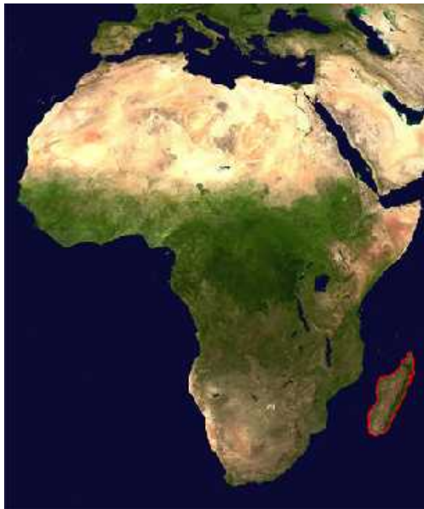
Slika 1. Položaj Madagaskara

Madagaskar je otok u Indijskom oceanu, smješten isto no od obale jugoisto ne Afrike, a razdvaja ih Mozambi ki kanal (Slika 1). To je etvrti najve i otok na svijetu, nakon Grenlanda, Nove Gvineje i Bornea, površine 587 040 km 2 . esto ga se naziva Crvenim otokom, zbog tla crvene boje, koje je ujedno i siromašno za poljoprivredu ( https://www.cia.gov/library/publications/the-world-factbook/geos/ma.html ).