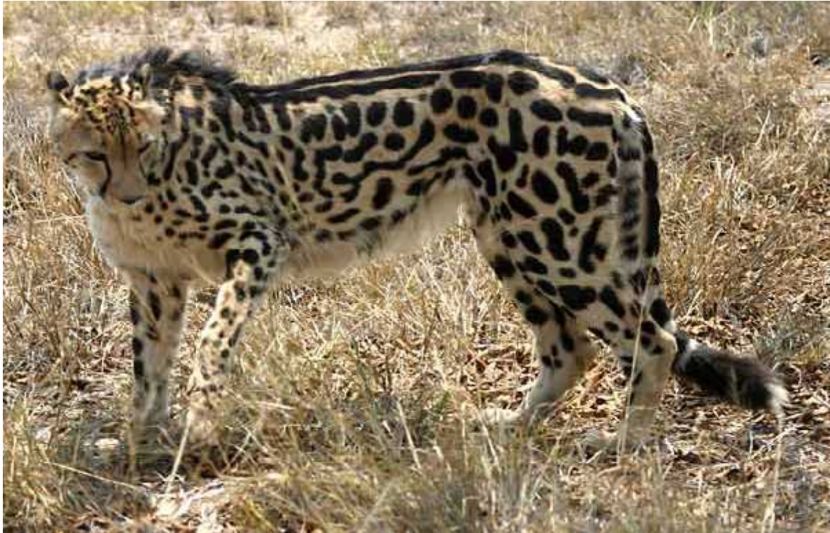
Slika 12. Kraljevski gepard

podvrsta nego samo rijetka mutacija nasljeđena jednim recesivnim genom (oba roditelja moraju imati taj gen da bi mladi bili takvi). Kraljevski gepard je jako rijedak, ima ga svega oko 30 jedinki u Zimbabveu, ali je važan zbog porasta genetičke diverziteta unutar potporodice Acinonychinae . (R. J. van Aarde, A. van Dyk 1986).