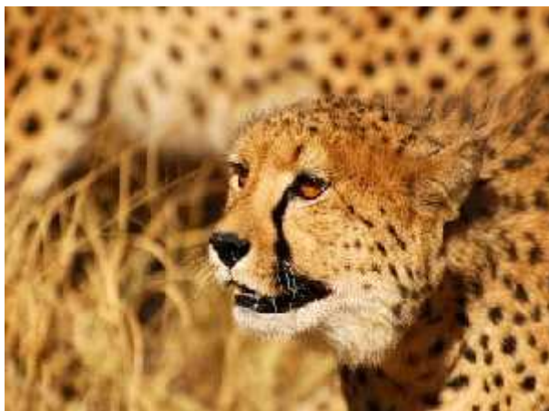
Slika 10. Acinonyx jubatus velox

Acinonyx jubatus velox ( Slika 10.) ili Kenijski gepard je najslabije istražena podvrsta geparda. Jedino što se zna o njemu je da je vi en u Africi i to na podru ju zapadne i isto ne Afrike, a najviše na podru ju Kenije po emu je i dobio nadimak. Dokazan je kao podvrsta i nakon toga je nestao, ali ipak vi en s vremena na vrijeme. Spada u kategoriju zaštite VU ( Osjetljivi) prema IUCN-ovoj listi zaštite.