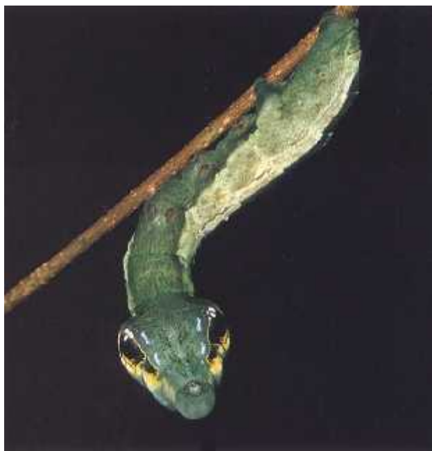
Slika 3. Primjer mimikrije kod gusjenica porodice Sphingidae ( http://www.animalpicturesarchive.com/ArchOLD-6/1137122544.jpg )

Neke gusjenice iz porodice Sphingidae mogu oponašati zmiju (Slika 3). Kada se osje aju ugroženima, napušu ” rep” koji tada izgledom podsje a na glavu zmiije, okrenu ga prema predatoru te ga na taj na in prestraše ( http://www.animalpicturesarchive.com/view.php?tid=3&did=20703 ).