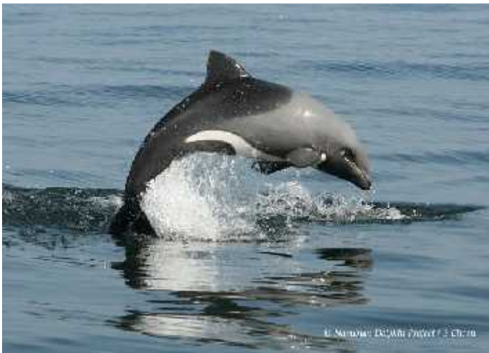
Slika 1: Cephalorhynchus heavisidii

Dupini su najbrojnija i najraznolikija porodica morskih sisavaca. Za sada je poznato 36 vrsta koje su raspoređene u 17 rodova (Rice 1998.). Naseljavaju sve oceane i uglavnom se zadržavaju u obalnim područjima, iako ima i vrsta koje se kreću u otvorenim morima. Većina su male do srednje veličine. Najmanji je Cephalorhynchus heavisidii (Sl. 1), dužine oko 1.2 m i prosječne težine od 40 kg, a najveći i Orcinus orca (Sl. 2) koji može narasti i do 9 m i težiti preko 6 tona. Iako se morfološki dosta razlikuju, sve vrste dupina su vrlo inteligentna i društvena bića.