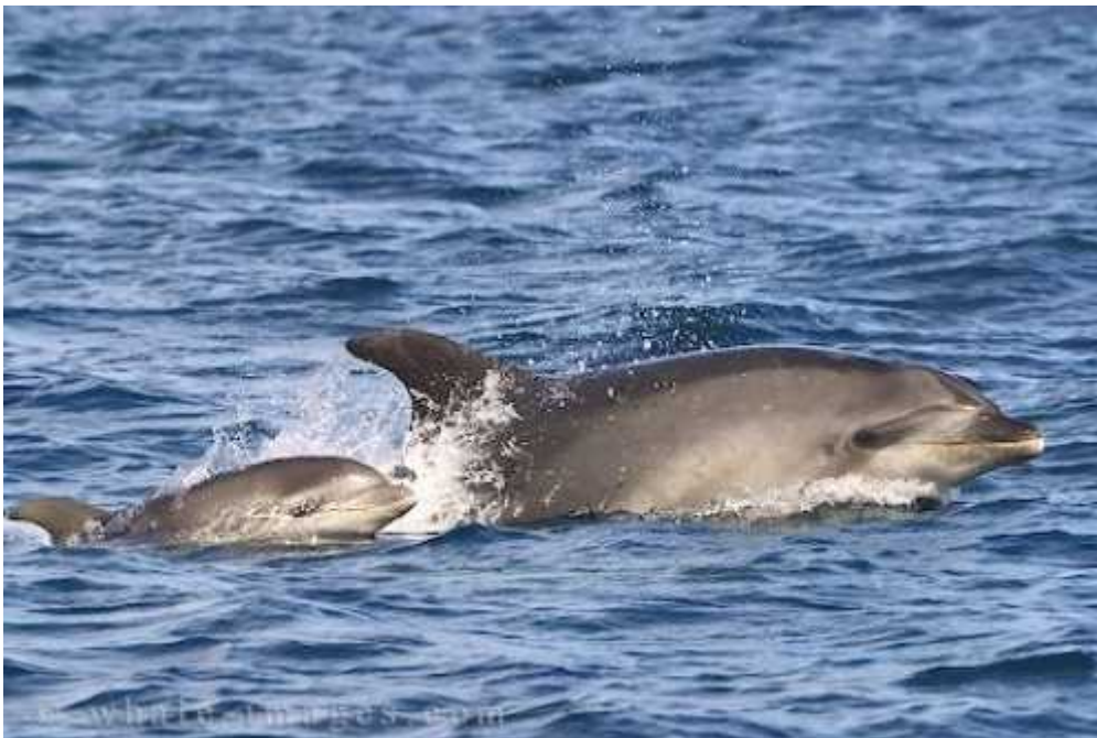
Slika 4: Tursiops truncatus – majka sa mladim

Mladi dupini se rađaju sa sposobnošću u proizvodnji jednostavnih zvižduka, koji se, barem kod nekih vrsta, s vremenom razvijaju i postaju individualni potpisni zvižduci. Zvižduci prethode sjedinjenju, tako da mladi u prvim danima života učestalo zvižde zbog želje da budu povezani s majkom. Prvih nekoliko tjedana mladi plivaju u karakterističnom položaju pokraj majke (Sl. 4). Kroz nekoliko mjeseci počinju plivati ispod majke.