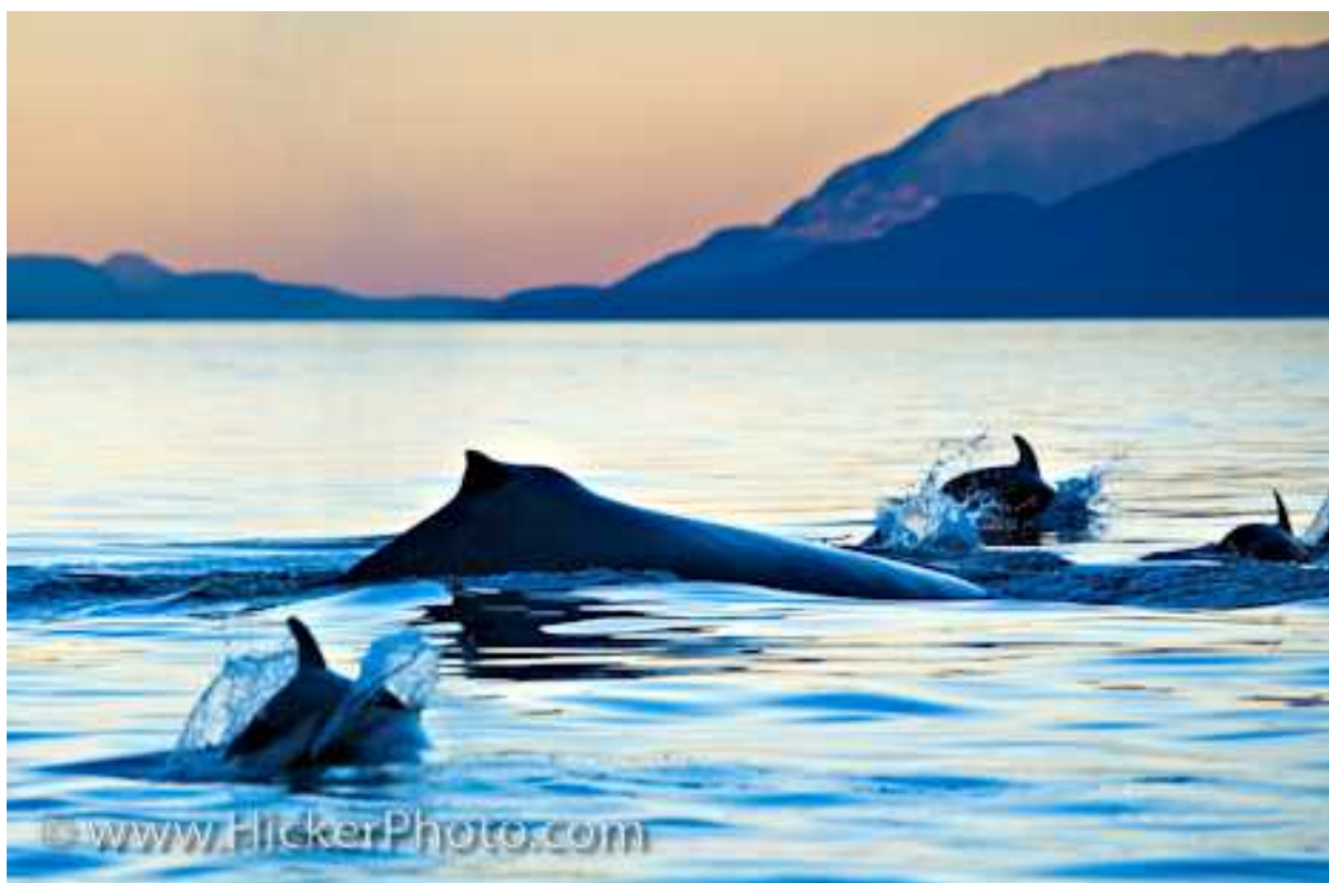
Slika 5: Lagenorhynchus obliquidens & Megaptera novaeangliae

Osim zajedništva unutar istih vrsta, ve ina vrsta dupina vi ena je u društvu drugih vrsta. U isto nom tropskom Pacifiku poznate su zajednice dupina Stenella attenuata i Stenella longirostris u agregaciji sa tunom žutih peraja ( Thunnus albacares ) i brojnim vrstama morskih ptica. U Meksi kom zaljevu pet vrsta iz roda Stenella živi na relativno malom podru ju, što je više vrsta iz tog roda nego u ikojem drugom dijelu tropskih oceana. Ostala poznata interspecifi na udruženja su ona izme u vrsta Peponocephala electra i Lagenodelphis hosei , te izme u dobrog dupina i vrste Globicephala macrorhynchus , Nekoliko vrsta, poput Lissodelphis borealis i Lagenorhynchus obliquidens , su vi ene s brojnim drugim vrstama morskih sisavaca iz skupina Mysticeti i Pinnipedia (Sl. 5).