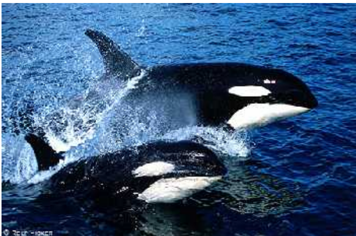
Slika 2: Orcinus orca