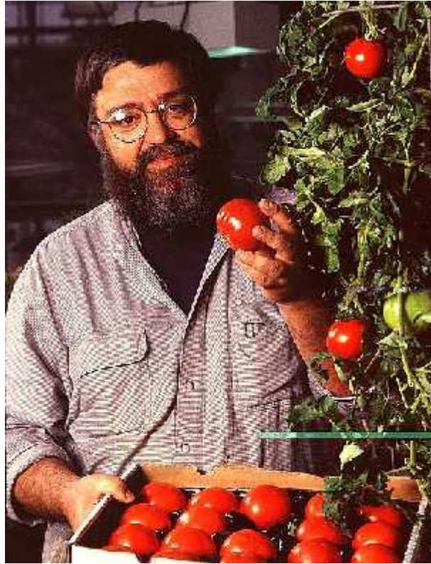
Slika 3- Istraživa s geneti ki modificiranom „Flavr Savr“ raj icom

gena uvjetuju mekšanje ploda ime raj ica postaje nepodobna za duži transport i skladištenje. Ameri ka tvrtka Calgene uspjela je blokirati gen za enzim poligalakturonazu koji razgra uje pektin u stijenci stanice i tako omekšava plod. Time su stvorili novu, geneti ki modificiranu raj icu dužeg trajanja koja je zadržala sve ostale karakteristike, tzv. „Flavr Savr“ raj icu. (Batista, 2009)