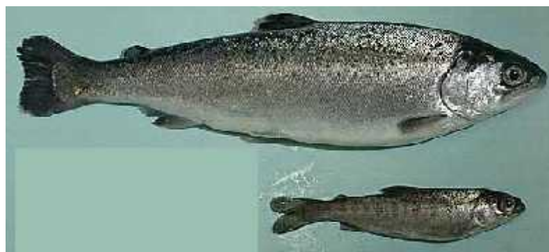
Slika 4- Primjer geneti ki modificiranog lososa u odnosu na prirodnog

Geneti ki modificirane životinje mogu biti korištene u različite svrhe. S druge strane, ovaj vid praktične aplikacije geneti ki modificiranih organizama izaziva svakako i najžešće u polemiku s aspekta sigurnosti hrane i zaštite zdravlja potrošača.