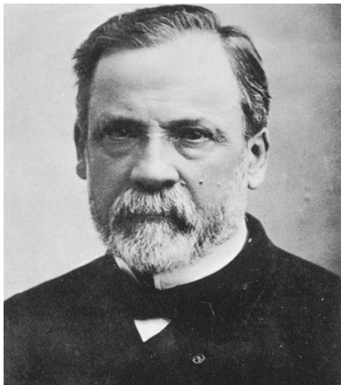
Slika 1. Louis Pasteur

U 15. stoljeću u Italiji, fizičar Girolamo Fracastoro proučavao je bjesnoću i zaključio da se na čovjeka širi izravnim dodirom sa slinom ili krvlju zaražene životinje. Tada joj je nadjenulo ime po kojem je danas poznata – bjesnoća ili rabies – temeljeći ga na Sanskritskom rabhas ("bjesniti") ili latinskom rabere ("mahnitati"). Četiri stoljeća kasnije, rad francuskog kemičara i mikrobiologa Louisa Pasteura (Slika 1.) označio je veliki preokret u borbi protiv bjesnoće – napravljeno je preventivno cjepivo. Točnije, Pasteurov učenik Emile Roux ubrizgao je virus u kunića, a zatim ga oslabio dehidriranjem zaraženog živca iz leđne moždine. Takav oslabljeni virus postao je cjepivo.