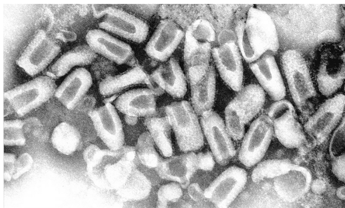
Slika 2. Metkasti oblik virusnih čestica

Rabies je neurotropni virus veličine 75-280 nm. Ima oblik metka (engl. bulletshaped) (Slika 2.) koji mu daje vanjska proteinska ovojnica omotana oko helikalnog nukleokapsida. Njegov precizan naziv je Lyssavirus tipa 1. Genom virusa čini jednolančana RNA negativne orijentacije, veličine otprilike 12 kb. Kodira za pet različitih proteina: RNA polimerazu L (enzim za polimerizaciju novih RNA), protein matriksa M, fosfoprotein P, nukleoprotein N i glikoprotein G (Slika 3.). Nadalje, virus je vrlo osjetljiv na neke okolišne faktore - lako ga je uništiti izlaganjem izravnoj sunčevoj svjetlosti, UV zračenjem, povišenom temperaturom, otopinom 70%-tnog etilnog alkohola i etera, natrijevim deoksikolatom, tripsinom, pa čak i običnim detergentom.