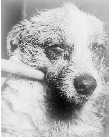
Slika 5. Bijesan pas

U zadnjoj, paralitičkoj fazi (2 – 10 dana) živci su paralizirani, životinja mirno leži, zbog paralize larinksa potpuno je onemogućeno gutanje, a također su paralizirani i mišići donje vilice, jezika i očiju. Životinja prestaje disati, pada u komu i na kraju umire nakon tri do četiri dana.