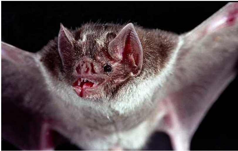
Slika 7. Šišmiš vampir Desmodus rotundus