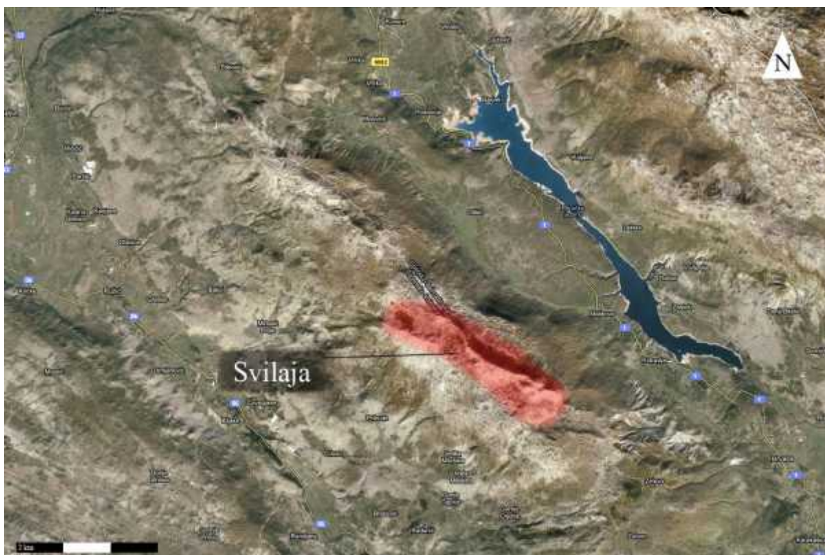
Slika 1. - Lokacija planine svilaje

Svilaja je 30-ak kilometara duga planina smještena u dalmatinskoj zagori, između Knina, Drniša i Sinja, sjeverno od Splita (Slika 1.).