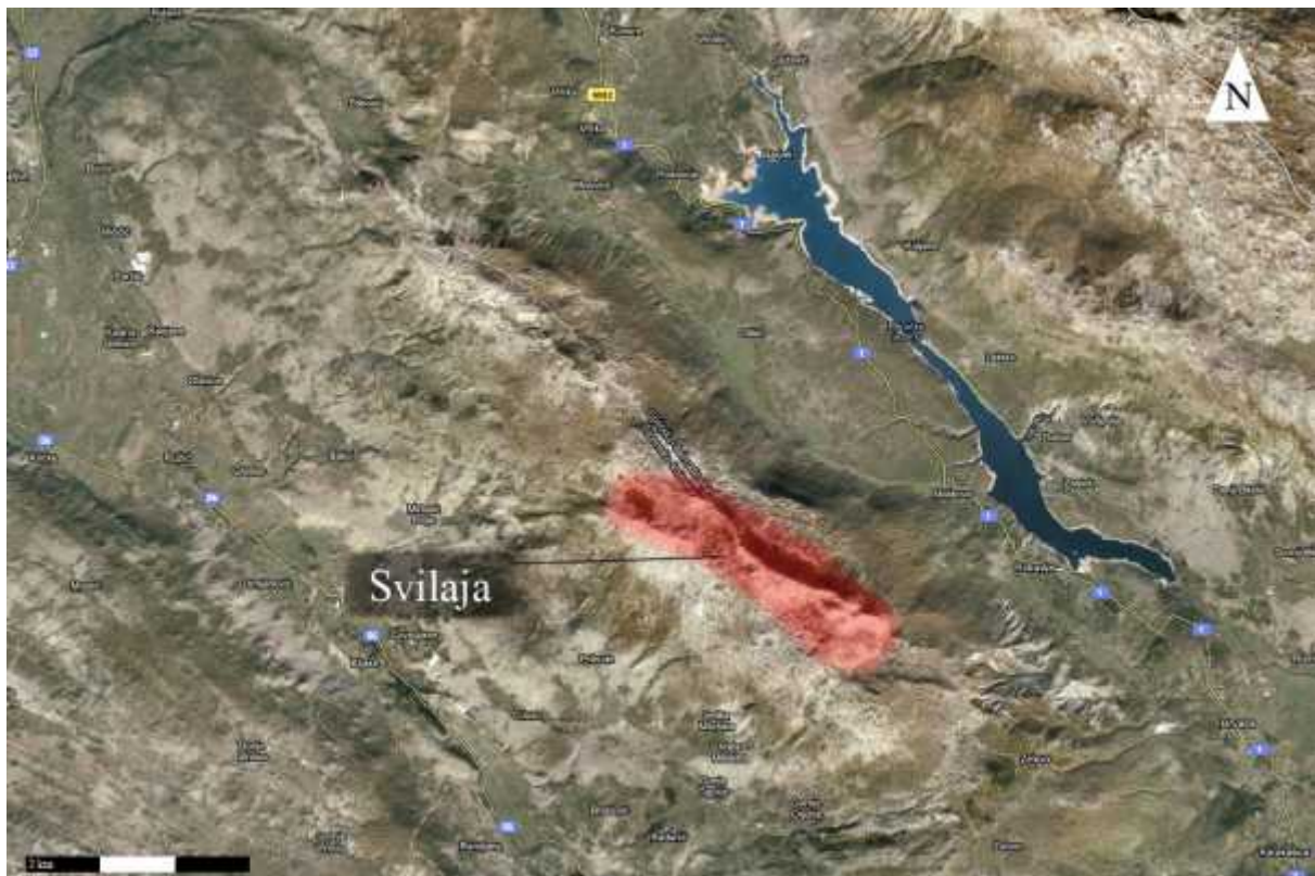
Slika 1. - Lokacija planine svilaje, preuzeto sa maps.google.com (18.09.2011.)

Svilaja je 30-ak kilometara duga planina smještena u dalmatinskoj zagori, između Knina, Drniša i Sinja, sjeverno od Splita (Slika 1.).