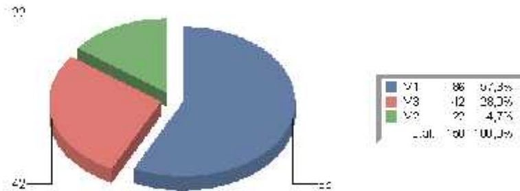
Slika 3. Grafi ki prikaz endemi nosti me u svojnama koje imaju fotodokumentaciju. Broj vrsta za koje indeks nije poznat: 2681 (V1 subendemi na, V2 endemi na, V3 stenoendemi a).

Me u svojnama koje imaju fotodokumentaciju najviše je subendemi nih (86 tj. 57,3%), potom slijede stenoendemi ne (42 tj. 28%) i endemi ne (22 tj. 14,7%). Ukupan broj endema s fotografijom je 150.