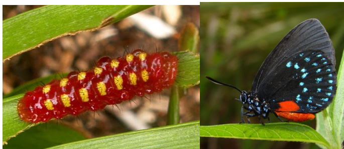
Slika 9. Ličinka i odrasla jedinka leptira Eumaeus atala Poey

Zamia je važna za opstanak leptira Eumaeus atala Poey. Ličinke ove vrste hrane se isključivo lišćem roda Zamia . Ovaj leptir gotovo je nestao na Floridi zbog urbanog razvoja, no kako se Zamia sadila u ukrasne svrhe, brojnost im se povećavala ( www.butterfliesandmoths.org ).