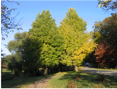
Slika 2. Ginkgo biloba (www.treetopics.com)