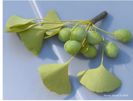
Slika 3. Lišće i plod ginkga