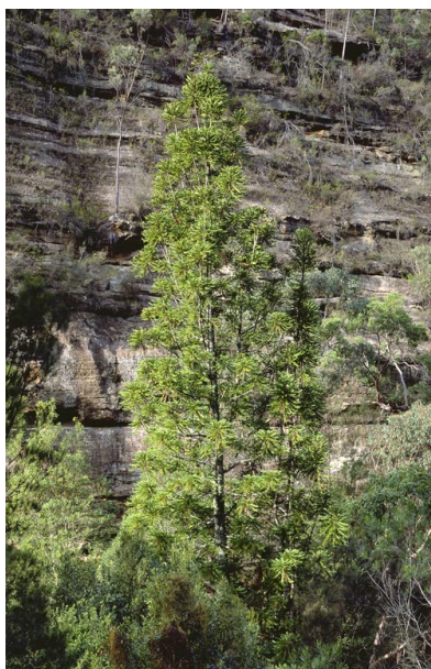
Slika 8. Volemija „King Billy“