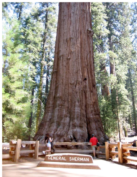
Slika 6. „General Sherman“