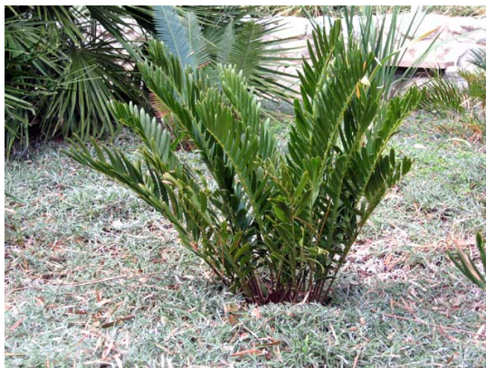
Slika 10. Zamia integrifolia

Zamia je prirodno rasprostranjena na Bahamima, Kajmanskom otočju, Kubi, Portoriku, SAD-u (Florida, Georgia) (Jones 1993, www.iucnredlist.org ).