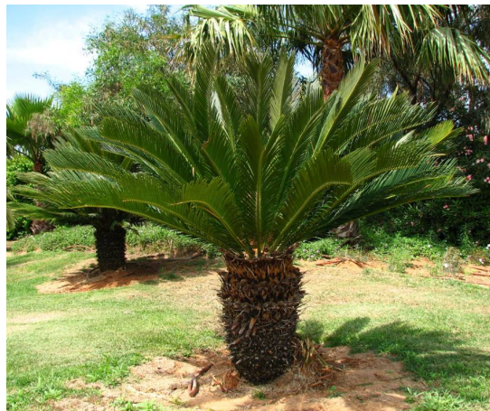
Slika 1. Cycas revoluta

Cijelo potkoljeno Cycadophytina smatra se najprimitivnijim golosjemenjačama, u građi vegetativnih organa pokazuju veliku sličnost sa papratnjačama ali se od njih razlikuju u građi generativnih organa, po pojavi sjemenog zametka i po samoj tvorbi sjemena (Vidaković 1982).