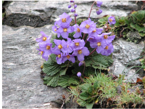
Slika 12. Ramonda nathaliae ( www.icom-macedonia.org.mk )

Zanimljivost je da se kao i R. serbica nalazi na poštanskoj marki Srbije (Josifović 1974, www.panicic.bio.bg ).