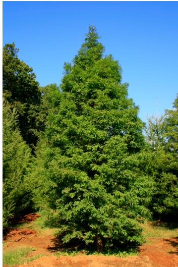
Slika 4. Metasequoia glyptostroboides ( www.halkanursery.com )

Metasekvoja se uzgaja u Sjevernoj Americi i Europi kao ukrasno stablo. U Hrvatskoj je možemo vidjeti u Botaničkom vrtu Prirodoslovno – matematičkog fakulteta u Zagrebu te arboretumu Lisičine na Papuku u kojem se također nalazi i Sequoia sempervirens ( www.sumari.hr ).