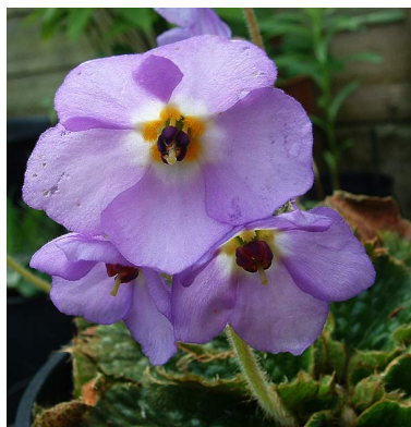
Slika 13. Ramonda serbica

Srpska ramona je rasprostranjena u Srbiji, Makedoniji, Crnoj Gori, Albaniji, Grčkoj i Bugarskoj. Jedina dva mjesta u svijetu gdje srpska i natalijina ramona rastu jedna uz drugu, u tzv. simpatriji, nalaze se blizu Niša. Pretpostavlja se da su migrirale uslijed glacijacije te da su se tako našle zajedno na tim mjestima. Srpsku i natalijinu ramonu najlakše je razlikovati prema obliku lista i cvijeta. Srpska ramona ima svijetlo ljubičaste, a natalijina ramona tamno ljubičaste cvjetove (Josifović 1974, www.blic.rs ).