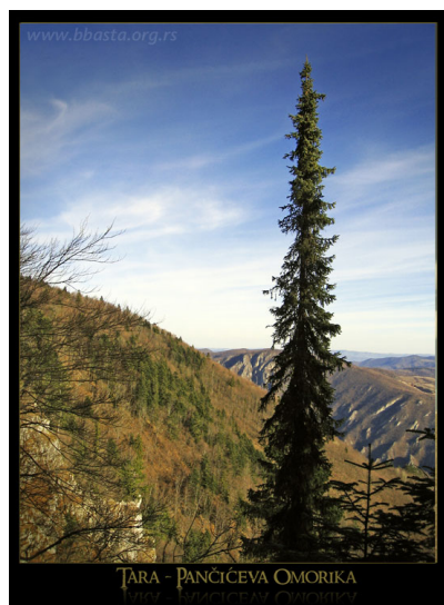
Slika 11. Picea omorica

J.Pančić sahranjen je 1888. godine u sanduku napravljenom od omorike na vrhu planine Kopaonik, koji po njemu nosi ime Pančićev vrh. Pančić je dao velik doprinos botanici, ekologiji, zaštiti prirode, biogeografiji, geologiji... Samo u Srbiji opisao je 2176 biljnih vrsta ( www.tara-planina.com ).