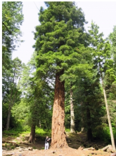
Slika 5. Sequoia sempervirens

Obalna sekvoja raste vrlo dobro na vlažnim, pjeskovitim, ilovastim tlima, a zahtjeva veliku vlažnost zraka. Također joj pogoduju učestale magle za vrijeme ljetnih mjeseci jer joj daju dodatnu vlagu. Godišnje treba 50 do 60 cm kiše i ne šteti joj smrzavanje zimi. Obalna sekvoja raste vrlo brzo do svoje 50. godine, mlada stabla mogu u 20 godina dosegnuti 20 m visine. Dosegne starost i do 1800 godina (Lanzara i Pizzetti 1984, Vidaković 1982).