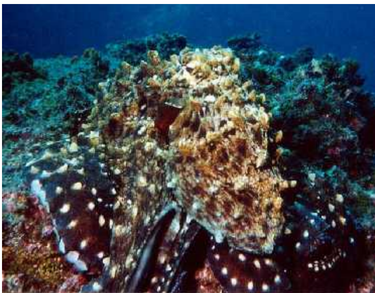
Slika 5. Tjelesni uzorak vrste Octopus cyanea prilagođen pozadini

duljine duž cijelog spektra i kada su kromatofori stegnuti pa se smatra da su oni ključni za u inkovito uklapanje u okoliš kod hobotnica koje su slijepe na boje (prema Messenger 2001).