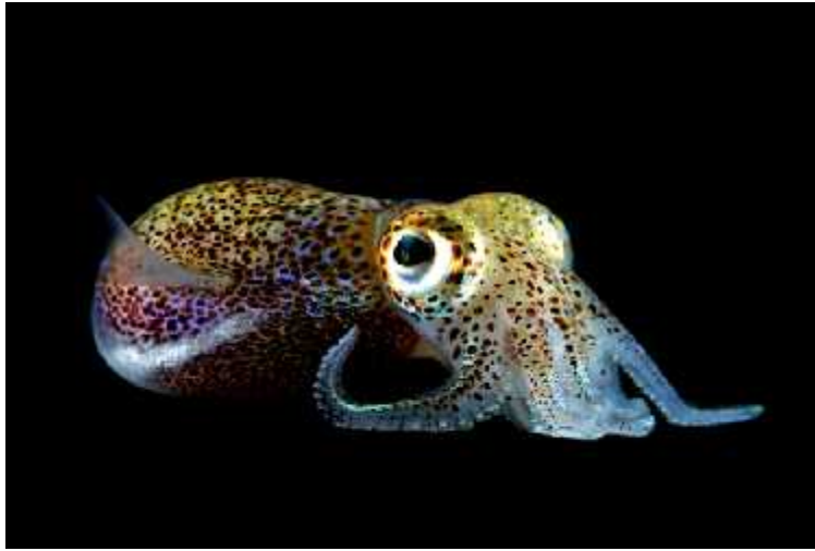
Slika2: Bioluminiscencija vrste Euprymna scolopes , preuzeto sa

prekriveni pigmentima kromatofora kada ih životinja ne želi pokazati, ali mehanizam još nije poznat.