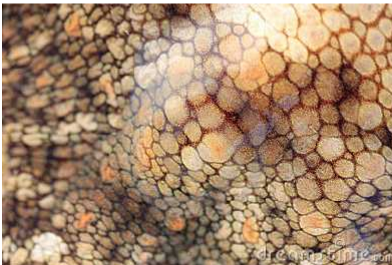
Slika 3: Koža vrste Octopus vulgaris sa „krpicama“ okruženim brazdom

Opisani elementi se ne nalaze u svim dijelovima kože glavonožaca, niti su ravnomjerno distribuirani ondje gdje se pojavljuju. Umjesto toga, organizirani su u jedinice. Takve su jedinice prvi put opisane kod vrste O. vulgaris (Packard i Hochberg, 1977). Kod ove vrste, cijelo je tijelo prekriveno kružnim „krpicama“, promjera oko 1 mm, okruženim brazdom (slika 3). Unutar svake takve „krpice“ rasprostranjeni su kromatofori, iridofori i leukofori, ali njihov raspored nije slučaj. Kromatofori se pojavljuju preko cijele „krpice“ kao i iridofori, no leukofori se pojavljuju samo u njenom centralnom dijelu. To i u sredini, iako ne nužno izgrađena, nalazi se papila. Muskulatura kože je takva da brazda koja okružuje „krpicu“ može biti duboka ili plitka i „krpica“ može biti glatka ili hrapava. Naposljetku, ako je papila izgrađena, vešna „krpice“ postaje šiljak.