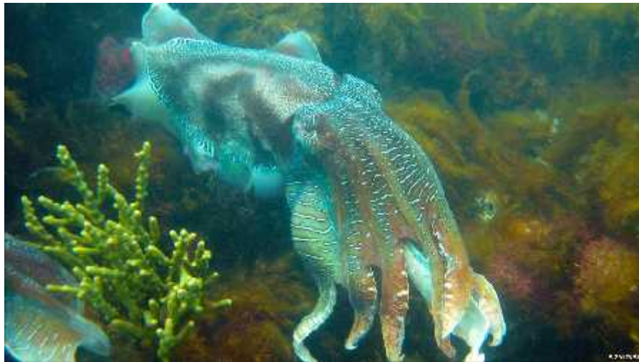
Slika 6. Prikaz prolaznog oblaka na koži sipe

Glavonošci mogu raditi prikaze kada se susreću sa plijenom ili predatorom. Sipa u susretu sa škampom može pokazati tamne valove koji prelaze preko tijela od vrha plašta do vrha krakova (prikaz prolaznog oblaka, slika 6) ili signal sa tamnim krakovima (prvi i/ili drugi par krakova leluja s jedne na drugu stranu). Poruka je vjerojatno „stani i gledaj“, i odvla i pažnju od dugih krakova koje e upravo izbaciti (Hanlon i Messenger, 1996).