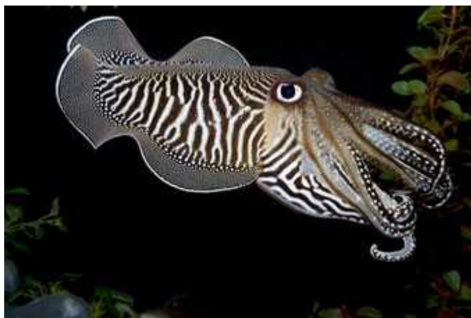
Slika 7: Intenzivni zebrasti prikaz spolno zrelog mužjaka vrste Sepia officinalis , preuzeto sa:

Možda najpoznatiji je intenzivni zebrasti prikaz S. officinalis . Spolno zreli mužjaci obično ga pokazuju ženkama ili drugim mužjacima prilikom nadmetanja (slika 7). Prikaz je vrlo upadljiv, moduliranog intenziteta (crno-bijeli kontrast), uključuje niz pruga te krugove (bijeले točke na krakovima i tamni prsten oko oka), cijelo tijelo je okrenuto prema jedinki kojoj je prikaz upućen.