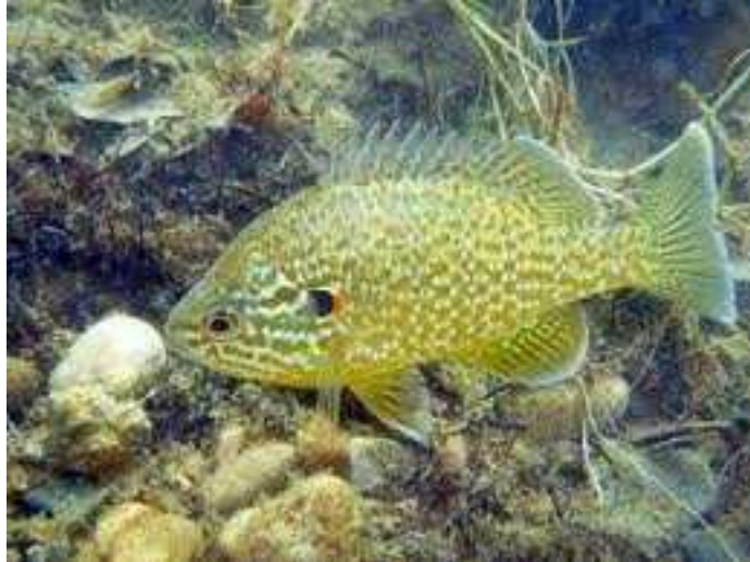
Slika 13. Lepomis gibbosus

( http://vukovisadunava.com/ihtiologija/suncanica/ )