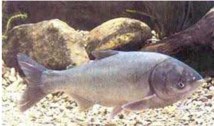
Slika 10. Hypophthalmichthys molitrix ( http://karantina.deptan.go.id/ )

Ova alohtona vrsta iz porodice Cyprinidae (Sl.10.) autohtono živi u Kini i Sibiru ali unesena je u vode skoro cijelog svijeta pa tako i naše zbog kvalitetnog mesa i iscjeljujućih bazena od planktona i algi. Živi u sporoteku i vodama ili stajalicama, a u Hrvatskoj najčešće u ribnjacima šarana, te u našim krajevima nije poznato da se prirodno mrijesti ( www.ribe-hrvatske.com ).