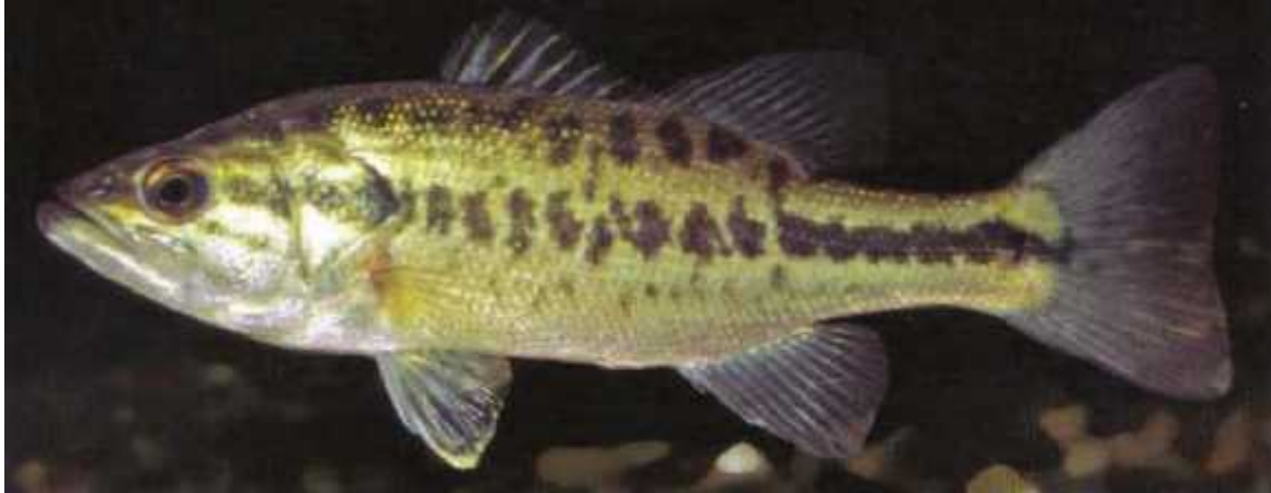
Slika 1. Micropterus salmoides

(Kottelat M., Freyhof J., 2007. Handbook of European freshwater fishes)