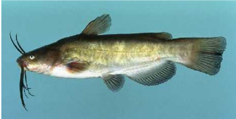
Slika 16. Ameiurus nebulosus