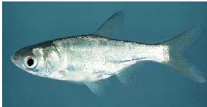
Slika 11. Hypophthalmichthys nobilis ( http://wdfw.wa.gov/ais/search.php?id=5&orderby=Classification%20ASC )

Vrsta slična prethodnoj, ali se od nje razlikuje po tome što na trbuhu ima greben (Sl. 11.). Također pripada porodici Cyprinidae i donesena je iz Kine i Sibira radi uzgoja, a iz uzgajališta se vrsta proširila u otvorene vode. ( www.ribe-hrvatske.com ).