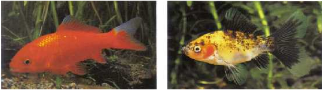
Slika 8. Različiti varijeteti vrste Carassius auratus (Kottelat M., Freyhof J., 2007. Handbook of European freshwater fishes)

kultiviranih varijeteta koji se razlikuju veličinom, oblikom i bojom (Sl. 8.) (Kottelat i Freyhof, 2007).