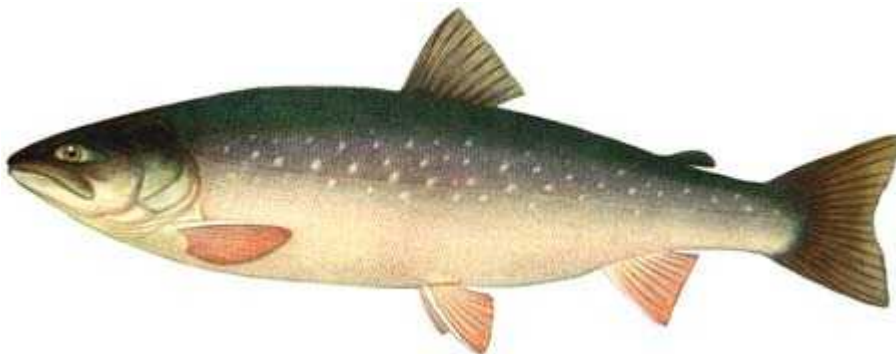
Slika 14. Salvelinus alpinus

Alohtona vrsta iz porodice Salmonidae (Sl. 14.) koju nalazimo uglavnom u vodama sjeverne hemisfere i to u istim, hladnim jezerima. U Sjevernom ledenom moru su pronađene anadromne vrste koje spolno sazriju u moru i ulaze u rijeke kako bi se mrijestile. U naša područja unesena je iz alpskih jezera 1943. godine. U naše otvorene vode proširila se vjerojatno tako što je pobjegla iz ribnjaka ili su ribolovci namjerno puštali vrstu u otvorene vode (Kottelat i Freyhof, 2007).