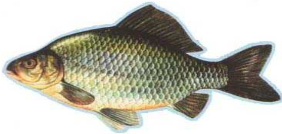
Slika 7. Carassius gibelio ( www.ribolov-osijek.com )

prešavši put od gotovo nepoznate vrste pedesetih godina do invazivne vrste vrlo velikih populacija (Mrakov i sur., 2006). U naše ribnjake dospjela je s mlađ i drugih riba uvezenima iz Maarske, a iz ribnjaka je prešla i u otvorene vode ( www.ribolov-osijek.com ). Glavni razlozi nezadrživog širenja te vrste su izostanak prirodnih predatora i otpornost na nepovoljne uvjete kao što su velike promjene temperature i koncentracije kisika. Razvoj jajeta babuške može biti potaknut i ikrom mužjaka drugih ciprinidnih vrsta (specifičan način razmnožavanja kojeg nazovemo ginogeneza) pa se i zbog toga jako brzo šire. Babuška je izrazito prilagodljiva vrsta koja je velikom brojnošću prisutna u gotovo svim vodama i crnomorskog i jadranskog slijeva. U ribnjacima je postala izravni konkurent šaranu jer jede njegovu hranu, pa su se populacije šarana u našim vodama proporcionalno smanjile. ( www.ribe-hrvatske.com )