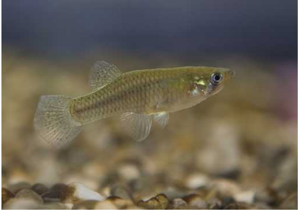
Slika 5. Gambusia affinis