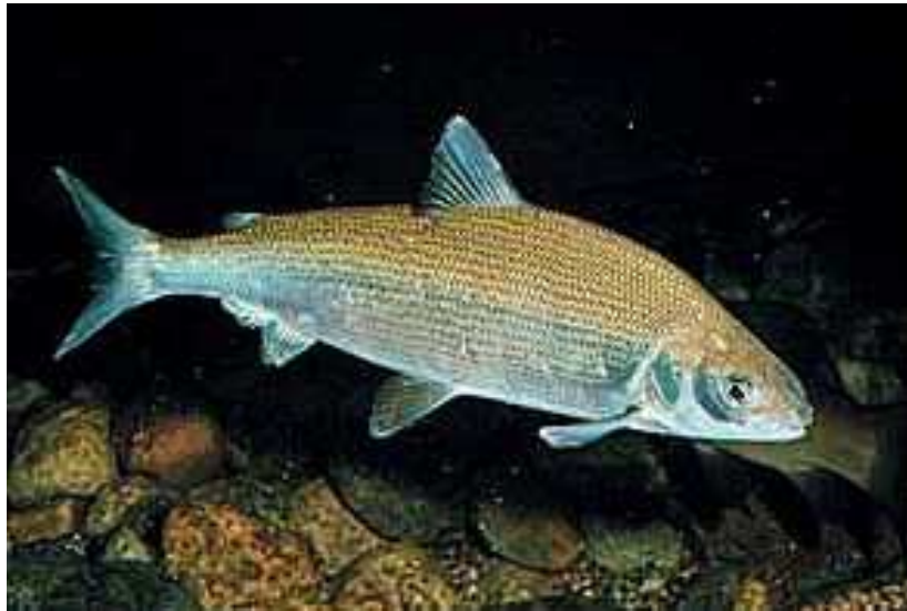
Slika 4. Coregonus lavaretus

Iz porodice Coregonidae (Sl. 4.), najčešće naseljava i hladna jezera, a alohtona je samo u jezerima Bourget u Francuskoj i Geneva u Švicarskoj iz kojih je unesena u još neka europska jezera. U Hrvatskoj je unesena u samo neke rijeke i akumulacije (Peruća). Ima vrlo veliku morfološku i genetičku varijabilnost i ponekad je veliki problem razlikovati ju od ostalih vrsta roda Coregonus . ( http://zasticenevrste.azo.hr/vrsta.aspx?id=211 )