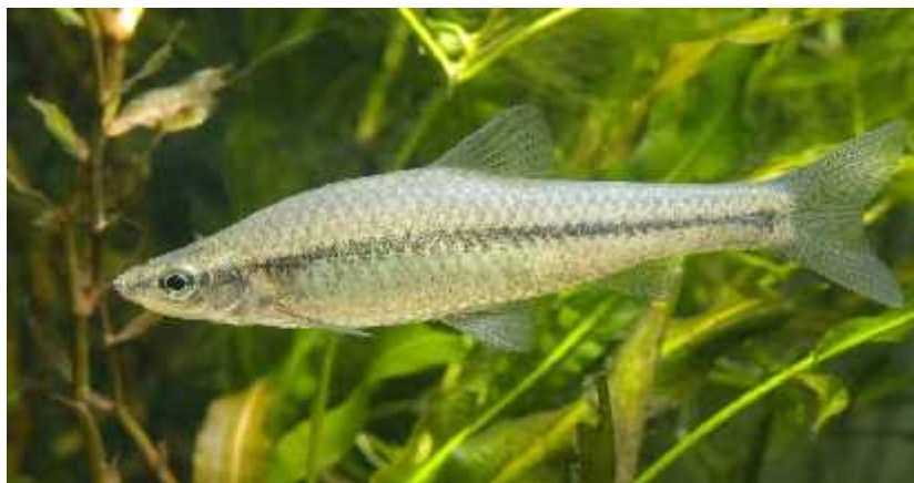
Slika 12. Pseudorasbora parva

Ova mala ribica (Sl. 12.) iz Japana najprije je ušla kao pridošlica u Kini. Oko 1960. godine iz pokrajine Yang Tse Kiang unesena je u Rumunjsku. Toan datum unosa u našu zemlju nije poznat, ali se pretpostavlja da je 1970-ih godina već bila prisutna u našim vodama. Osamdesetih godina dvadesetog stoljeća našla je u svim ribnjacima i u nekim otvorenim vodama. Danas naseljava gotovo sve vode jadranskog i crnomorskog slijeva Hrvatske, a pronađena je skoro u svim vodama gdje je provedeno poribljavanje šaranom. Hrani se planktonom, vodenim kukcima i biljem ali napada i ribe. Iznimno je agresivna vrsta koja uzrokuje promjene u domaćim ribljim zajednicama. U najvećoj su opasnosti endemske vrste koje nastanjuju vodotoke jadranskog slijeva jer u tom slijevu ne postoje prirodni grabežljivci koji bi mogli uništiti bezribicu. ( www.ribe-hrvatske.com )