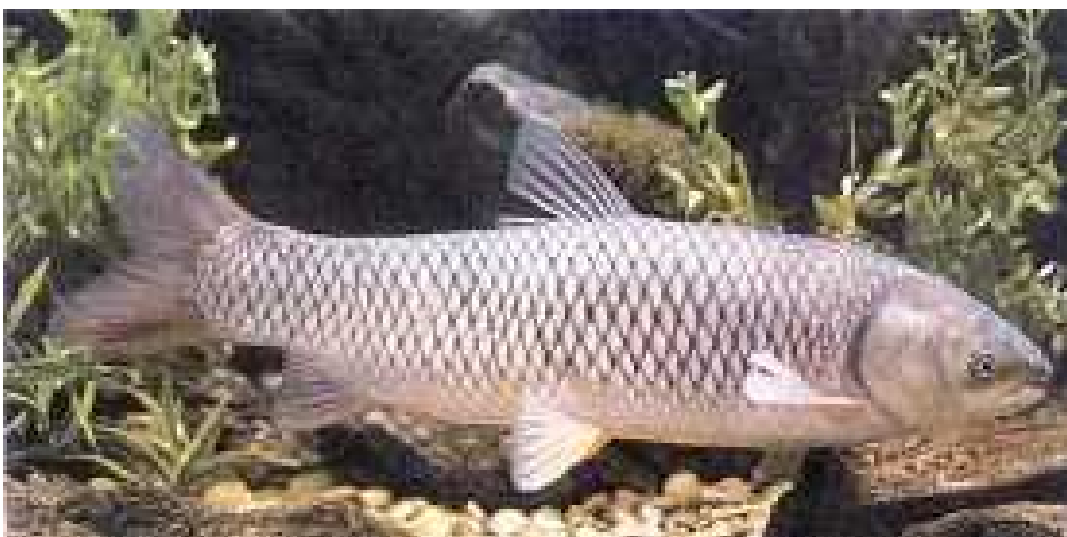
Slika 9. Ctenopharyngodon idella

Pripada porodici Leuciscinae i dolazi iz Kine (Sl. 9.). Biljojed je, pa je unesen je u europske vodotoke 1960-tih i 1970-tih godina radi kontrole vodene vegetacije u ribnjacima, a odatle se proširio u otvorene rijeke i sustave. Brojnost bijelog amura u rijekama crnomorskog sliva, posebice u rijeci Dravi, vrlo je velika pa ozbiljno ugrožava prirodne populacije ostalih vrsta. Premda se vjerovalo da se ne mrijesti u otvorenim vodama, velike populacije te vrste upozoravaju da ni ta mogućnost nije isključena. ( www.ribe-hrvatske.com )