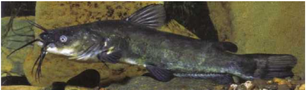
Slika 2. Ameiurus melas

Pripada porodici Ictaluridae , donesen iz isto nog dijela Sjeverne Amerike u srednju Europu odakle se brzo proširio ostatkom kontinenta pa tako i našim vodama. Ima sluzavo tijelo i slijep je pa koristi br i e kao osjetilo (Sl. 2.). Po tijelu ima bodlje pa nema puno prirodnih neprijatelja što mu omogu ava nesmetano i brzo razmnožavanje. U Hrvatsku je unesen po etkom prošlog stolje a i to prvo u ribnjake zbog uzgoja odakle se proširio u otvorene vode. Za sada je rasprostranjen u vodama dunavskog slijeva ali postoje naznake da se polako po eo širiti i jadranskim slijevom. ( www.ribe-hrvatske.com )