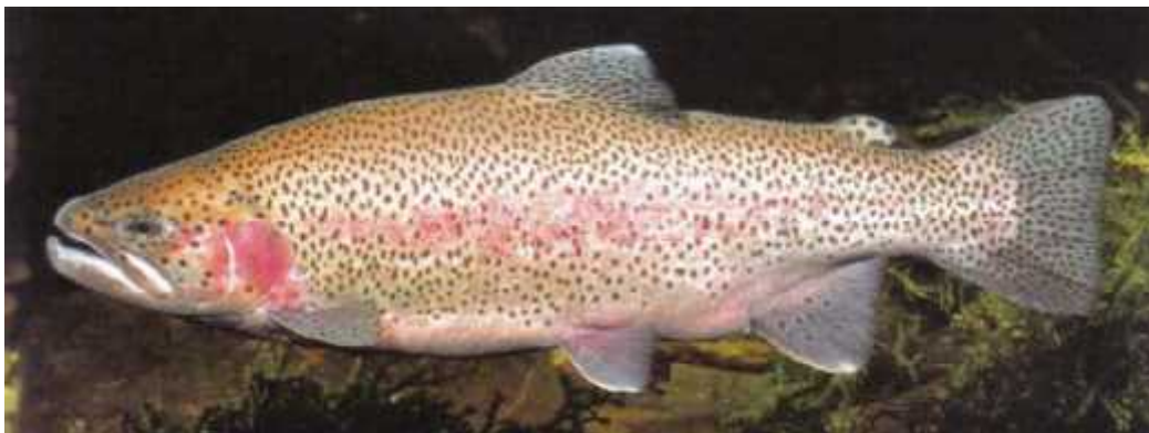
Slika 6. Oncorhynchus mykiss

Naše vode su njome poribljene 1893. godine i kod nas se tako er iz uzgajališta proširila u otvorene vode i smatra se jednim od glavnih uzroka ugroženosti nekih naših doma ih riba. ( www.ribolov.hr )