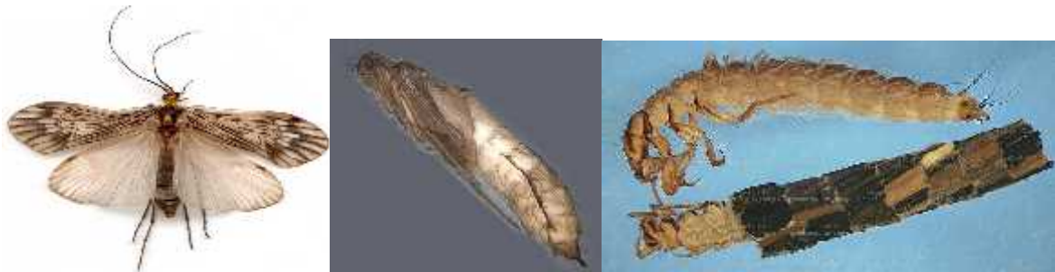
Slika 3. a) Odrasla jedinka Trichoptera ( http://www.lesinsectesduquebec.com ), b) kukuljica Trichoptera ( http://www.mdfrc.org.au ) i c) li inka Trichoptera ( http://www.aquatax.ca/trichoptera.html )

nastanjuju lenti ka staništa i privremena vodna tijela. Imaju potpunu preobrazbu i prolaze kroz četiri životna stadija: jaje, li inka, kukuljica i odrasla faza.