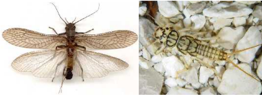
Slika 2. a) Odrasla jednika Plecoptera ( http://lesinsectesduquebec.com ) i b) li inka Plecoptera ( http://zoology.fns.uniba.sk )