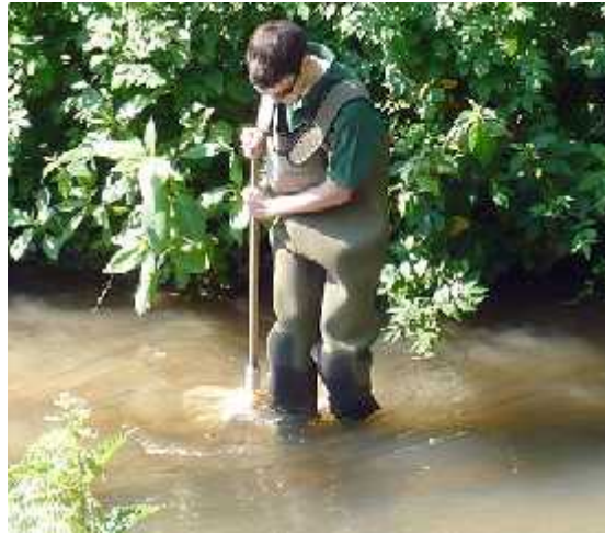
Slika 5. Primjena kick-sample metode ( http://www.oart.org.uk )

Li inke se najbolje sakupljaju kick-sample metodom (Slika 5.). Materijal sa dna se resuspendira udarcem noge ispred otvora mreže, a zatim struja vode ponese podignuti materijal s li inkama u mrežu.