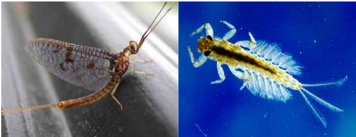
Slika 1. Odrasla jedinka i ličinka Ephemeroptera

male fiziogeografske prepreke kao što su male ravnice. Smatra se da je to posljedica njihove slabe sposobnosti raspostranjenja, dok se njihova odsutnost u polarnim područjima veže uz termotoleranciju. Fauna Ephemeroptera najraznolikija je u tektonički umjerenim područjima gdje predstavljaju važne članove bentičkih zajednica (Williams i sur., 1992).