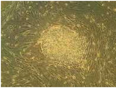
Slika 1. Matična stanica

Najveći izvor ljudskih matičnih stanica je ljudski embrio. Embrionalna matična stanica može dati svaku stanicu našeg tijela, odnosno mogu se diferencirati u sva specijalizirana embrijska tkiva, a uzimaju se iz embrija kada je u stadiju blastociste, odnosno kada je star 5-7 dana, prije nego se embrij uništava. Kod odraslih organizama, matične stanice djeluju kao sustav popravka za tijelo, nadopunjuju i specijalizirane stanice. Matične stanice odraslog čovjeka su nediferencirane stanice koje se mogu naći i u tijelu djece i odraslih osoba. One se mogu dijeliti kako bi zamijenile umirujuće stanice i regenerirale oštećeno tkivo. Zna se i kao somatske matične stanice, a njihova upotreba u svrhu istraživanja nije toliko kontroverzna kao embrionalne matične stanice, jer proizvodnja odraslih stanica ne zahtijeva uništenje embrija.