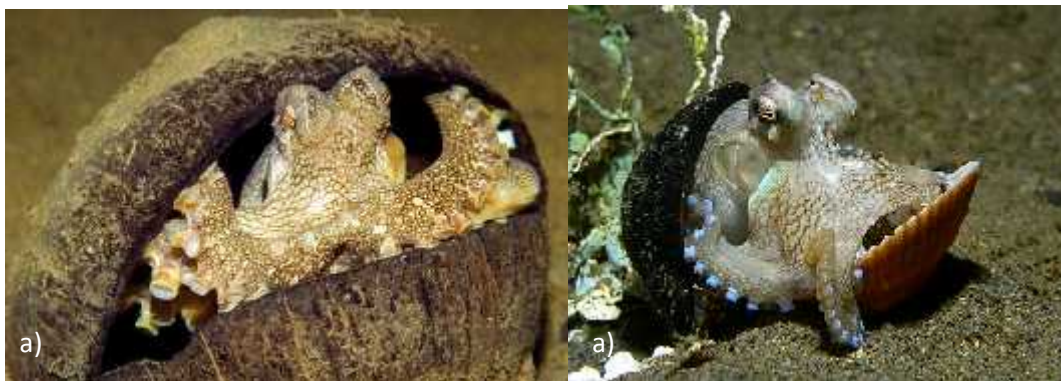
Slika 5. Upotreba alata. Hobotnice upotrebljavaju ljusku kokosovog oraha (a) i ljušturu školjkaša (b) kao štit i sklonište koje nose sa sobom (preuzeto s http://io9.com/veined-octopus/ ).

važnost REM fazi sna u razvoju inteligencije. No ostaje velika nepoznanica zašto bi se razvilo toliko kognitivnih značajki karakterističnih za socijalne, dugoživu i kralježnjake u ovih samotnijih životinja koje u prosjeku žive svega godinu dana, razmnožavaju se jednom te ugibaju kratko nakon što polože jaja ( http://discovermagazine.com/2003/oct/feateye ).