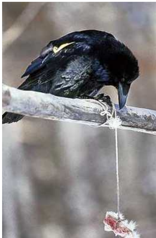
Slika 6. Gavran u procesu dohvatanja mesa.

razmišljanju ovih ptica. Grupa pripitomljenih gavrana suoena je s problemom dohvatanja mesa obješenog na granu tako da ga u letu nisu mogli zgrabiti. Nakon početnih neuspjeha, ptice su se prestale truditi. Kasnije, bez ikakvog povoda, jedna je ptica sletjela na granu, povukla žicu, stala na nju pa opet povukla i tako sve dok nije dosegla hranu (slika 6). Nedugo zatim, problem su riješili i drugi gavrani, svaki na malo drukčiji način. Gavrani su time pokazali sposobnost smišljanja rješenja u svojoj glavi prije primjene u stvarnom svijetu koristeći i se takozvanom mentalnom metodom pokušaja i pogreški koja se smatra glavnim dokazom mišljenja (Gould 2004).