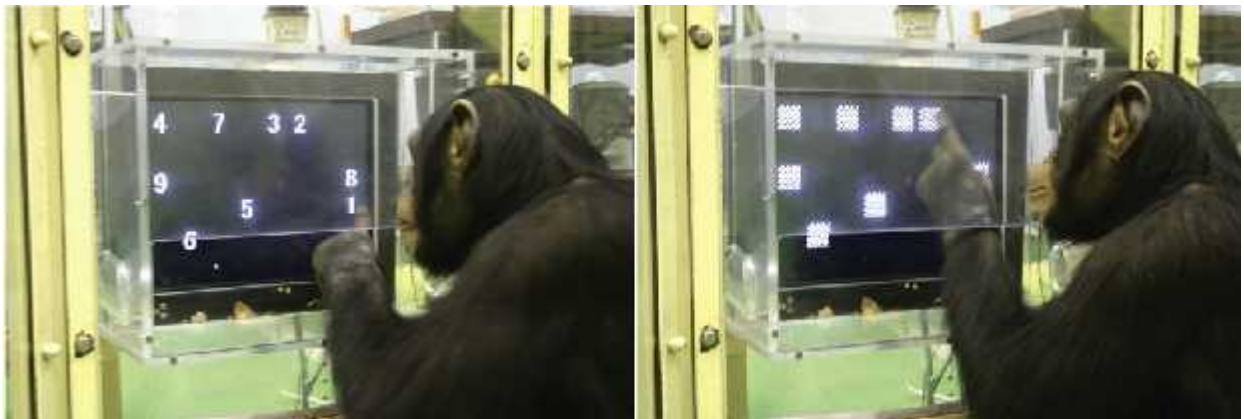
Slika 1. impanza izvodi zadatak odre ivanja pravilnog poretka brojeva. Pravilnim odabirom prvog broja, ostali brojevi budu prekriveni bijelim kvadratima te impanza po sje anju bira ostale brojeve.