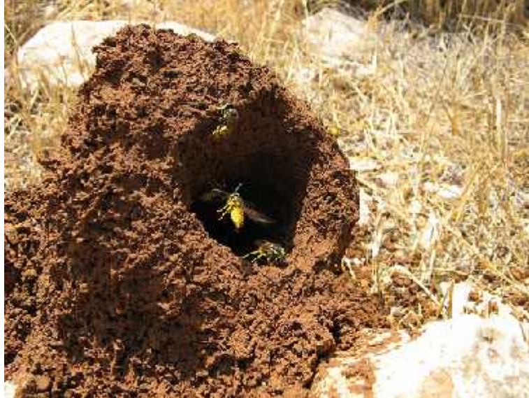
Slika 10. Vespa Germanica gradi gnijezdo na zemlji

izlegla dovoljno radilica koje će preuzeti izgradnju gnijezda ostavljaju i kraljicu da se usredotoči na reprodukciju. Iz tog razloga, veličina gnijezda je općenito dobar pokazatelj koliko otprilike radilica ima u koloniji, a neka stršljenova gnijezda na kraju narastu do veličine loptice za picigin.