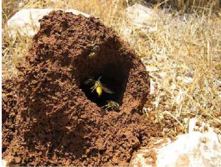
Slika 10. Vespa Germanica gradi gnijezdo na zemlji

izlegla dovoljno radilica koje će preuzeti izgradnju gnijezda ostavljaju i kraljicu da se usredotoči na reprodukciju. Iz tog razloga, veličina gnijezda je općenito dobar pokazatelj koliko otprilike radilica ima u koloniji, a neka stršljenova gnijezda na kraju narastu do veličine loptice za picigin.