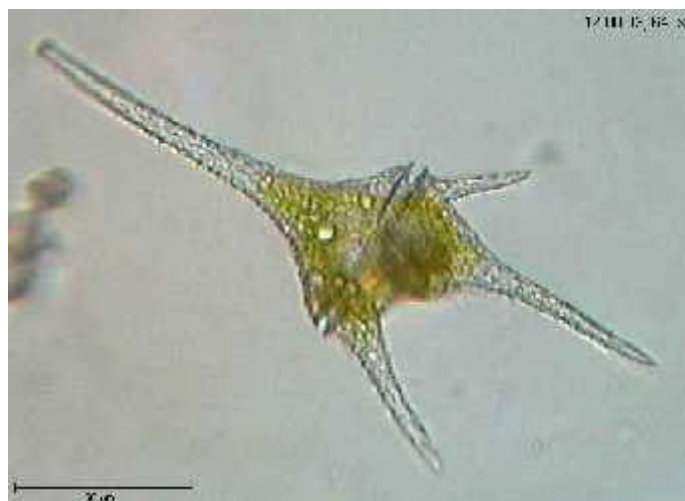
Slika 3. Dinoflagelat roda Ceratium