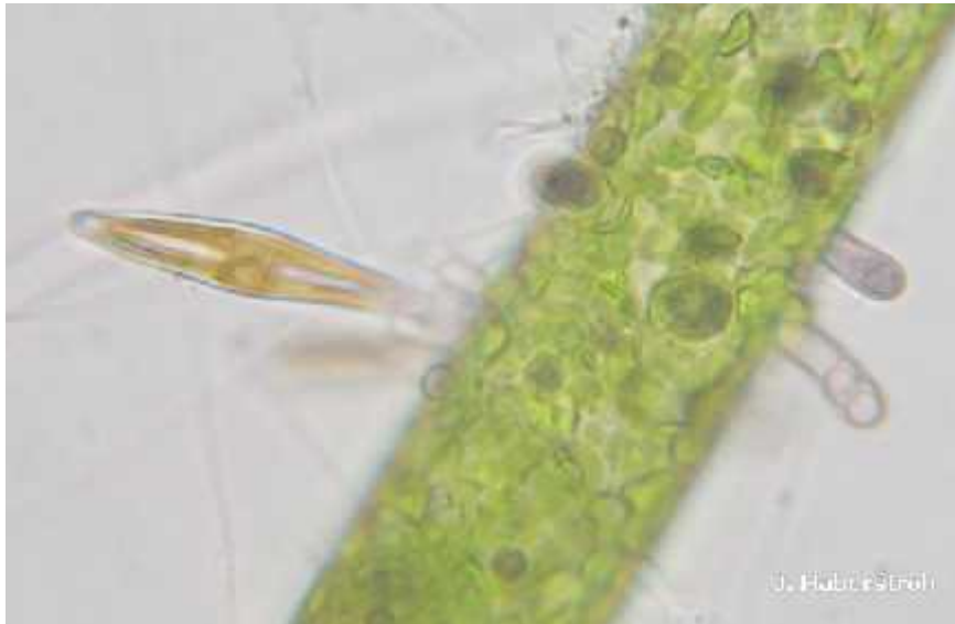
Slika 2. Achnantes sp. na zelenoj algi Cladophora