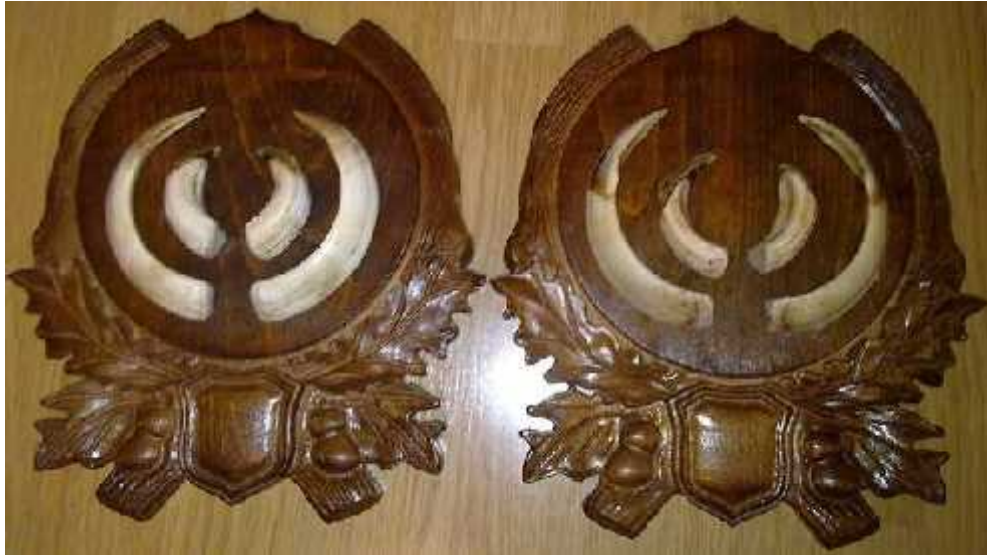
Slika 3. Trofeji su, uz meso, glavni razlog lova na divlje svinje

Povećanje brojnosti populacije dovelo je do migracije divlje svinje u nove predjele. Na taj način se ova vrsta pojavila na cijeloj jadranskoj obali, uključujući i Dubrovnik i primorje i Konavle. Migracija se nastavila i preko mora, pa se tako ova vrsta naselila i na otocima poput Krka, Cres, Mljet, Hvar i Brač. Najimpresivnije je naseljavanje otoka Mljet, budući da je najbliže kopno od ovog otoka udaljeno 6 kilometara. Zabilježeni su susreti ribara sa divljim svinjama u moru, pogotovo u Malostonskom zaljevu i prolazima Mali i Veliki Vratnik. U dubrovačkom predjelu divlje svinje su se prilagodile izrazito nepristupačnom staništu, budući da se radi o kršu obraslom gustom neprohodnom makijom. Međutim, takvo stanište je bogato hranom i bez prisutnosti njihovih prirodnih neprijatelja, a previše je neprohodno i za ovjeka. Rezultat toga je prekomjerno razmnožavanje i prevelika brojnost divlje svinje na dubrovačkom području. Brojnost se zbog nepristupačnosti terena ne može utvrditi uobičajenim metodama, ali je vidljiva po velikim štetama na poljoprivrednim površinama. Prevelika brojnost predstavlja i opasnost od širenja zaraznih bolesti, poput bjesnoće i trihineloze. Divlje svinje su se zbog prekomjernosti na otocima počele spuštati iz šuma do plaža i naselja. Na otocima su zbog tih razloga ukinuti propisi koji brane lov na divlje svinje u određenim periodima tijekom godine, pa se sada ova divlja izlovljava tijekom cijele godine.