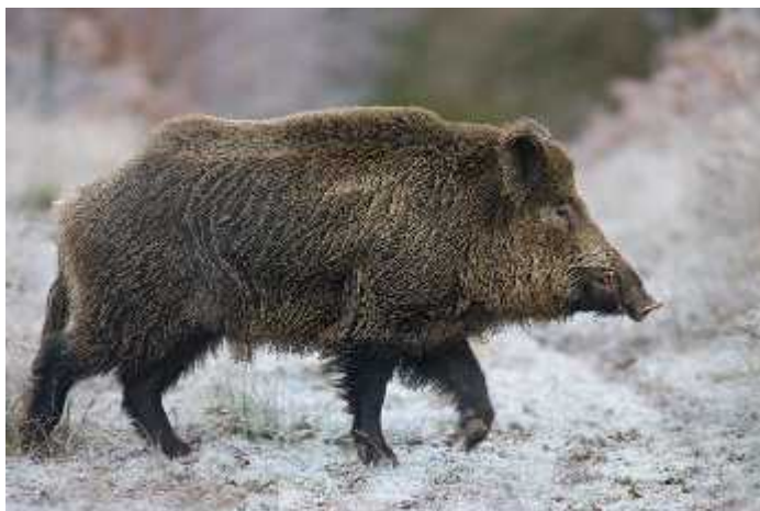
Slika 1. Odrasli primjerak divlje svinje ( http://www.britishwildboar.org.uk/ )

Glavne karakteristike divlje svinje su njezin kratak vrat, snažno mišićavo tijelo prekriveno šikinjama, velika glava sa izduženom njuškom koja završava rilom i uspravne uši također prekrivene šikinjama. Imaju male oči i vid im nije naročito razvijen. Rilo je pokretna koštana tvorevina na njušci pokrivena sluznicom koja služi za rovanje terena u potrazi za hranom. Prilikom traženja hrane svinja se primarno oslanja na osjet mirisa. Ovisno o starosti i spolu jedinice mijenja se i boja šikinja. Radi se o nijansama smeđe boje, kako bi se uklopila u okolinu. Mladi imaju karakteristične crne uzdužne pruge koje nakon navršenih dva mjeseca života nestaju. Udovi divlje svinje su kratki i mršavi, a njeni papci završavaju sa četiri prsta, s tim da je prvi u potpunosti atrofirao. Na trećem i četvrtom prstu imaju duge pandže, dok su na drugom i petom puno kraći, zbog čega ostavljaju karakterističan trag kretanja. Rep divlje svinje je kratak i završava sa snopom šikinja.