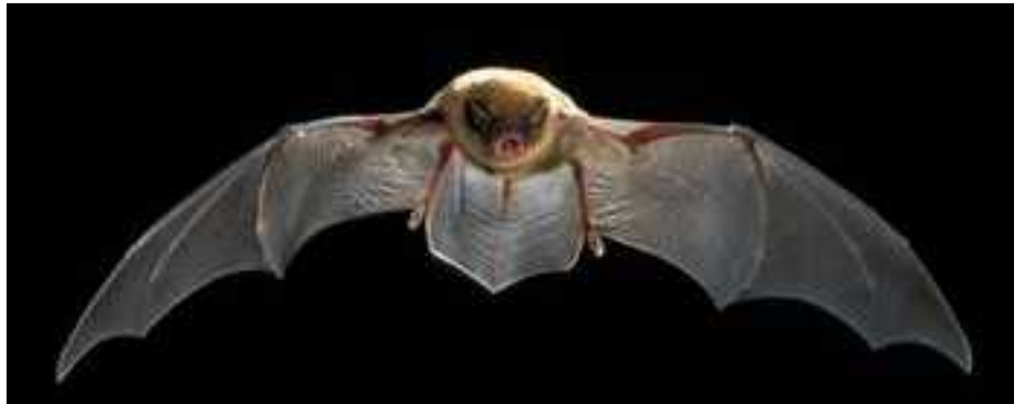
Slika 10 - Miniopterus schreibersii

Hrani se malim kukcima, gotovo isključivo s noćnim leptirima i ponekad dvokrilcima. (Dietz i sur., 2009.)