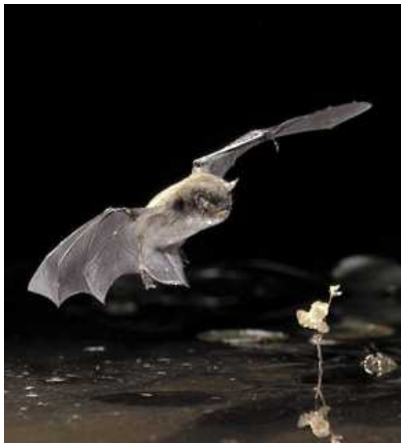
Slika 6 - lov nad vodom ( http://jeb.biologists.org/content/204/22/F1.medium.gif )