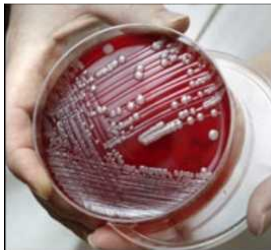
Slika 1. Kolonije bakterije Acinetobacter baumannii porasle na krvnom agaru ( http://www.acinetobacter.org/ )

U ovom radu osvrnuti su se, osim na glavnu temu - mehanizme rezistencije, i na taksonomsku podjelu i biologiju vrste A. baumannii , na bolničke manifestacije infekcije, te na metode detekcije bakterije.