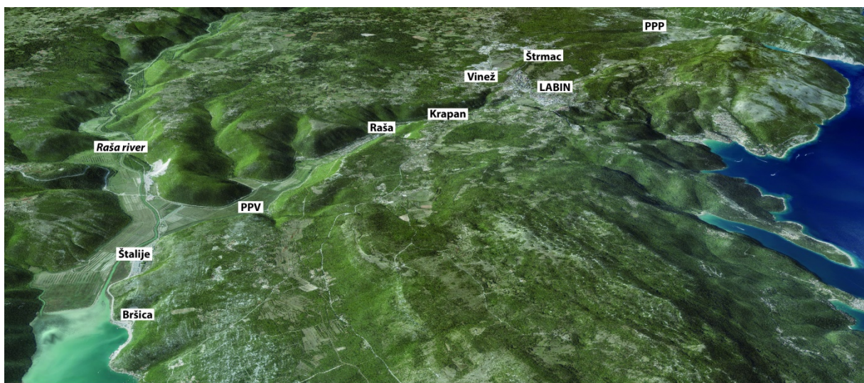
Slika 1. Geografski smještaj istraživanog područja

Labinština (slika 1) se nalazi na istočnoj strani obale Istre, između Rijeke i Pule. Najveći grad tog područja je Labin, koji sa svojom okolicom čini manji poluotok dugačak 23 i širok 13 kilometara. Istraživano područje na jugu graniči rijekom Rašom i zaljevom, na istoku Kvarnerom, na sjeveru Plominskim zaljevom dok ga na zapadu određuje isušeno Čepičko polje (Matošević, 2011). Dva privatna vrta, odakle su uzeti uzorci za analizu se nalaze u grad Raši.