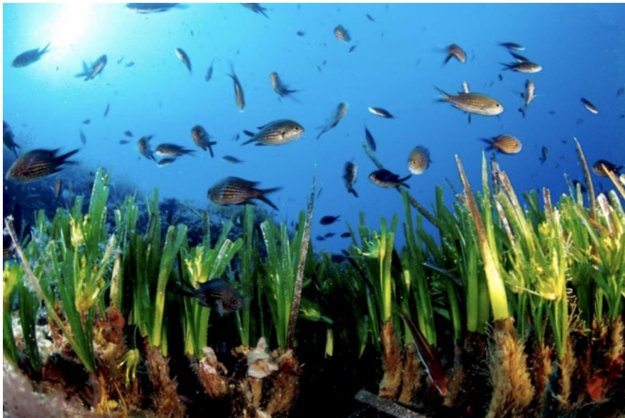
Slika 2. Posidonia oceanica sa zajednicom jedinki Chromis chromis

Promjena u sastavu sedimenta imala je najveći utjecaj na livade posidonije ( Posidonia oceanica ) koja ima ključnu ulogu u ekosustavu Mediterana (slika 2.). Njezine livade su prisutne diljem Mediterana i služe kao izvor hrane za mnoge bentičke organizme, pružaju utočište od predacije i mjesto za razvoj ličinačkih i juvenilnih vrsta riba i člankonožaca, mijenjaju teksturu sedimenta i hidrodinamički režim i povećavaju kompleksnost staništa. Zbog velike produkcije organske tvari služe kao primarni izvor hrane za zajednice koje žive na livadama posidonije kao i za one izvan njih. (Kružić et al., 2014)