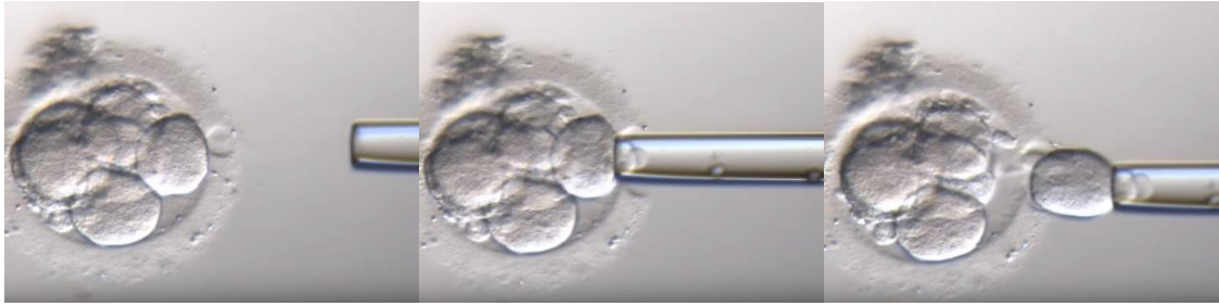
Slika 3. Biopsija blastomere 3. dana od začeca.

Prednosti ove metode što blastomerom možemo analizirati cijeli genom embrija, za razliku od polarnog tjelešca, te time se dobiva cijela genetička slika. Također, ne dolazi do potrebe krioprezervacije embrija s obzirom da postoji dovoljno vremena za dijagnostiku. Pojava koja predstavlja nedostatak ove metode je mozaicizam. S obzirom da mozaicizam definiramo kao postojanje dvije ili više stanične linije različitog genotipa koje su podrijetlom iz jedne zigote, oko 15-80% svih embrija manifestiraju mozaicizam na 3. dan te samim time može doći do pogrešne dijagnostike, tj. do krivog tumačenja genetičke analize te lažno pozitivnih ili lažno negativnih rezultata.