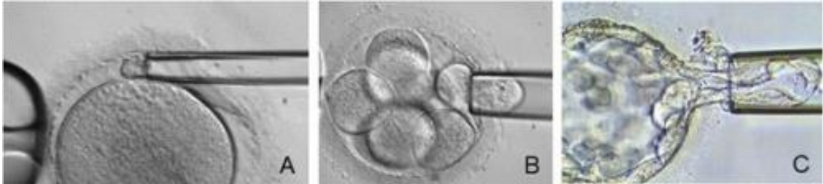
Slika 1: Biopsija polarnog tijela (A), blastomere 6-staničnog embrija (B) i, trofektodermskih stanica blastociste (C) [Preuzeto od 8]

Pomno proučavanje djece rođene nakon provedbe PGD-a ne upućuje na povećanje kongenitalnih anomalija [5] te znanstvenici u SAD-u ukazuju na činjenicu ukoliko bi se uveo besplatan postupak dijagnostike za sve nosioce cistične fibroze da bi se uštedilo nekoliko milijardi dolara. [6,7]