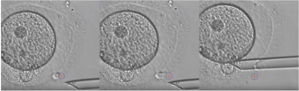
Slika 2: Biopsija polarnog tijela laserskim probijanjem zone pellucide.[Preuzeto sa: 13]

Prednosti ove metode su što biopsija nikako ne utječe na razvoj embrija (Slika 2.), metoda osigurava dovoljno vremena da se naprave genetička testiranja te je najbolja metoda biopsije ukoliko je majka nositeljica određene bolesti. Također, izbjegavaju se sve etičke dvojbe s obzirom na to da se ne radi direktno na embriju. Kao nedostatak najčešće dolazi do izražaja da metoda može samo detektirati majčinske mutacije te mejotičke greške. Često dolazi i do degradacije polarnog tjelešca s obzirom na činjenicu da su polarna tjelešca poprilično mala te kao nedostatak bi se još mogla navesti činjenica da zahtjevaju i sekvencijalnu biopsiju prvog i drugog polarnog tjelešca kako bi se moglo utvrditi u kojoj fazi, tj. u kojem ciklusu mejoze je došlo do eventualne nepravilnosti.