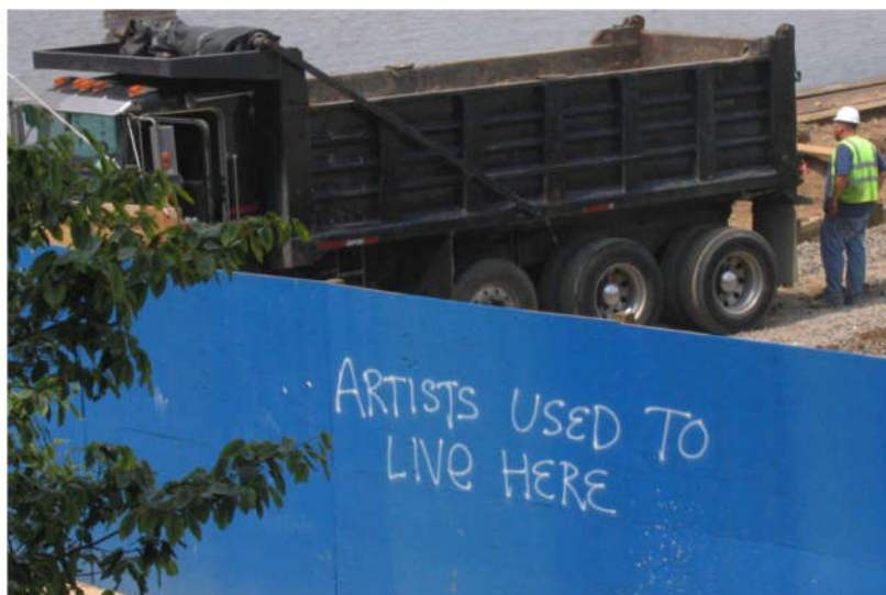
SI.1.: Grafit u Brooklynu, New York City: „Umjetnici su ovdje živjeli“

Kako je hip-hop žanr postigao popularnost, postao je komercijaliziraniji. Drukčije rečeno, hip-hop i rap umjetnici izgubili su kreativnu sposobnost da govore o ozbiljnim društvenim pitanjima velikog značaja, a glazbena industrija ih sve više potiče (možda čak i tjera) na stvaranje glazbe koja se lakše prodaje široj (i bjeljoj) publici. Zbog komercijalizacije hip-hop glazbe, prava svrha te glazbe često se previdi ili trivijalizira temama seksa, droga i nasilja, koje nose komercijalnu prednost nad društveno svjesnim temama. Budući da je hip-hop postao više trivijalna tema nego politički komentar na društvenu promjenu kao reakciju na komercijalizaciju, stereotipi koje Bijelci drže za Afroamerikance su ojačani. Ovdje se govori o gentrifikaciji hip-hop kulture. To predstavlja na primjer „izbjeljivanje“ četvrti New Yorka, Brooklyna, jer je odjednom postalo cool živjeti tamo, te istovremeni gubitak utjecaja hip-hop kulture kao oblika umjetnosti i kao sredstvo otpora (SI.1. i SI.2.). „Kada je hip-hop kultura prisutna, ona je također nevidljiva. Kada je sveprisutna, onda je nigdje“ (Questlove, 2014).